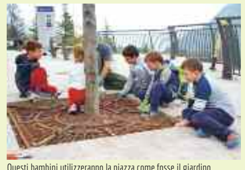
Questi bambini utilizzeranno la piazza come fosse il giardino di casa propria