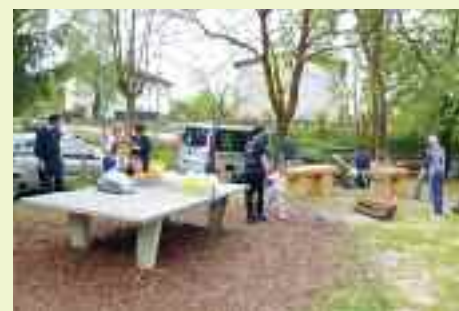
Di primo mattino si comincia a programmare i lavori all'interno del Villaggio