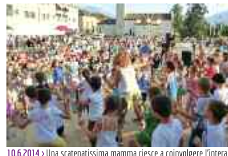
10.6.2014 > Una scatenatissima mamma riesce a coinvolgere l'intera piazza in un ballo collettivo durante la festa di fine anno organizzata congiuntamente dall'Istituto Comenius e Circoscrizione