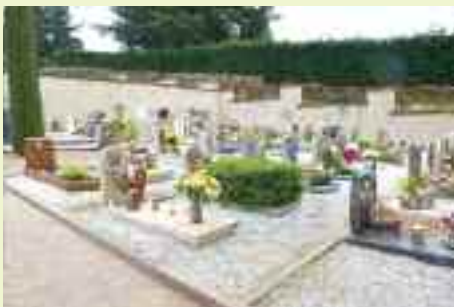
Gli Amici della Montagna si fanno carico di pulire l'area cimiteriale di Martignano. Raccolgono un sacco di rifiuti e moltissimi complimenti