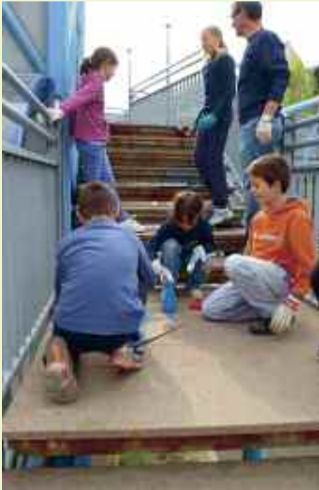
Genitori e studenti del Comenius ritinteggiano le orme lungo il pedibus che fanno tutte le mattine