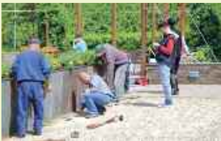
La pulizia delle canalette dalla terra e sabbia è un esempio di lavoro che l'Amministrazione non riesce quasi più a garantire con sistematicità