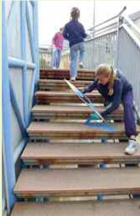
Giovanissimi volontari tinteggiano il percorso Piedi sicuri, per raggiungere a piedi e in sicurezza la Scuola