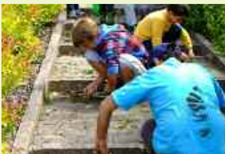
Gioco, festa e senso di responsabilità si fondono dentro questa giornata