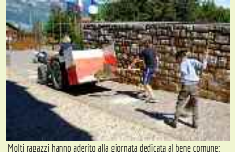
Molti ragazzi hanno aderito alla giornata dedicata al bene comune; ciò significa che gli adulti stanno lavorando bene e garantiscono un futuro alla Comunità