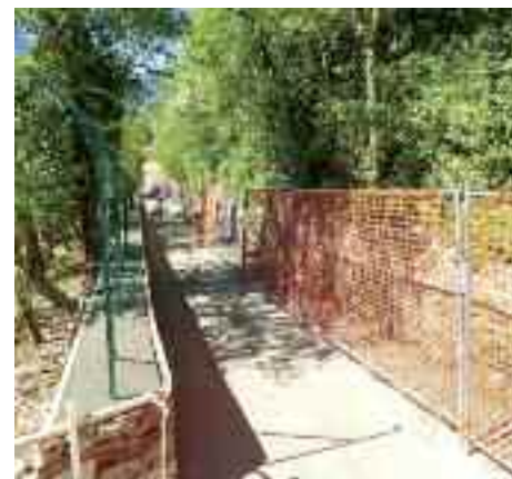
Con l'area cani si sono realizzati vari manufatti