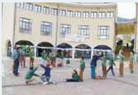
Il gruppo scout CNGEI si fa carico saltuariamente di pulire e tinteggiare le colonne di Piazza Argentario