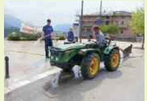
Grandi pulizie di primavera