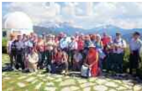
7.6.2014 > I soci del Circolo Culturale organizzano una camminata sul sentiero dei pianeti in Alto Adige. Sullo sfondo il Catinaccio nel gruppo Latemar