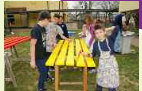
Gli alunni della Scuola elementare "Zandonai" partecipano entusiasti alle attività di carteggiatura e tinteggiatura di panche e tavoli esterni