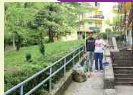
Alcuni volontari puliscono Via Poja