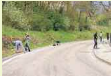
Alcuni cittadini si prendono cura della pulizia di Via del Forte a Martignano