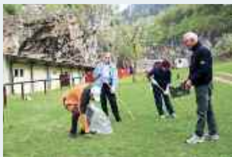
Il gruppo culturale del Comitato di Martignano ha preso in carico, in attesa che venga riaperto, l'area esterna di Riparo Gaban