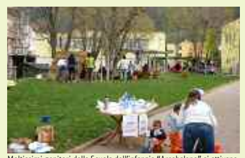
Moltissimi genitori della Scuola dell'infanzia "Arcobaleno" si attivano per sistemare gli spazi esterni della scuola. Diventa di fatto una festa per le nuove famiglie di Martignano