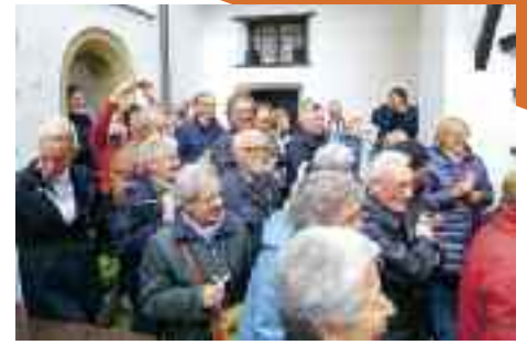
3.5.2014 > Una delegazione dell'Argentario è accolta, nelle sale del Castello, dal Sindaco di Schwaz