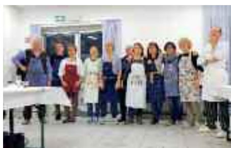
5.4.2014 > Grande serata di MasterChef al Mont. Nove cuochi provetti preparano una cena con degustazione di vini nel mentre gli ospiti decretano il gruppo di cucina migliore