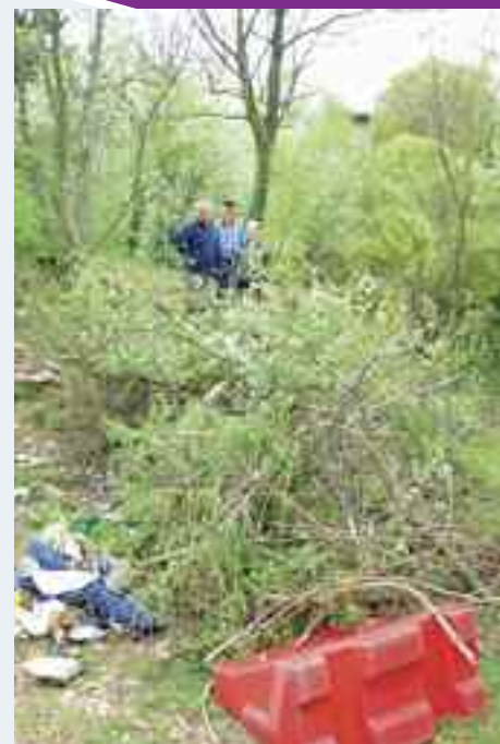
Il Circolo Culturale di Cognola sta pensando di adottare l'anfiteatro naturale sopra il Centro Civico per farne un luogo di incontro e cultura