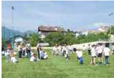
9.5.2014 > Una bellissima giornata ha accompagnato la Festa di Primavera negli spazi sportivi delle Marnighe di Cognola