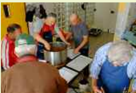
Il pranzo per i volontari è appetitoso e abbondante