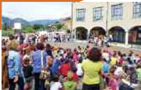
30.5.2014 > La giornata dedicata ai giovani cittadini attivi che ha coinvolto insegnanti e i giovani cittadini della Scuola elementare "Bernardi". Si conclude insieme nella Piazza Argentario