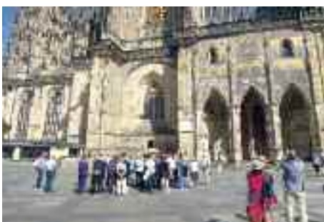
22.5.2014 > Gli anziani del Circolo Le Querce di Cognola visitano la Cattedrale di S. Vito a Praga