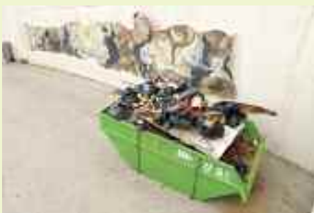
La benna di Dolomiti Energia è completamente riempita con i rifiuti raccolti sul territorio