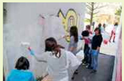
Insegnanti e studenti dell'Istituto Comenius danno una grande prova di responsabilità