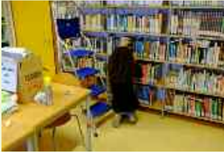
Spolverare i libri del punto di prestito fa parte delle numerose attività di cui il Circolo Comunitario si fa carico