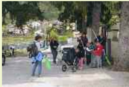
Genitori e bambini della Scuola dell'infanzia "Don Serafini" puliscono le strade che normalmente utilizzano per andare a scuola la mattina