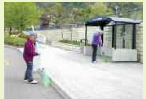
Cittadini vari si impegnano nella pulizia di Via dell'Albera