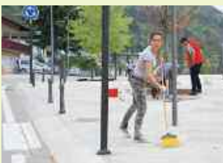
Pulizia e sistemazione della piazza centrale e degli spazi pubblici