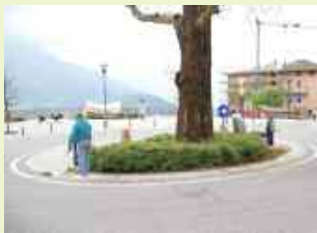
Pulizia e sistemazione delle aiuole nella piazza centrale