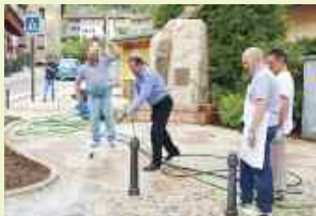
Il sindaco dà spettacolo sulla piazza centrale di Villamontagna