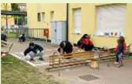
Moltissimi genitori della Scuola dell'infanzia "Arcobaleno" si attivano per sistemare gli spazi esterni della scuola, dando vita a una bellissima esperienza di gestione del bene comune