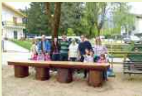
A fine giornata un gruppo di volontari posa davanti all'opera appena realizzata e ancora fresca di vernice