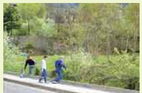
Volontari vari ripuliscono il territorio