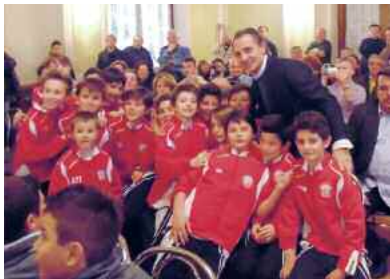
I pulcini poco prima della premiazione nella sala del Casinò di Arco con Mister nazionale Prandelli.

I pulcini "classe 2003" del Gruppo sportivo "Calisio Calcio" allenati da Mister Diego Braitto hanno avuto la possibilità di giocare e vincere il torneo "Beppe Viola" ad Arco. Questo torneo, famoso anche per la partecipazione nella categoria allievi di squadre professionistiche, è di fatto la kermesse più ambita da tutti gli addetti ai lavori della provincia e delle regioni limitrofe anche per la categoria dei piccolini. Ai nastri si radunano 64 squadre che vengono dimezzate di domenica in domenica fino a eleggere il quartetto finale che si fregia del titolo. La bella novità è che i pulcini calisiani hanno vinto e con le loro gesta hanno contribuito a far conoscere a tutti il nome della società "Calisio Calcio" e della Circostrizione Argentario.