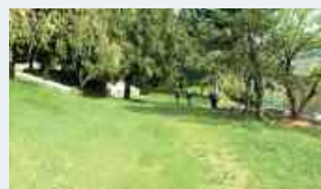
A Casa Serena si sta avviando un processo di presa in carico dell'area verde da parte di un gruppo di cittadini; da questa storia potrebbe nascere un'altrettanto straordinaria storia di integrazione sociale