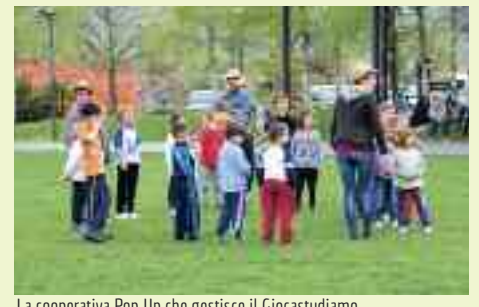
La cooperativa Pop Up che gestisce il Giocastudio si mette a disposizione per offrire un momento di animazione pomeridiana ai piccoli volontari