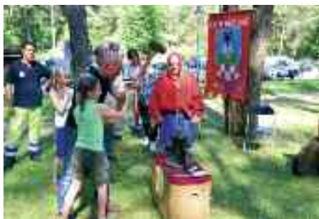
8.6.2014 > Folla partecipazione alla passeggiata enogastronomica del Cucchiaino d'Argento