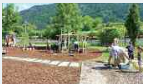
Genitori, bambini e insegnanti delle Scuole dell'infanzia "Arcobaleno" e "Don Serafini" si prendono cura del parco giochi di Martignano, dando vita a un significativo processo di presa in carico del bene comune