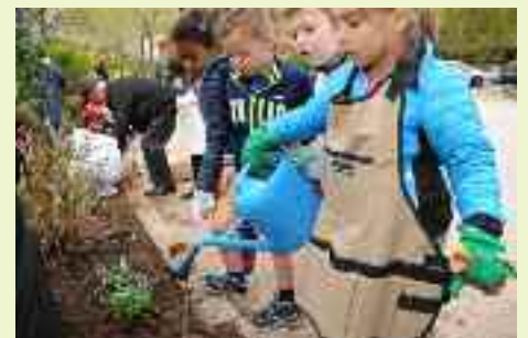
Presso le scuole elementari nonni e genitori si adoperano per insegnare ad avere cura del giardino