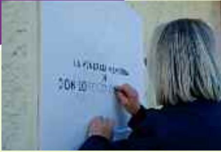
Una signora si occupa di ridare lustro a una vecchia lapide che ricorda Don Lorenzo