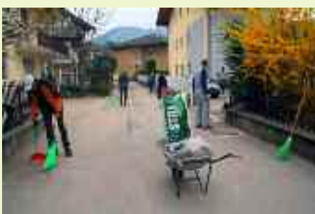
Un gruppo di cittadini si attiva per pulire Via Don Serafini, la via dove risiedono abitualmente