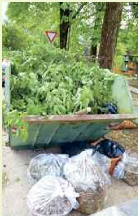
La benna consegnata da Dolomiti Energia è quasi piena, ma ci sono ancora molti sacchi e ramaglie che devono arrivare