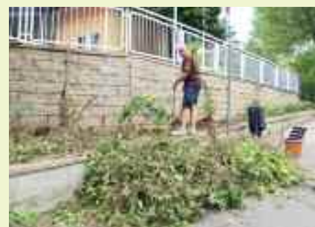
Taglio e pulizia delle aiuole davanti alle scuole di San Vito