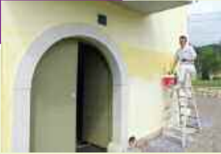
C'è chi mette a disposizione materiale e competenze professionali per abbellire i pochi spazi comuni della Comunità