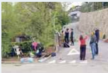
In località Zell un gruppo di cittadine e cittadini realizzano e adottano una piccola e bella aiuola