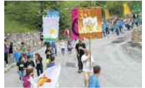
11.5.2014 > Il sobborgo di Villamontagna durante la disfida delle contrade, una manifestazione che sta raccogliendo un grandissimo consenso nel sobborgo