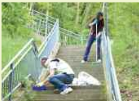
Alcuni volontari si occupano di tenere pulita la scala di San Vito