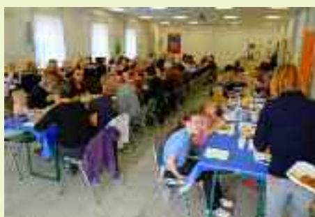
La sala è al completo, anche perché sono ospiti alcuni volontari e utenti di Telefono Argento