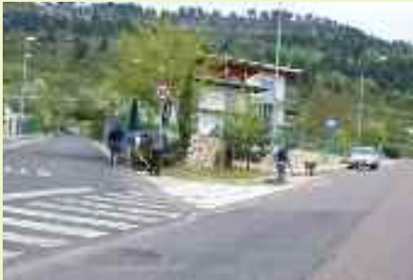
Diversi spazi semiabbandonati sono riportati alla loro destinazione naturale