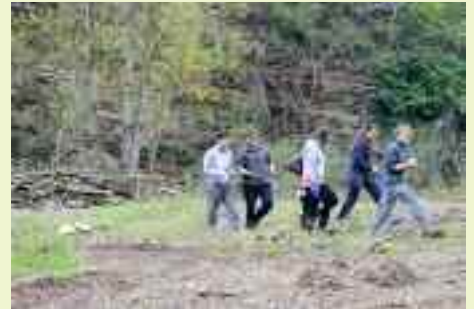
I giovani scout di Cognola raccolgono tutto il giorno materiale dal fiume Fersina, con un ottimo bottino a fine giornata