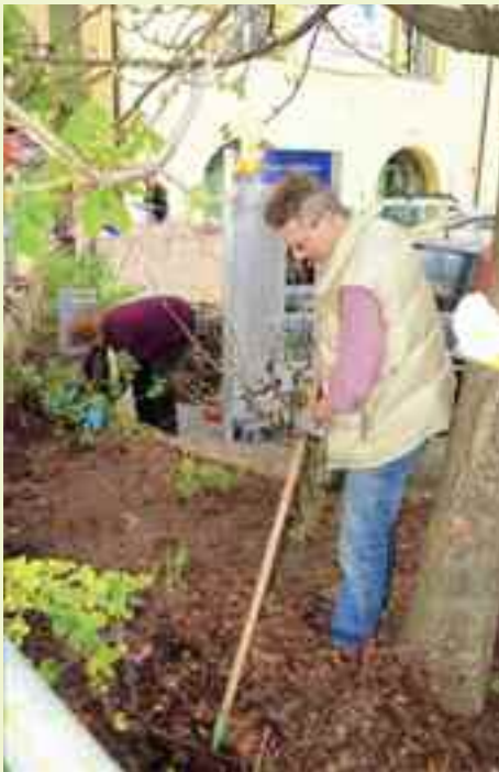
Alcuni soci del Circolo Anziani si attivano per pulire e rinnovare le fioriere di Piazza dei Canopi