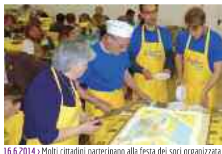
16.6.2014 > Molti cittadini partecipano alla festa dei soci organizzata dalla Cassa Rurale. In primo piano la torta che ha convinto tutti nel darsi appuntamento anche all'anno prossimo