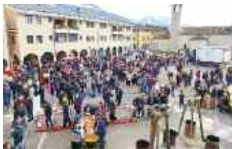
4.3.2014 > Il carnevale di Cognola, organizzato dal Comitato Carnevale di Cognola con l'aiuto degli Alpini, raccoglie sempre grande consenso popolare