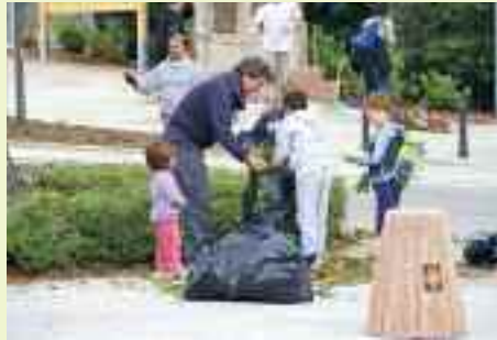
È importante coinvolgere ed educare i bambini alla cura del bene comune