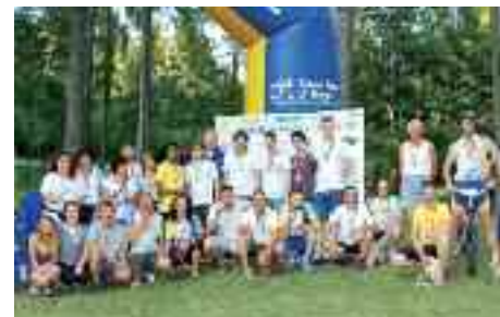
8.6.2014 > Il MIR di Villamontagna ha organizzato con successo il trofeo Idea-memorial Rossi, nella piana di Campel