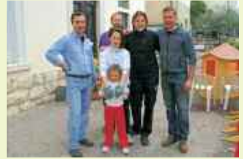
Diversi genitori si sono occupati dei lavori di pulizia e sistemazione delle attrezzature della scuola dell'infanzia