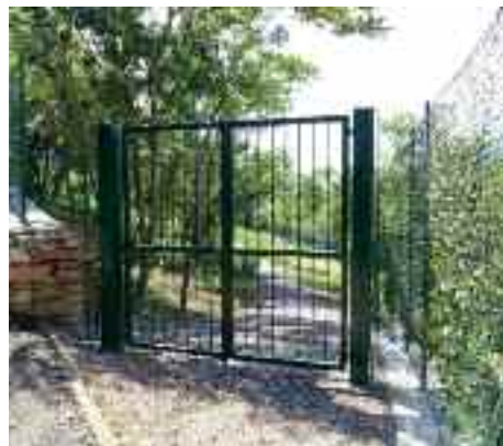
La nuova area cani a Martignano sarà presto inaugurata