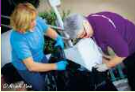
Alcune signore si occupano di pulire le scale e rimettere a nuovo le fioriere del Centro Civico di Cognola