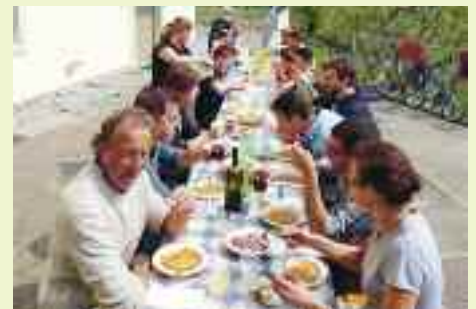
La bella giornata ha permesso di sistemarsi anche all'esterno della sala e trasformare il pranzo in momento di festa