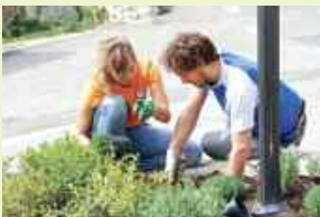
Rincuora vedere i giovani che trascorrono una giornata fuori dagli schermi. E sembrano anche divertirsi