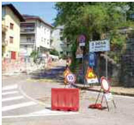
In realizzazione il nuovo marciapiede a San Donà

battuti con riscontri anche sulla stampa locale. Sono quindi possibili significative novità in merito all'ipotizzata realizzazione del tunnel. ■