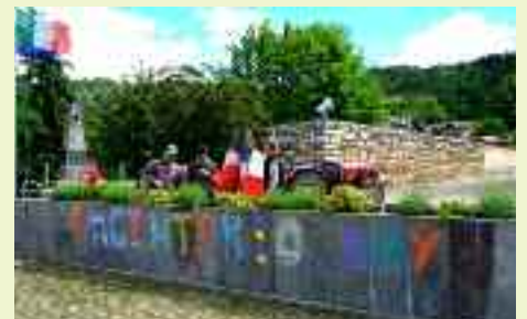
Anche gli artisti trovano spazio dentro Argentario Day