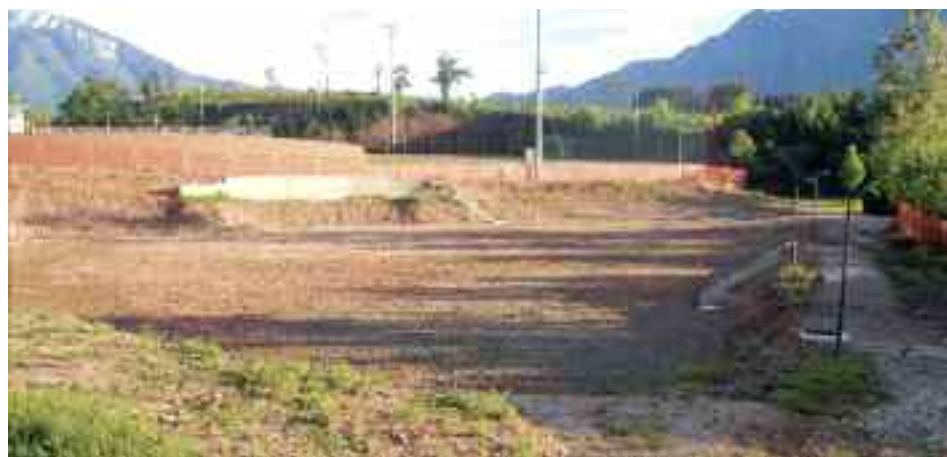
Area destinata all'asilo nido di Martignano

Iniziati i lavori per la costruzione del nuovo asilo nido di Martignano che sorgerà nei pressi del nuovo campo da calcio. Sono già eseguiti i lavori preparatori dell'area e di scavo. A seguito della gara e dell'assegnazione all'impresa si presume che l'inizio