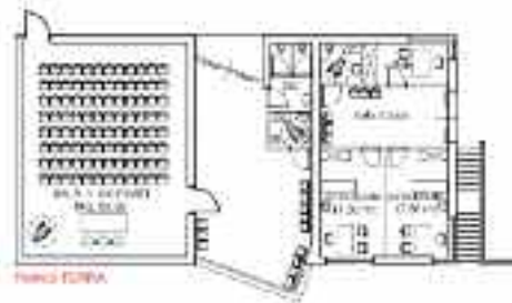
Piano terra del progetto del nuovo Centro sociale di San Donà

A fronte delle tante osservazioni emerse, specie in merito alle ridotte dimensioni, è presumibile che il progetto subisca delle modifiche anche tenendo conto dei suggerimenti che emergeranno da una futura assemblea pubblica.