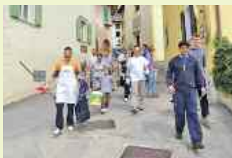
Sembra la carica dei centouno. In realtà è appena suonata la campanella del pranzo