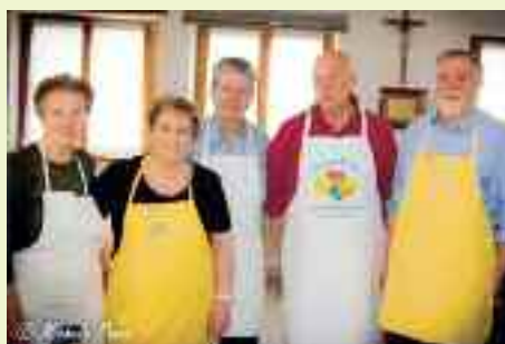
Il Circolo Anziani ha preparato anche quest'anno la colazione e il pasto per circa 150 volontari