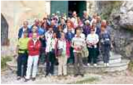
7.5.2014 > Gli "Amici della Montagna", in occasione del trekking mari e monti, posano davanti alla chiesa di Borgi Verezzi, dove si svolge una importante rassegna teatrale estiva