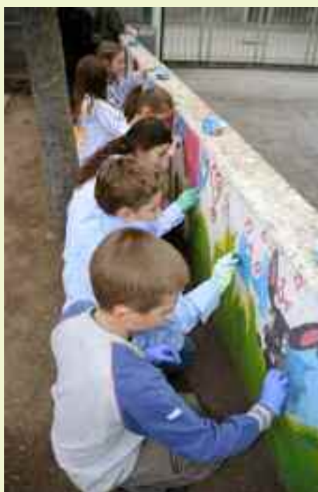
Presso le scuole elementari gli insegnanti si adoperano per educare alla cura del bene comune