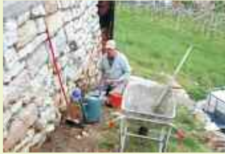
C'è chi rispolvera la propria professionalità per sistemare un vecchio muro con sassi a vista