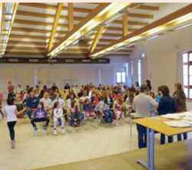
Il momento della premiazione del concorso di disegno indetto per l'Argentario Day