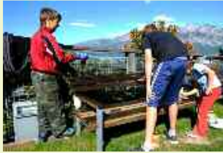
Dei ragazzi si divertono a carteggiare e tinteggiare le panchine del parco