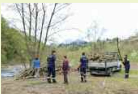
I Vigili del Fuoco Volontari di Cognola liberano da rifiuti e boscaglie un'intera area lungo il Fersina