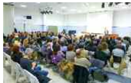
7.3.2014 > Alla scuola media di Povo vengono presentati i lavori dei ragazzi di tutta la collina Est che hanno partecipato al progetto "Life Reporter"