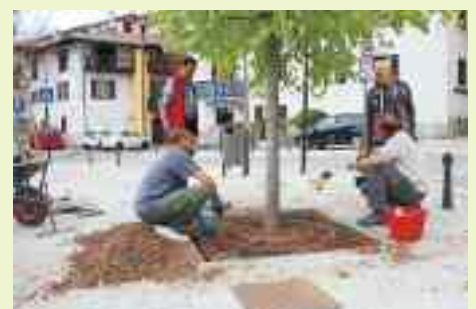
Vengono sistemate le griglie di ferro a protezione delle piante nella piazza centrale