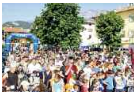
25.5.2014 > Oltre seicento persone partecipano alla marcia non competitiva "Martignana"