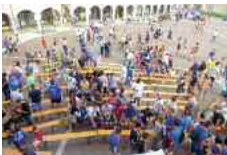
20.6.2014 > Piazza Argentario gremita, in un momento di pausa, durante la visione di Italia-Costarica finita nella delusione