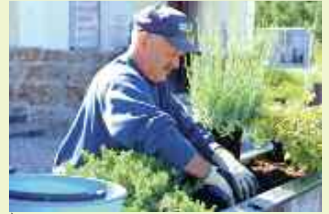
È un'ottima occasione per rinnovare le fioriere con le piante offerte dal Servizio Verde del Comune di Trento