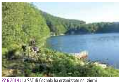
22.6.2014 > La SAT di Cognola ha organizzato nei giorni 21 e 22 giugno 2014 una escursione nell'Appennino Parmense e in particolare nel Parco dei Cento Laghi