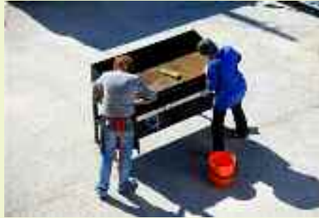
È anche l'occasione per pulire a fondo la piastra che durante l'anno verrà usata numerose volte nelle feste di paese