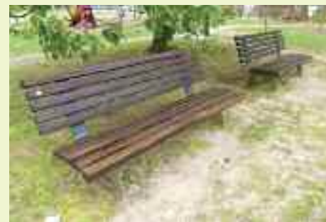
Le panchine del parco assumono un altro aspetto dopo essere state carteggiate e tinteggiate