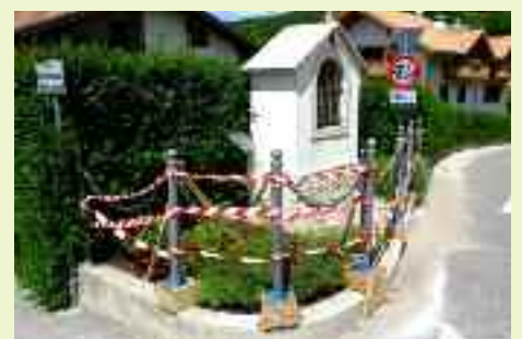
Uno dei tanti lavori di primavera realizzati a Montevaccino in occasione di Argentario Day