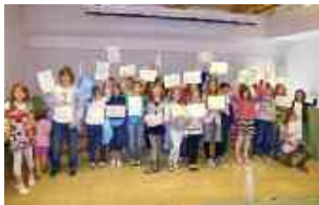
16.5.2014 > Premiazione dei bambini che hanno partecipato (più di trecentocinquanta) al concorso di disegno in occasione di Argentario Day