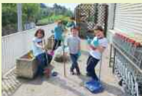
Piccoli cittadini attivi sistemano le aiuole davanti alla Cooperativa di San Donà