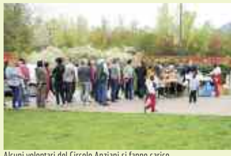
Alcuni volontari del Circolo Anziani si fanno carico di preparare il pranzo per i circa 140 volontari che all'ora di pranzo si presentano puntuali