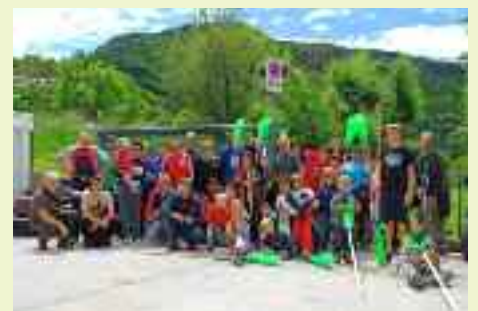
Una foto di gruppo prima di andare a pranzo