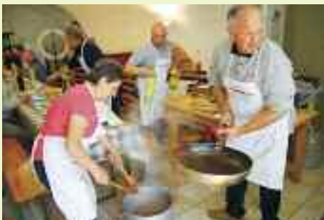
I cuochi sono collaudati e sanno offrire un pranzo di qualità, all'altezza della festa