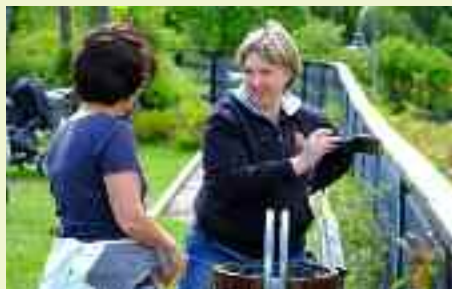
La giornata del volontariato è anche una bella occasione d'incontro