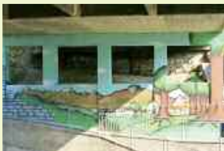
Due giovani danno prova delle loro competenze artistiche dando finalmente un po' di vita al triste sottopasso di San Donà