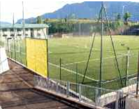
Ultimato il campo da calcio a Martignano

A breve saranno assegnate le sale della palazzina alle varie associazioni, su indicazione della Circoscrizione.