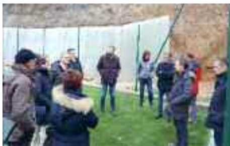
20.1.2014 > Viene organizzato un sopralluogo presso la nuovissima palazzina dello sport a Martignano. Sono presenti tecnici e rappresentanti del Comune e della Circoscrizione