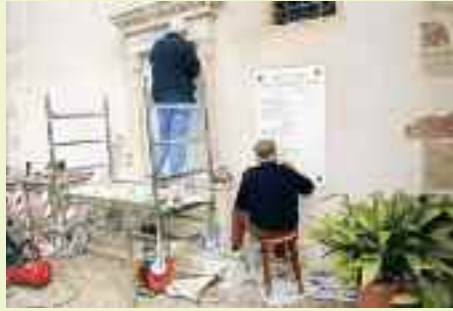
Alpini e Circolo Cognola ridanno vita alle lapidi che ricordano i caduti delle varie guerre