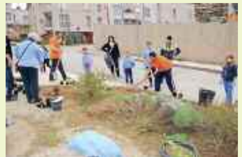
I ragazzi di Via Julg si fanno notare per le azioni di pulizia, giardinaggio e tinteggiatura attorno al Centro Civico