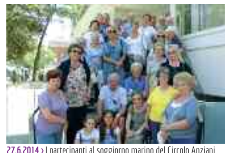
27.6.2014 > I partecipanti al soggiorno marino del Circolo Anziani di Martignano "El Capitel" posano per una foto ricordo l'ultimo giorno di vacanza