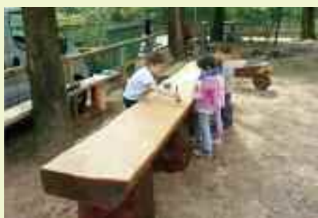
Questi bambini avranno un altro atteggiamento quando utilizzeranno questo tavolo per organizzare le loro feste