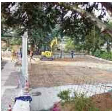
Rifacimento del sagrato di Cognola

Sono completati anche i lavori di sistemazione della pavimentazione antistante la chiesa e il cimitero di Cognola . La messa in opera di una siepe di mascheramento sarà il tocco finale.