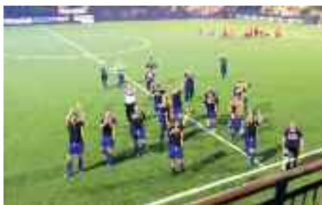
11.6.2014 > L'Unione sportiva Montevaccino vince la finale 3°-4° posto dei play-off di Seconda Categoria e si gioca un'eventuale promozione nel campionato di Prima Categoria