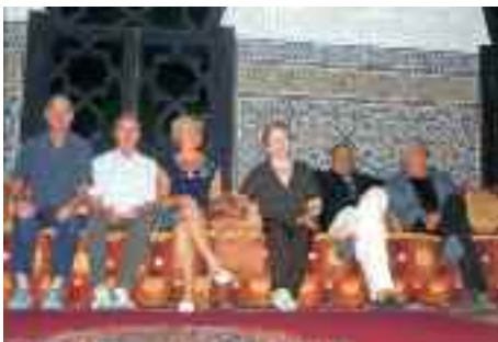
12.5.2014 > Tra il 6 e il 13 maggio centoquindici soci del Circolo Culturale di Cognola hanno partecipato al Tour del Marocco