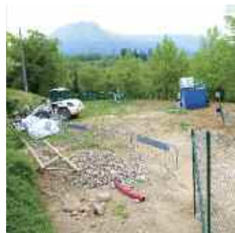
Ristrutturata l'area cani di San Donà