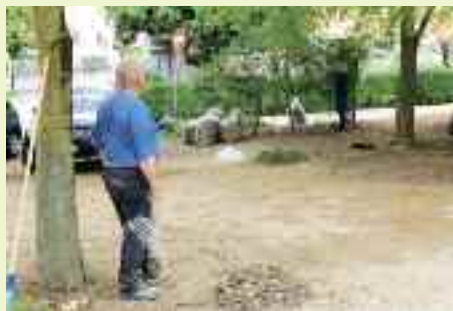
Alcuni volontari "diversamente giovani" hanno anche in questo caso pulito a dovere Via 26 Settembre