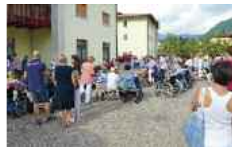
14.6.2014 > Porte aperte a Casa Serena. Genitori, volontari e operatori organizzano una festa aperta alla cittadinanza con l'intento di "abbassare i muri" tra il dentro e fuori