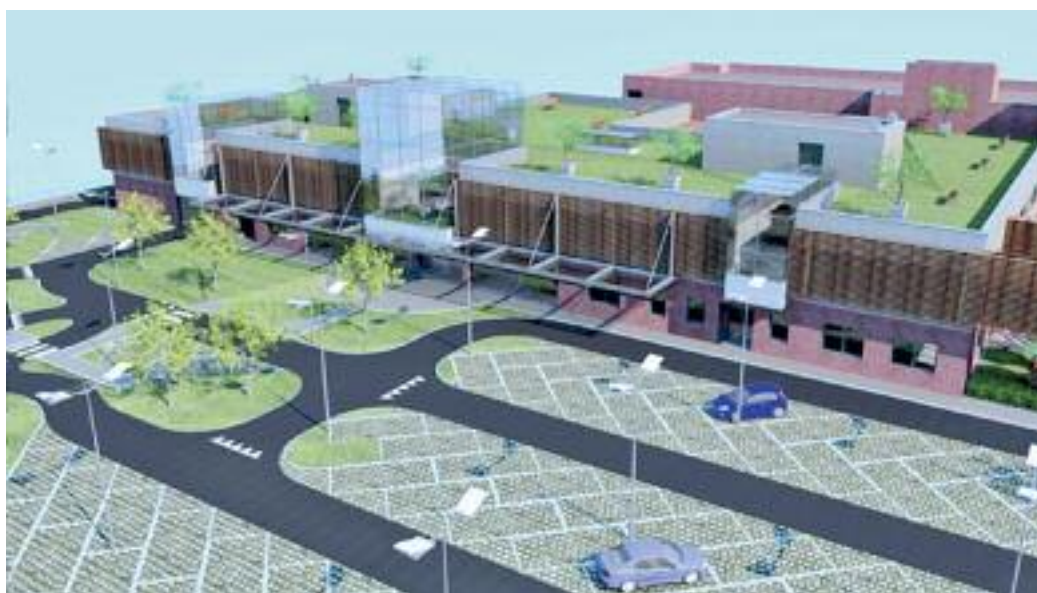
Il progetto del Centro tratto dal sito di Trentino Progetti