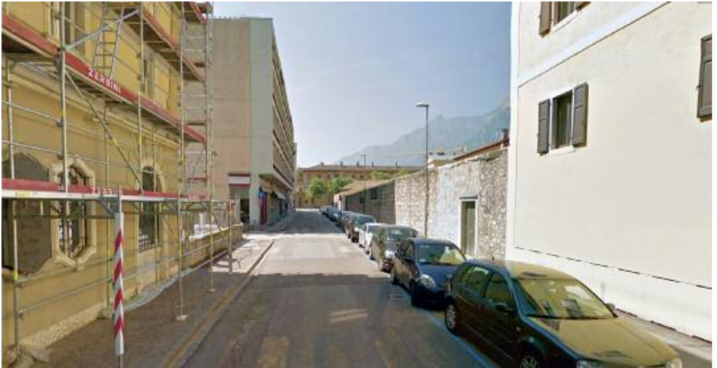
Visuale di Via Paradisi

te alle risorse umane disponibili e che vengono effettuati saltuari controlli anche con l'impiego di personale "in borghese".