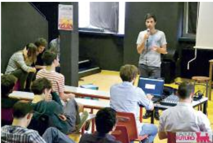
LE RAGAZZE E I RAGAZZI DI STAZIONE FUTURO

Detto questo, è da un anno che ci chiediamo quale sia la tanto discussa e tormentata vita notturna di Trento, visto che la città ha nel tempo acquisito la fama di essere quasi priva. ■