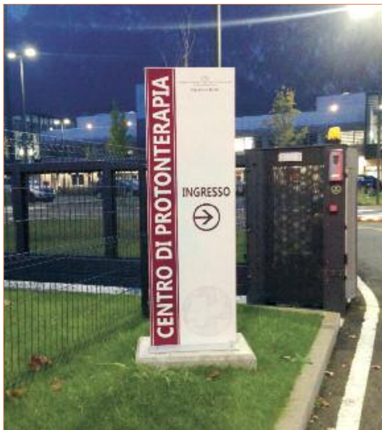
L'ingresso del centro di Protonterapia a Trento

Quando i protoni colpiscono la cellula tumorale ne danneggiano il DNA portandola alla distruzione