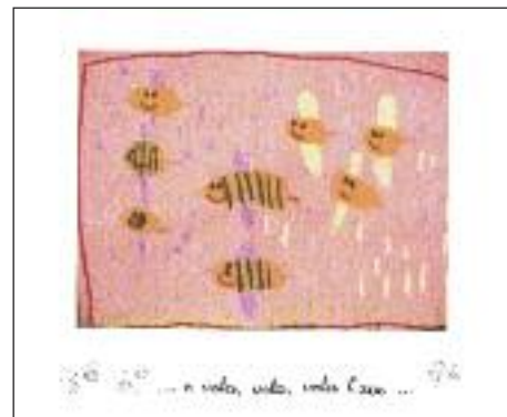
I disegni dei bambini

Prima di ripartire abbiamo assaggiato il miele direttamente dai favi e Stefano ci ha fatto vedere anche i prodotti che si possono ricavare dall'allevamento delle api: la pappa reale, il miele, il polline, le candele fatte con la cera e tante altre cose. I bambini sono stati felici di esprimere