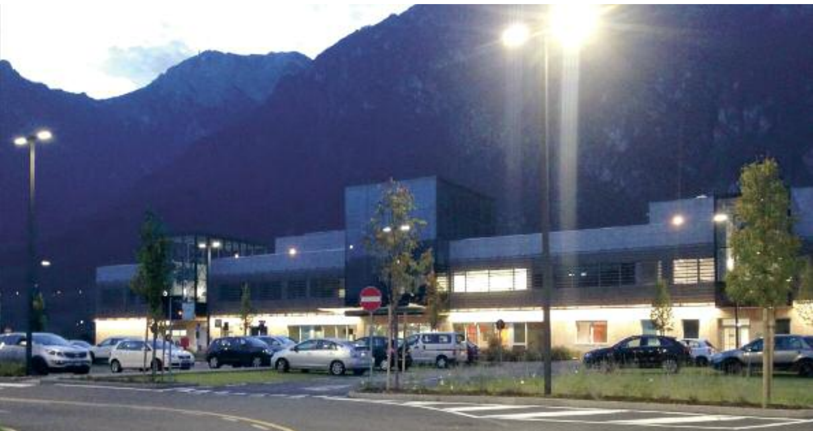
Il Centro di Protonterapia di Via al Desert

o interferendo sulla sua possibilità di proliferare. Questa cura arreca inoltre un vantaggio fisico al paziente perché limita le radiazioni emanate.