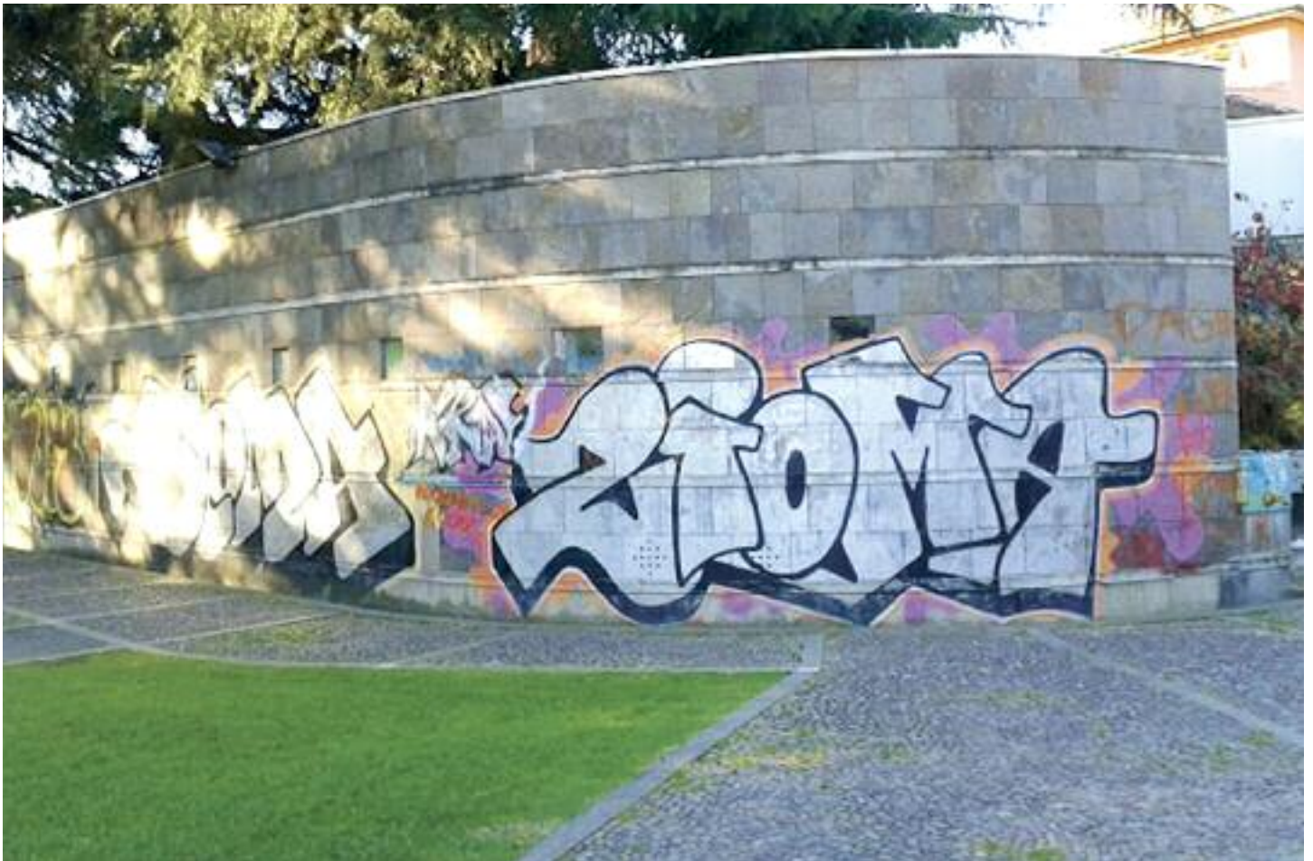
Parco Santa Chiara - Ex mensa

Importante è la corretta gestione dei luoghi della città: le aree e gli