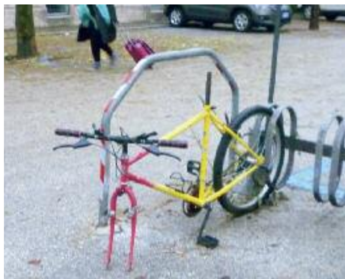
Esempi di degrado urbano