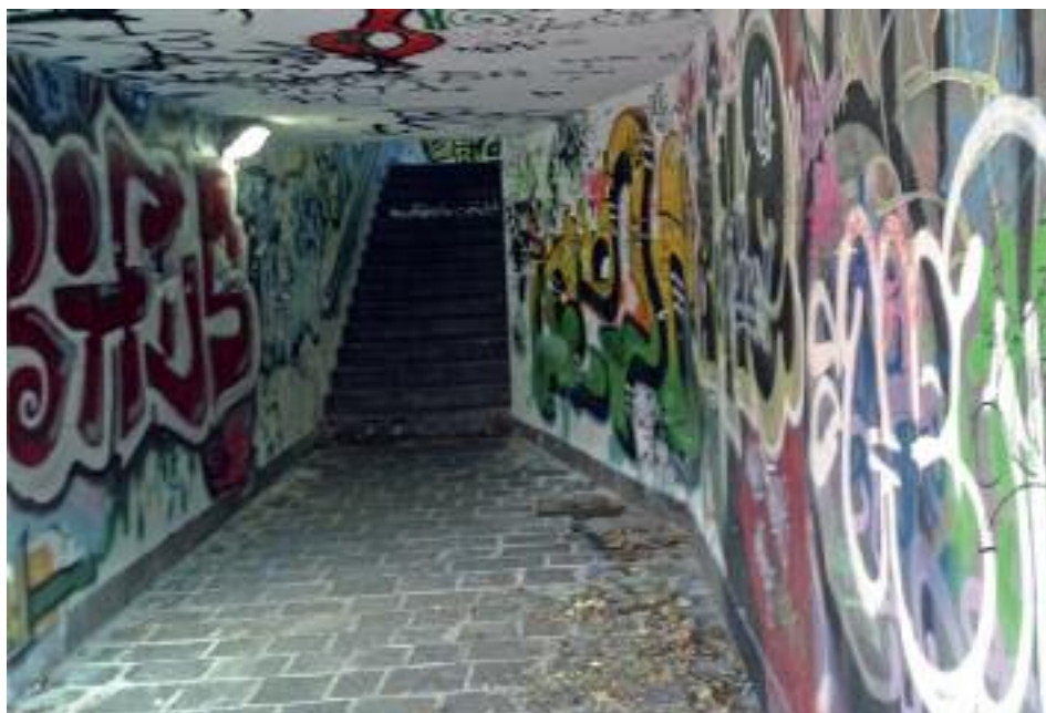
Sottopasso di Piazza Venezia

edifici degradati e abbandonati, così come i luoghi spogli, sporchi e imbrattati comunicano paura e attirano comportamenti antisociali e criminalità. La vitalità delle strade e degli spazi pubblici è un importante fattore di prevenzione del crimine perché l'uso degli spazi pubblici produce sorveglianza spontanea.