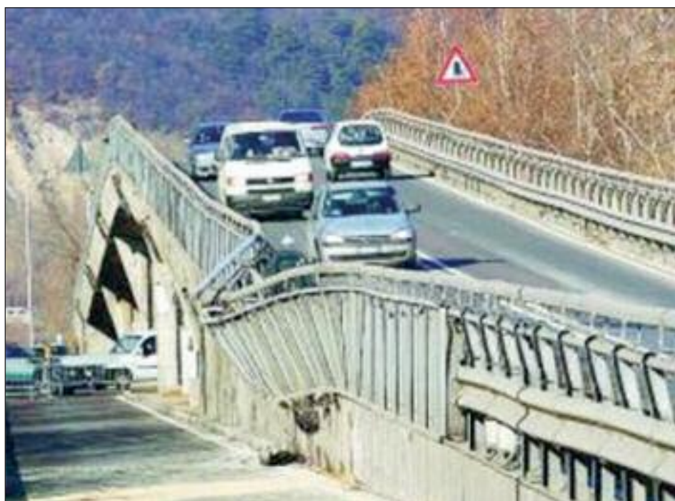
Il cavalcavia di Ravina

In merito al documento presentato l'amministrazione comunica che: 1) è presente un percorso agevole da Via Giardini per i mezzi indicati e quindi non ritiene di aderire alla richiesta avanzata; 2) per una maggiore pulizia del sottopasso si solleciterà Dolomiti Energia chiedendo ad essa una intensificazione dei passaggi almeno settimanale; 3) la realizzazione di un impianto di videosorveglianza è tecnicamente possibile perché sotto la carreggiata stradale di piazza Venezia è posizionata la fibra ottica. Si terrà conto della richiesta nella programmazione di futuri interventi di videosorveglianza; 4) per i servizi igienici autopulenti si segnala che è in corso una sperimentazione in Piazza Dante. A seguito della sperimentazione si potrà valutare se incrementare la presenza sul territorio comunale di questi servizi; 5) in merito all'intensificazione dei controlli si comunica che in primavera-estate vengono intensificati i controlli compatibilmente