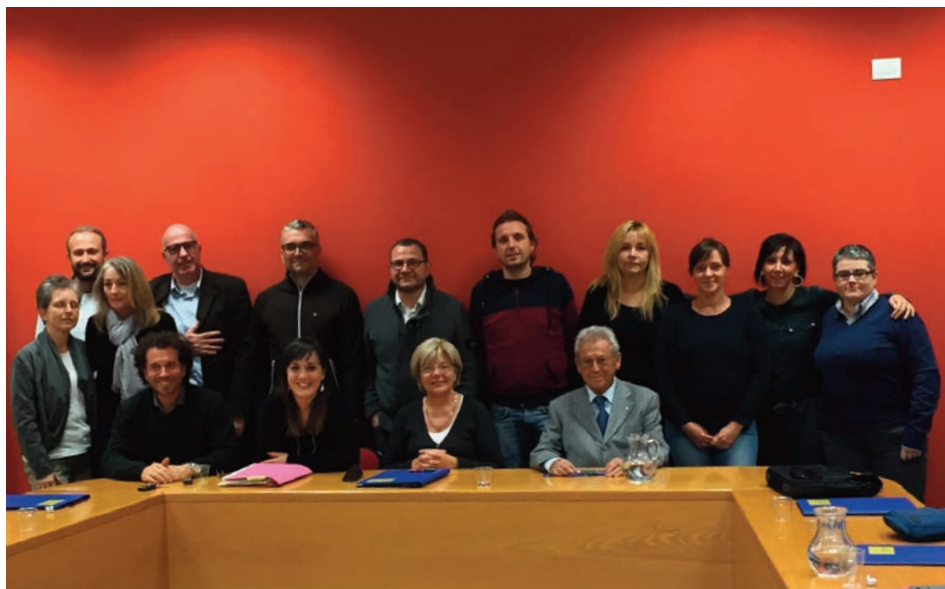
Componenti Consiglio Circoscrizionale