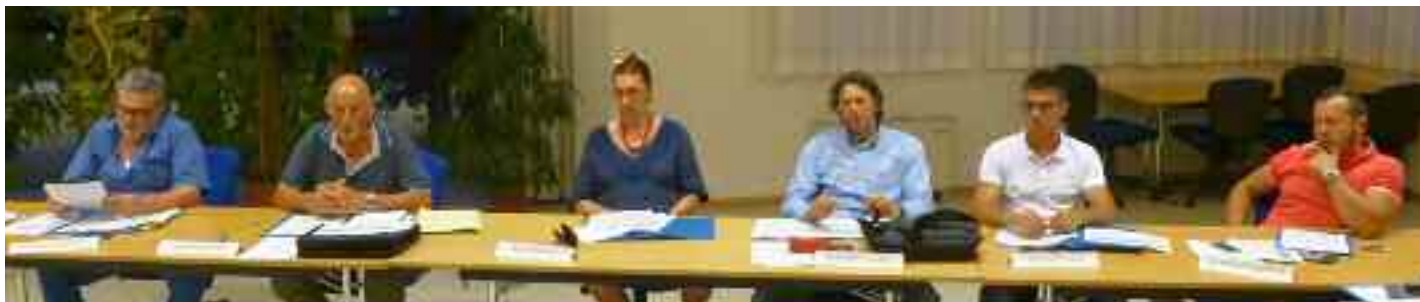
Consiglio 7 luglio 2015

una previsione di spesa di € 450.000,00 per la realizzazione di un garage interrato in località Tavernaro, sotto il parco di Piazza Natale Tommasi, considerate le precedenti richieste di priorità per la Circoscrizione Argentario, come ad esempio la Caserma dei VVF volontari, la realizzazione del marciapiede a Zèll di Cognola o la realizzazione del Centro civico di San Donà.