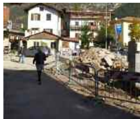
Il comune di Trento si riappropria dello slargo di via Don Serafini