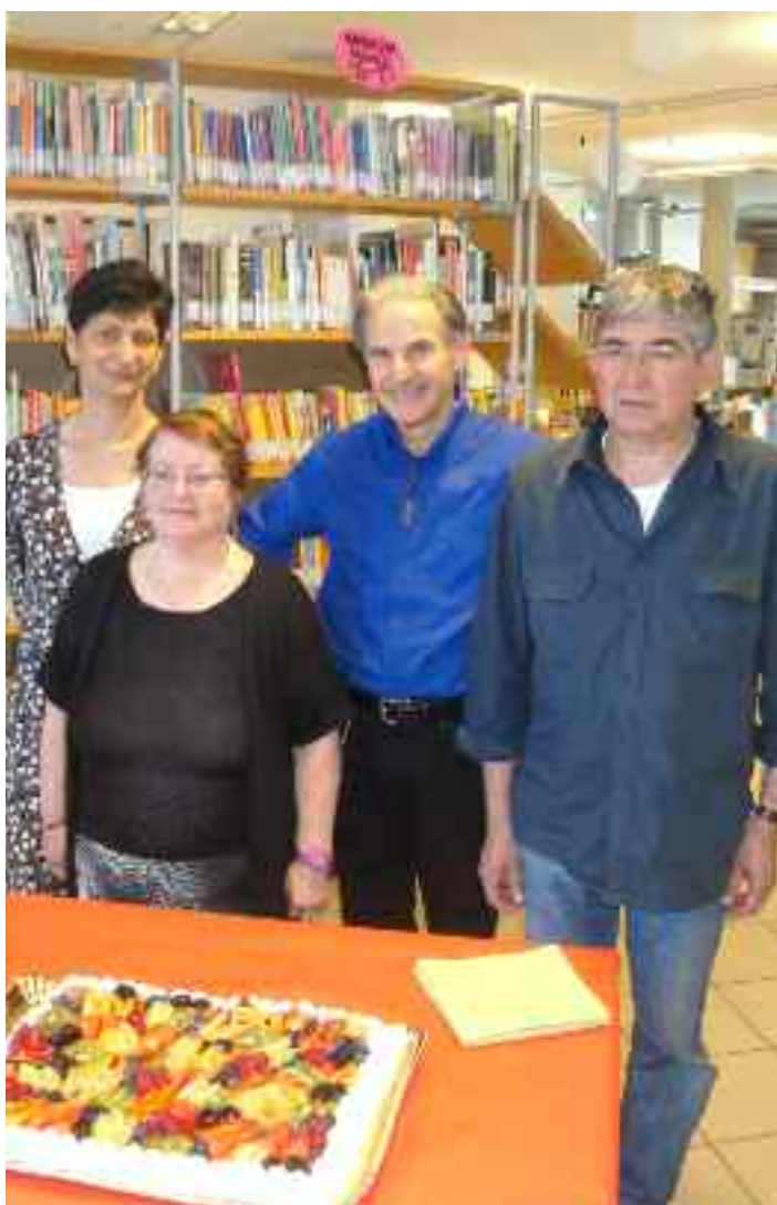
Gianko saluta i suoi collaboratori

Dalla Circoscrizione e dalla popolazione di tutte le età un grazie sincero!