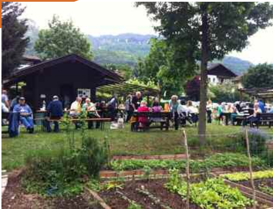
Gli orti in zona Mesiano di Povo