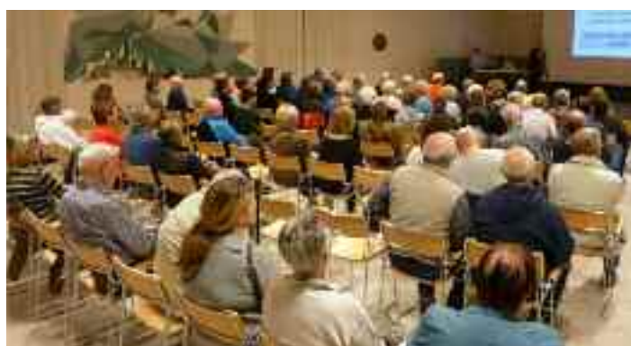
29.09.2015 > Il Circolo Culturale di Cognola presenta una serata a favore del Nepal