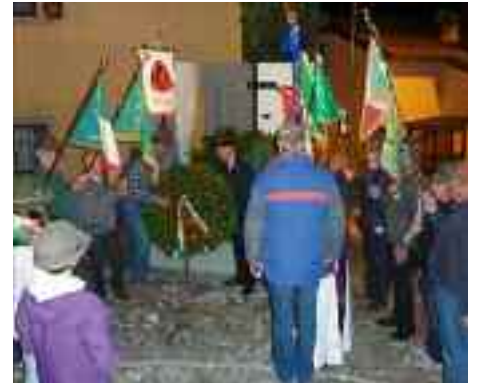
07.11.2015 > Gli Alpini di Martignano commemorano i caduti di tutte le guerre