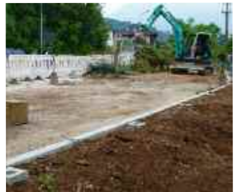
30.05.2015 > Per Argentario Day l'impresa MAK sistema a sue spese il piazzale ai Bolleri di Martignano