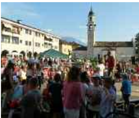
04.06.2015 > La scuola Comenius festeggia con alunni e famiglie la fine dell'anno scolastico delle medie