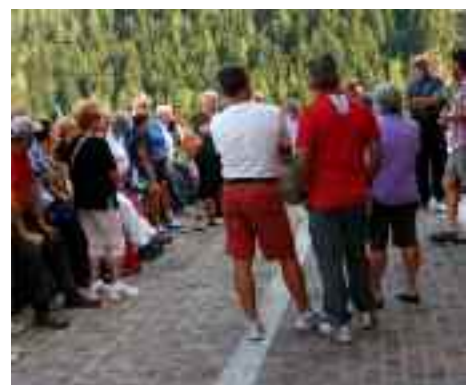
06.08.2015 > Il Circolo Anziani di Martignano visita il museo della guerra di Vermiglio - TN