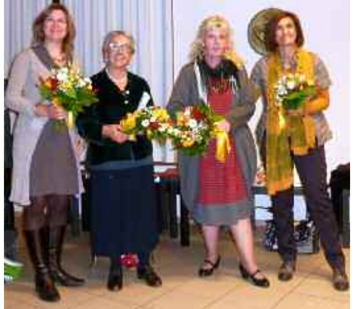
Le 4 relatrici

In sintesi è emersa la trasversalità sociale del fenomeno che riguarda indistintamente tutte le fasce sociali e culturali, la mancanza di relazione con dipendenze da alcool e droga o con disturbi psichiatrici o psicologici, la difficoltà e le reticenze che le donne hanno ancora nel denunciare i loro partner, il fatto che chi è maltrattante , nonostante le promesse e i buoni propositi, ha la tendenza a reiterare le violenze. Ora in Trentino agli uomini maltrattanti è offerta la possibilità di frequentare un corso di mutuo aiuto deno-