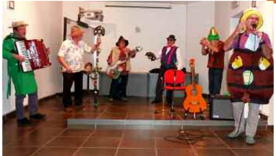
The goulash people