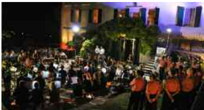
07.08.2015 > Spettacolare serata a Villa Taxis a cura del Coro Montecalasio & Orchestra Fuori Tempo