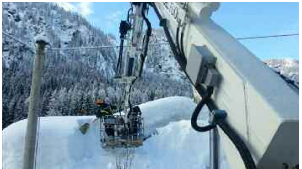
Intervento invernale dei Vigili del Fuoco Volontari di Cognola

I Vigili del Fuoco Volontari ringraziano tutti coloro che li sostengono. L'anno scorso grazie all'offerta raccolta con il calendario sono riusciti ad effettuare degli acquisti importanti sia per la salvaguardia dei vigili sia per effettuare interventi specialistici urgenti. Ad esempio sono stati acquistati un kit completo di pinze idrauliche per l'estrazione di passeggeri bloccati all'interno di autoveicoli; 4 imbraghi per operatori di soccorso specifici; un kit luci led ad alta visibilità per rendere visibile agli automobilisti in avvicinamento il percorso da utilizzare durante