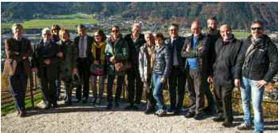
Alcuni consiglieri circoscrizionali e "amici di Schwaz" in visita di programmazione

Altre tematiche ed altre proposte potranno essere individuate negli incontri della Commissione cultura o provenire da Schwaz e saranno oggetto di approfondimento e valutazione.