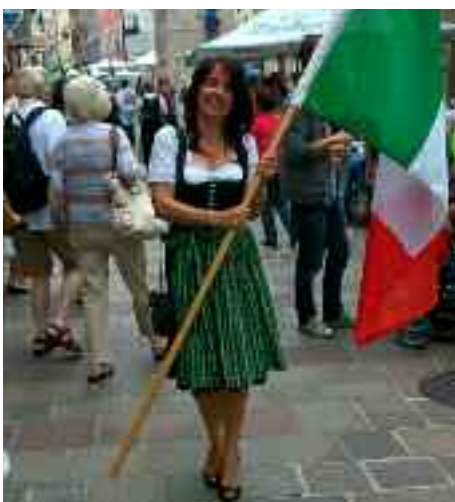
14.06.2015 > Una cittadina di Schwaz testimonia l'amore verso il nostro paese