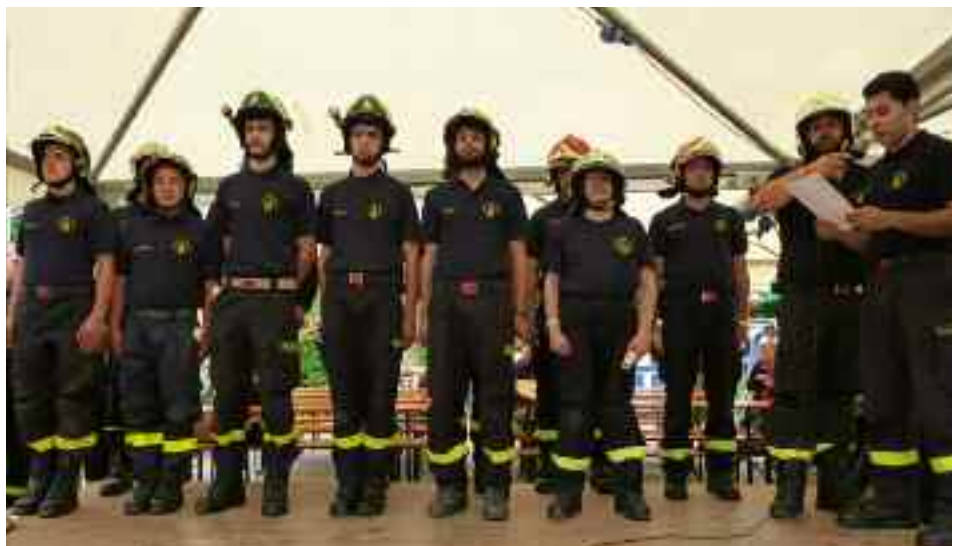
Il giuramento dei nuovi Vigili del Fuoco in occasione della Sagra di Martignano