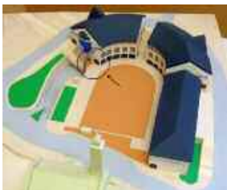
03.10.2015 > Viene presentato il modello del Monumento alla Pace commissionato dagli Alpini di Cognola