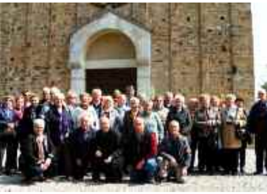
12.04.2015 > Il Circolo Anziani di Martignano va in pellegrinaggio a Cavriana (Mantova)