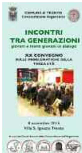
Locandina del XX convegno

Al termine delle relazioni, un momento conviviale con un appetitoso menu "d'argento" e nel pomeriggio intrattenimento musicale con i sei componenti del complesso "The goulash people", che con la loro travolgente simpatia hanno regalato tanta allegria facendo cantare e ballare i presenti. ■