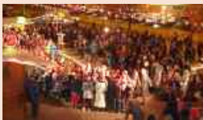
I bambini festeggiano il Natale nella piazza di Martignano

Inoltre, si svolge la Rassegna di Canti Natalizi Popolari, manifestazione organizzata dal Coro Monte Calisio nella Chiesa Parrocchiale di Martignano.