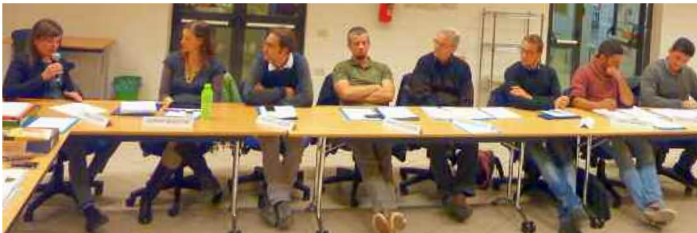
Consiglio 7 luglio 2015