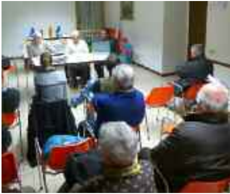
12.03.2015 > Le ACLI si incontrano nella saletta parrocchiale di Martignano