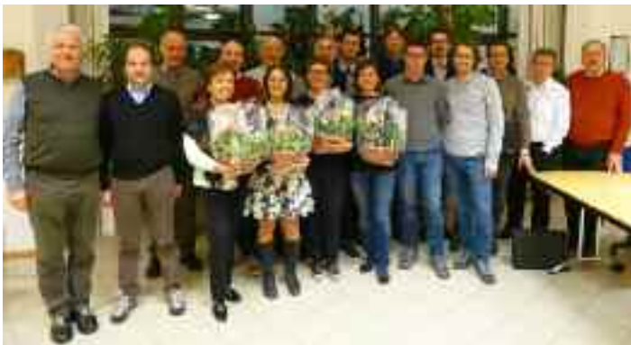
24.03.2015 > Ultima foto ricordo del Consiglio circoscrizionale dell'Argentario maggio 2009 - aprile 2015