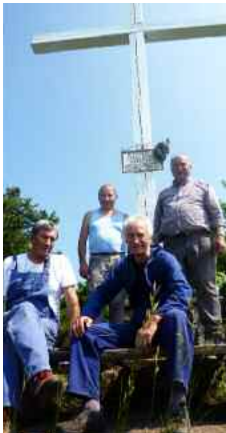
06.06.2015 > Gli Alpini di Tavernaro tinteleggiano la croce di Cima Calisio, luogo adottato dal gruppo