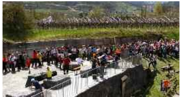
12.04.2015 > Grande partecipazione alla manifestazione "Primavera Vilerà" successo