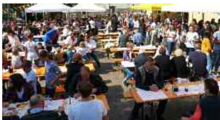
27.09.2015 > A Martignano la Festa della Comunità