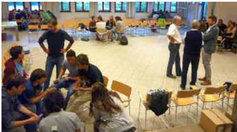
I diciottenni hanno raggiunto poi i loro amici sotto il tendone della sagra

Per la seconda parte della festa, che aveva come momento centrale un concerto, si è deciso di spostarsi al Parco