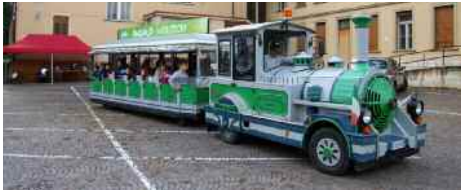
Il trenino attivato durante la Sagra del Rosario

La mostra ha poi rappresentato con immagini e contenuti l'attuale attività condotta dall'ANFFAS a Casa Serena, mantenendo un unico filo