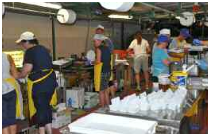
Sagra San Donà

I volontari si sentono ostacolati nella loro "buona volontà"! La pubblica amministrazione deve dare delle risposte, deve trovare delle soluzioni se ancora crede che i sani momenti aggregativi aiutano la cittadinanza a creare relazioni e conoscenza reciproca. Serve un coordinamento tra