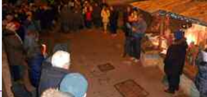
È tradizione, a Cognola de soto, festeggiare il Natale con canti e poesie