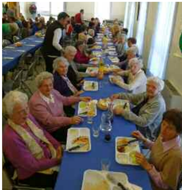
I soci di Telefono Argento si riuniscono a Montevaccino per un momento conviviale