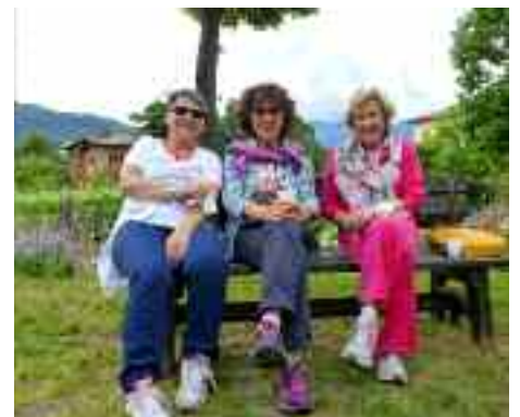
09.05.2015 > I circoli anziani concludono la loro passeggiata agli orti sociali sopra Mesiano