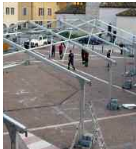
Preparazione sagra di Cognola