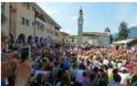
09.06.2015 > Piazza stracolma di studenti e famiglie in occasione della fine dell'anno scolastico della primaria