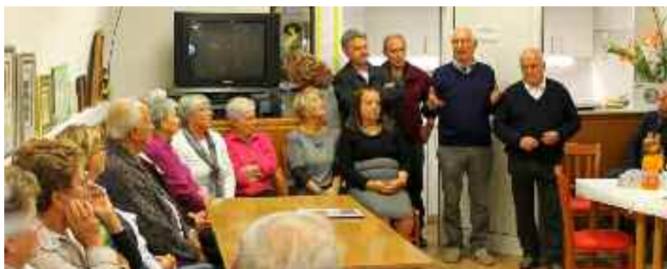
06.10.2015 > Il Circolo Anziani di Martignano inaugura la sede rinnovata