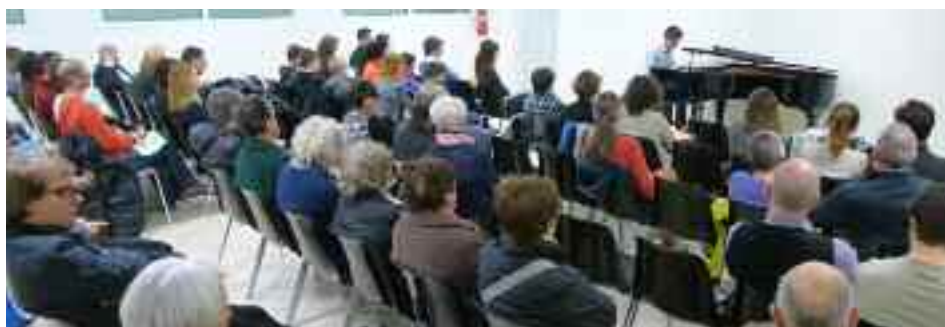
12 giovani neodiplomati suonano nella nuova palazzina servizi di Martignano

concertistiche e cerca di valorizzare il nuovo organo a canne della chiesa di Martignano, unico nella Circoscrizione Argentario.