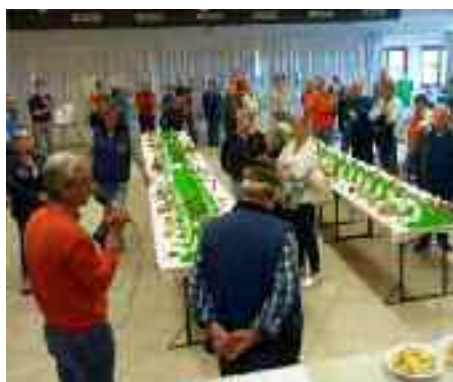
03.10.2015 > Mostra dei funghi a cura della SAT di Cognola durante la sagra del Rosario