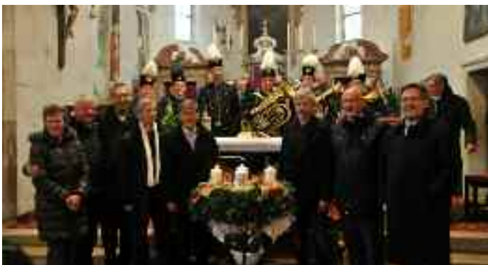
29.11.2015 > Consegna della corona d'Avvento presso la chiesa di Cognola da parte della delegazione di Schwaz