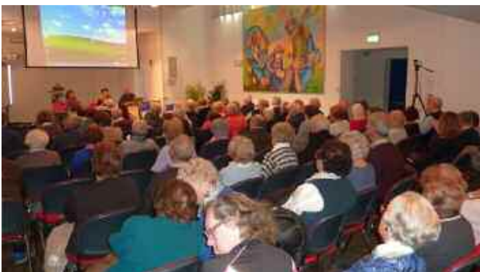
Convegno Anziani presso Villa Sant'Ignazio