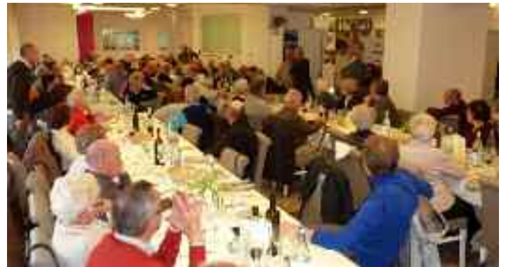
28.11.2015 > Gli Anziani di San Donà si ritrovano a Levico per il tradizionale pranzo sociale