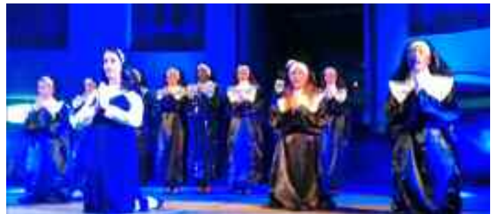
Spettacolo in Piazza Argentario