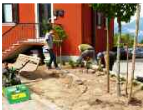
Il Servizio Verde termina l'aiuola

Peccato che abbiano lasciato quella bruttissima scatola per le derivazioni elettriche