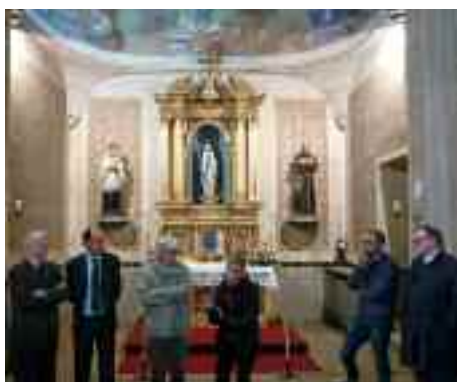
03.10.2015 > La chiesa di Casa Serena viene aperta al pubblico in occasione della sagra di Cognola