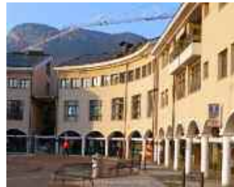
19.04.2015 > 400 disegni di bambini vengono appesi in piazza per richiamarci ad un comportamento civile