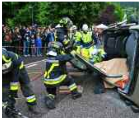
24.05.2015 > Sagra Martignano...dimostrazione dei Vigili del Fuoco Volontari