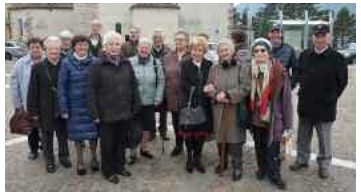
15.11.2015 > Gli Ottantenni si ritrovano a festeggiare la "fiorente" età