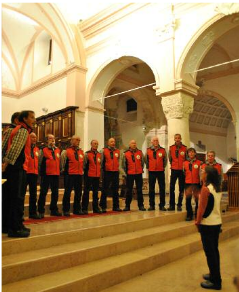
Concerto Festival Cori e bande- Basilica di S. Maria Assunta in Vieste

A tutti porgiamo gli auguri per le prossime festività e vi aspettiamo numerosi ad ascoltarci, a conoscerci e magari per entrare a far parte del nostro gruppo. ■