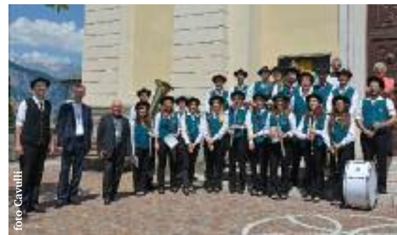
con il Vescovo ed il Parroco

risorse finanziarie adeguate ed inoltre forti motivazioni a livello individuale e di gruppo che vanno oltre l'impegno musicale che ognuno presta durante le prove e nei concerti. Si spera che anche la popolazione capisca l'impegno della nostra centenaria Associazione e possa collaborare in modo da poter garantire il proseguimento dell'attività musicale ancora a lungo.