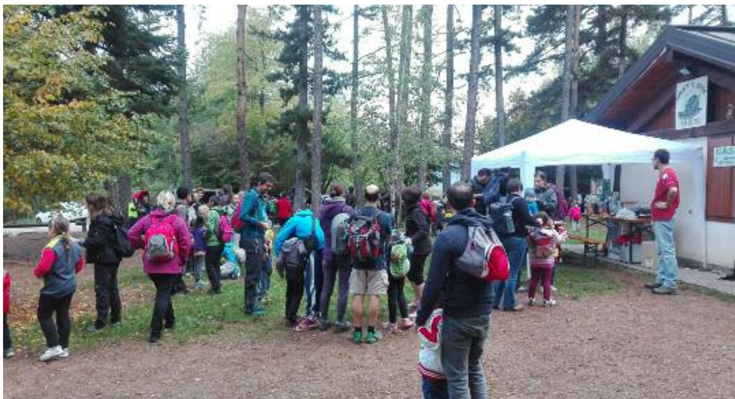
Un momento dell'iscrizione al "Ce la fai a farcela" l' 11 ottobre prima della partenza

Infine è di queste settimane l'ultima iniziativa organizzata per il 2015 con la quinta edizione del "Ce la fai a farcela", quest'anno nella versione autunnale di domenica 11 ottobre. E' divenuta ormai un classico per la nostra circoscrizione, la passeggiata enogastronomica con un percorso diversificato di 8 km o 4 km per i più piccoli, lungo le strade forestali che percorrono la zona silvo pastorale nella parte a nord est di Vigo Meano.