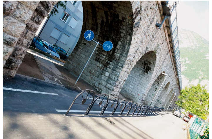
La nuova pista ciclabile e pedonale lungo le arcate nel quartiere di San Pio X