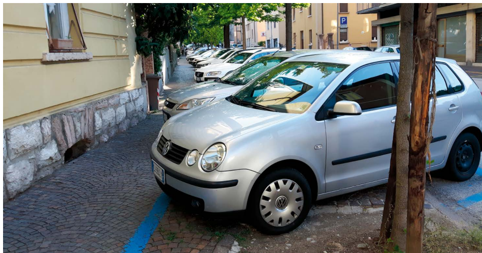
La situazione attuale in Via Milano: lo spazio per il marciapiede ridotto dalla presenza delle auto

Il Consiglio Circostrizionale ha espresso a maggioranza parere favorevole al progetto per via della riqualificazione in termini di maggiore attenzione ai pedoni e miglioramento delle condizioni di parcheggio. È stata evidenziata all'amministrazione una certa preoccupazione per la riduzione degli spazi di parcheggio, anche se molti dei quali attualmente non hanno delle dimensioni tali da rendere agevole e sicuro il parcheggio delle automobili nonché il rispetto del transito dei pedoni sui marciapiedi. ■