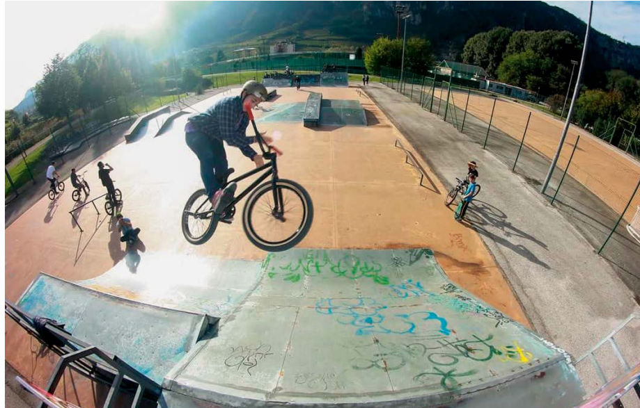
Evoluzioni della FAT.ONE crew allo skatepark di Maso Smalz

In prima persona quindi la FAT.ONE crew si è attivata per trovare la maniera di proporre all'amministrazione comunale un'idea-progetto per un nuovo skatepark. L'opportunità gli è stata offerta da FuturaTrento, la piattaforma del Comune di Trento che consente di coinvolgere i giovani per la progettazione e la rigenerazione degli spazi urbani della città. L'idea pubblicata sul sito ha subito avuto un largo appoggio e il successo di questa proposta è arrivata fino al Servizio Parchi e Giardini del Comune di Trento. A questo punto è iniziato un vero e proprio percor-