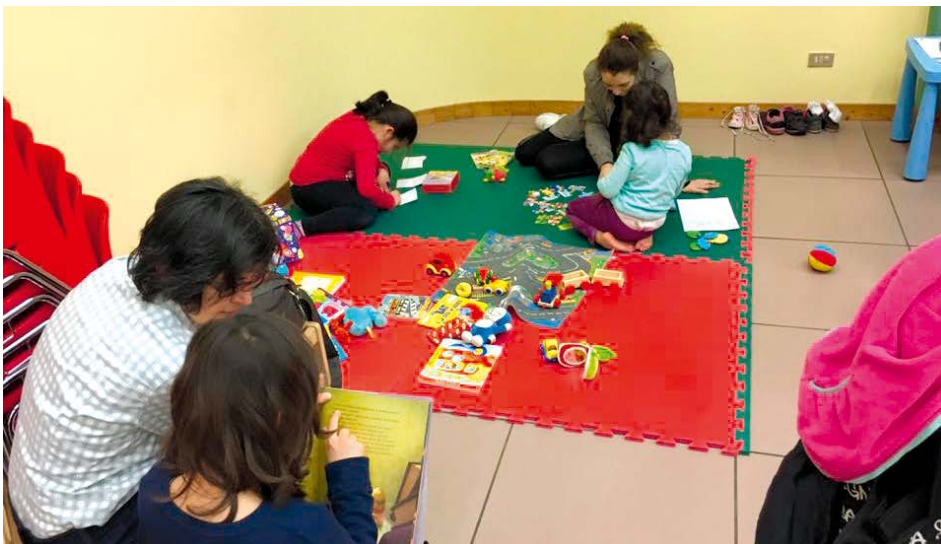
I bambini e genitori insieme alla giornata dello scambio di vestiti

L'apprezzamento che affiorava tra i presenti ci ha convinti a stimare la bontà del percorso intrapreso. Riteniamo, infatti, che queste proposte, sostenibili sia sotto il profilo ecologico che etico, possano portare frutti anche sul piano relazionale. Ringraziamo, quindi, di cuore tutti coloro che hanno concorso alla riuscita dell'iniziativa ed anche coloro che sono semplicemente venuti a trovarci, a curiosare... insomma tutti quelli che, con noi, hanno colto l'occasione per incontrarsi. ■