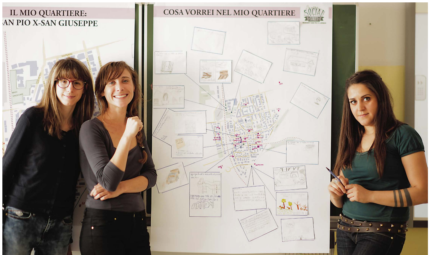
Social street San Pio X all’opera per inventare nuove forme di fare rete all’interno della comunità

Largo alla creatività e alla partecipazione