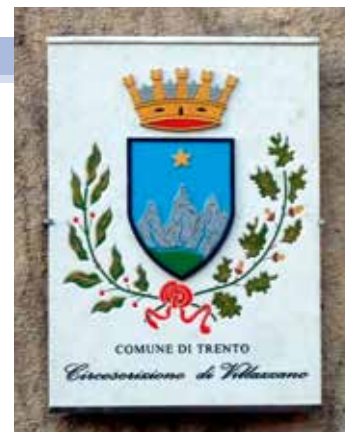
La targa con il simbolo di Villazzano

Vivere momenti come la Festa di Sant'Antonio con la gente del posto ha un sapore decisamente diverso dal farlo come semplici turisti e questo da solo giustifica l'esistenza del gemellaggio, il lungo viaggio da affrontare tra macchina e traghetto