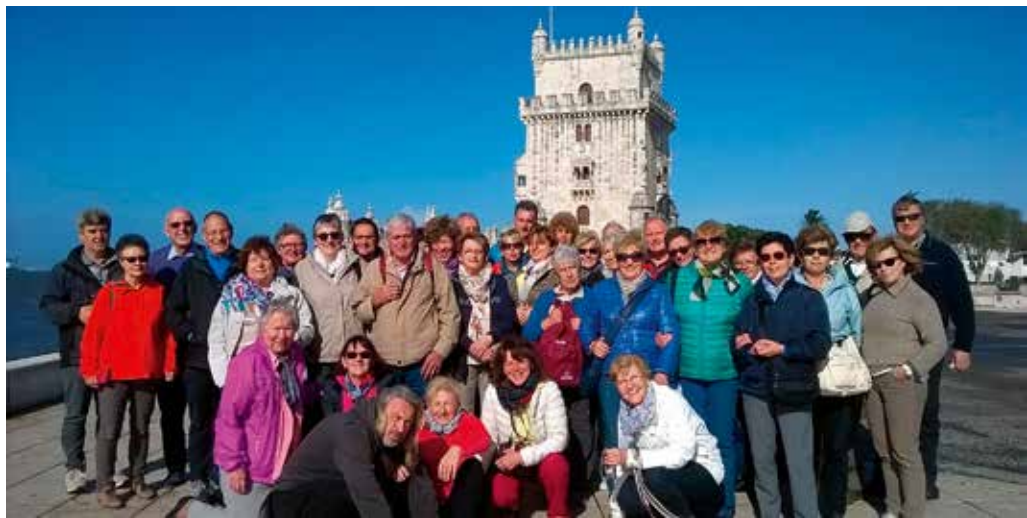
I soci del Circolo nel loro tour in Portogallo