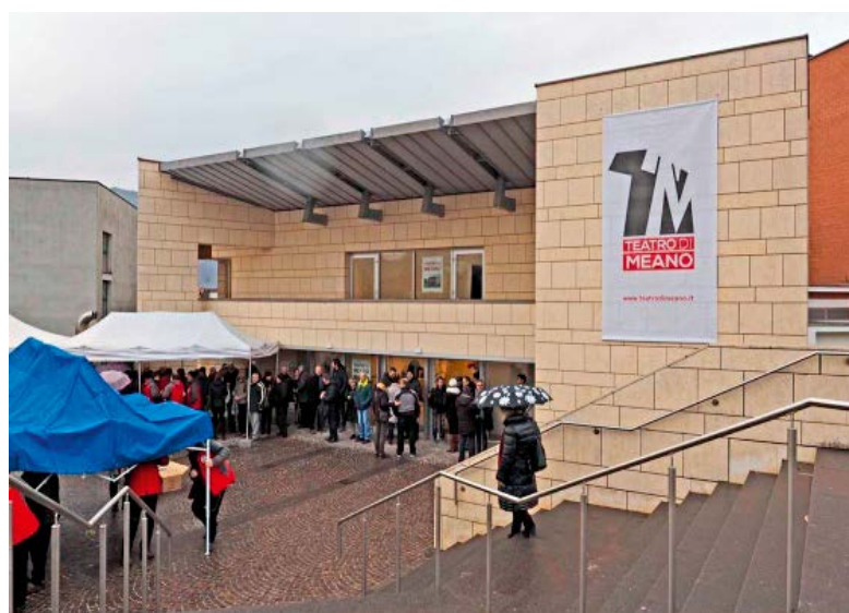
Un momento dell'inaugurazione del teatro