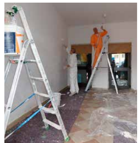
Tinteggiatura del "Giocastudiamo" Alpini di Cognola