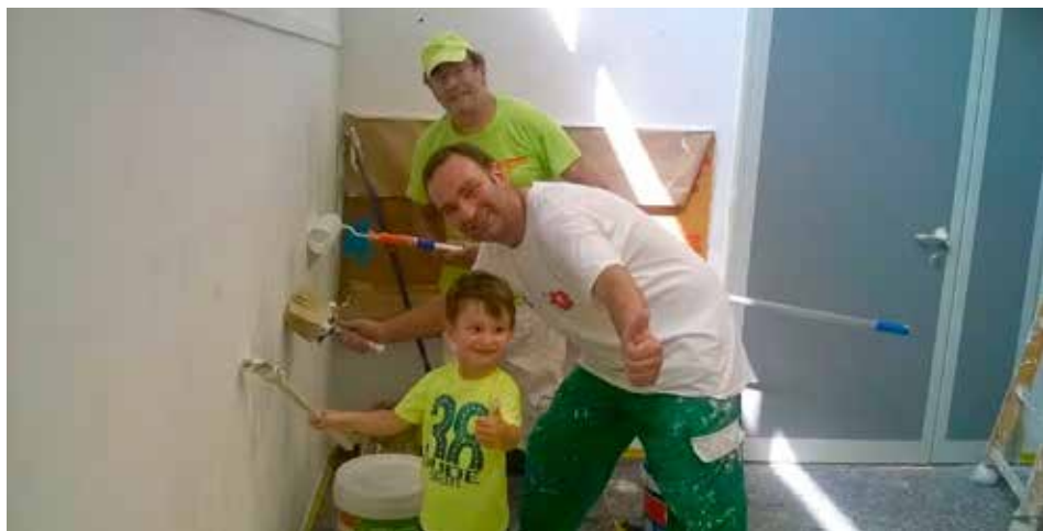
Tinteggiatura della scuola materna di San Donà

che nello stesso campetto sono ora disponibili 9 pannelli a disposizione di giovani artisti che volessero esprimersi.