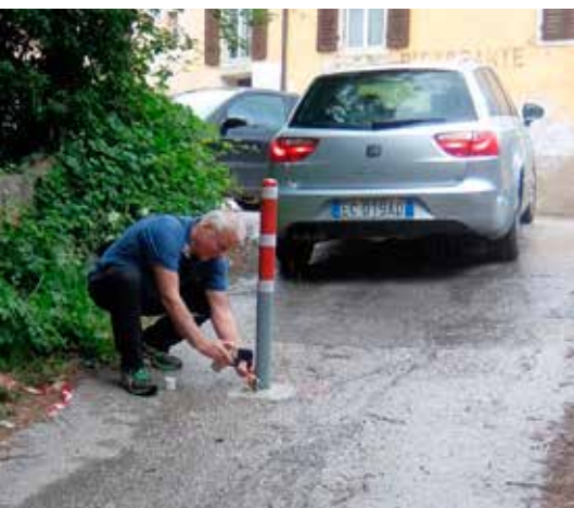
Installazione del palo che blocca l'accesso delle automobili al fiume Fersina