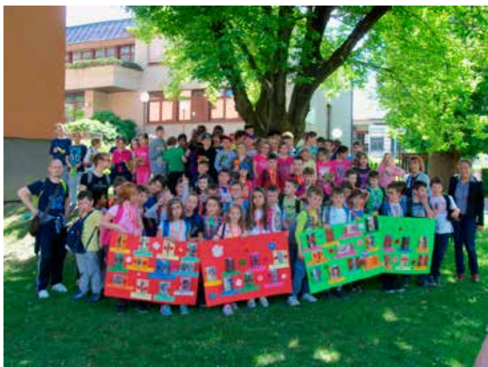
Gemellaggio a Schwaz