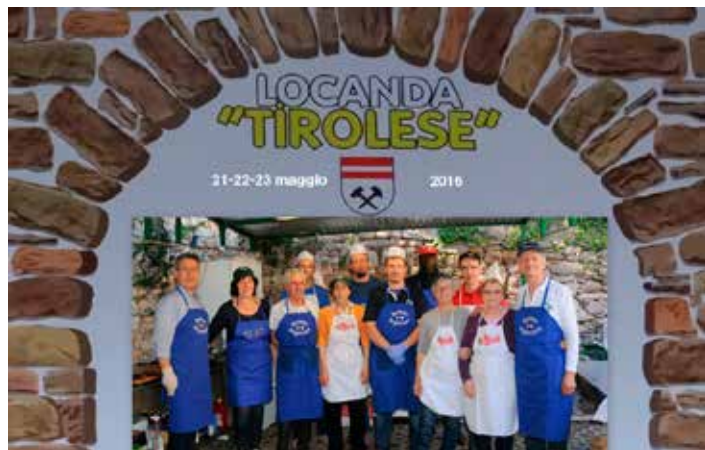
La Locanda Tirolese alla Sagra di Martignano