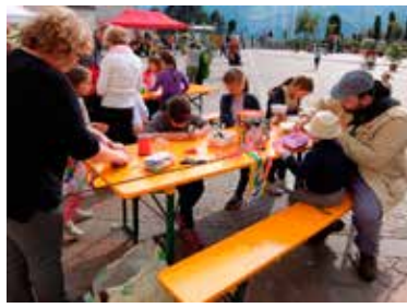
Laboratorio del Riuso