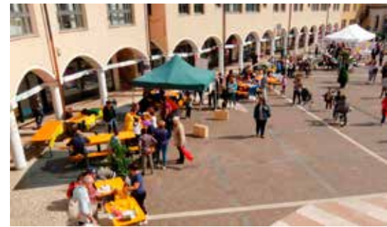
Sguardo sulla piazza

All'interno delle iniziative dedicate ai bambini si ricorda l'evento " Buttati che c'è la rete ", organizzato dalle cinque scuole dell'infanzia della Circoscrizione. Tra i risultati di questa importante manifestazione c'è la creazione di un " mandala " di forma circolare. Il mandala è un simbolo spirituale e rituale che rappresenta l'universo ed è stato realizzato dai bambini "medi" al parco di Martignano utilizzando materiali offerti dalla natura e prodotti aromatici dell'orto e del bosco. Il Mandala è stato diviso in 5 spicchi, uno per ogni scuola, dentro i quali i bambini hanno potuto esprimere la loro creatività. ■