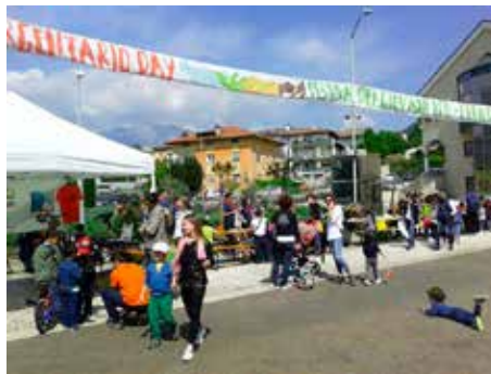
Sguardo sulla piazza