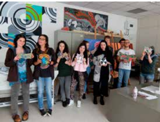
I giovani artisti mostrano le mattonelle che ricopriranno il muro a Martignano

teggiate ben 19 azioni strutturate di cui cinque hanno una forte connotazione artistica : 1) il "murales" delle scuole medie di Cognola che sarà realizzato a settembre coinvolgendo alcuni studenti; 2) il "murales" presso il Centro sociale di Martignano che sarà realizzato durante l'estate in collaborazione con i 18enni; 3) le diciannove mattonelle decorate che in queste settimane prenderanno il posto di altrettanti sassi caduti dal muro nei pressi del CRM di Martignano; 4) il "murales" programmato in autunno nella sala musica della scuola media di Cognola; 5) il grande pannello da 10 metri per 2,40 colorato da alcuni giovani writers e installato nel campetto da pallavolo di Cognola, con la scritta "sport è vita". Da segnalare