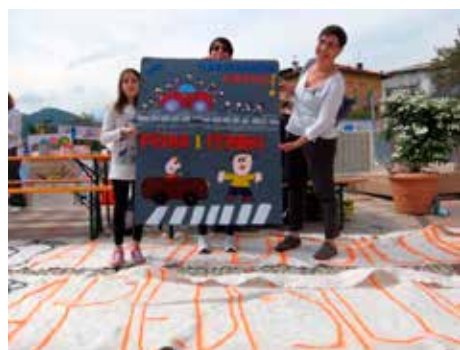
A Piedi sicuri

all'ambiente, alla manualità, alla creatività e non ultimo al riuso. L'entusiasmo con cui i giovani hanno partecipato e riempito