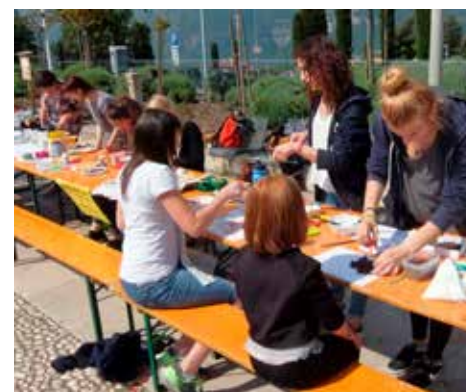
Il Mondo a colori