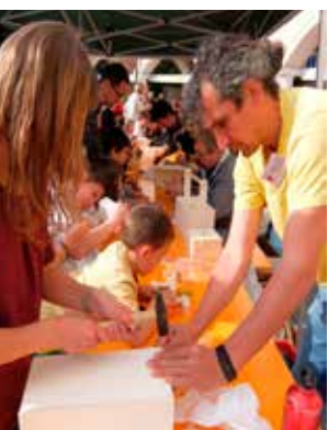
Che bello costruirsi i giocattoli e le girandole