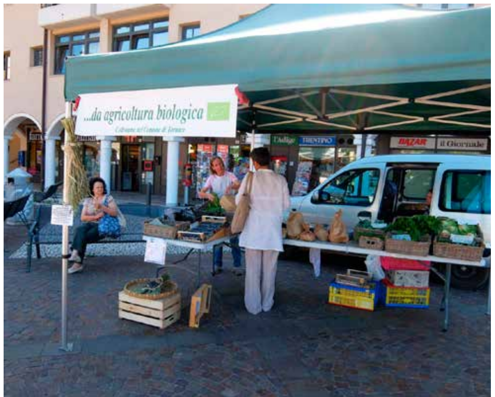
Il mercato contadino con prodotti biologici in piazza Argentario a Cognola

Un ritorno quello dei mercati contadini, da salutare con favore, non solo