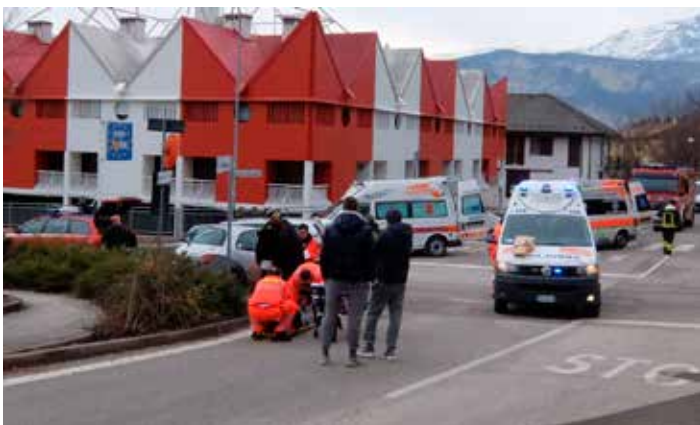
Incrocio su via dell'Albera