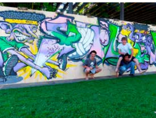
L'opera dei giovani writers andrà ad abbellire il campetto di pallavolo di Cognola