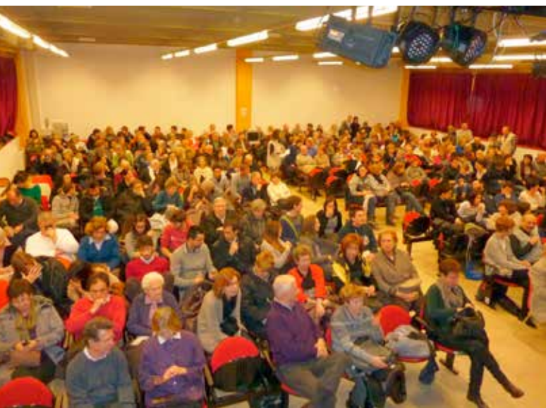
Spettatori a teatro

"Argento Vivo" rappresenterà nelle prossime stagioni autunno-inverno in più repliche le due commedie, " Le aleggri comari de.... " in dialetto trentino - rappresentata fino ad ora 18 volte - e " Sa gavè da rider " che debutterà per la prima volta in occasione della prossima rassegna.