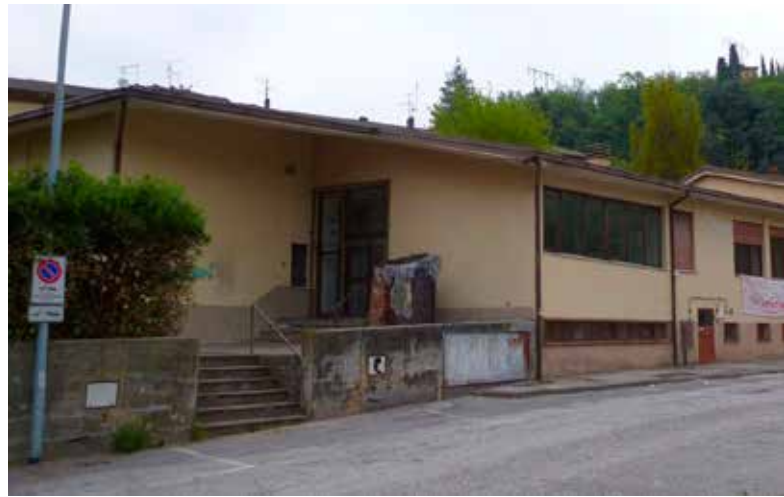
Il cadente Centro sociale di S. Donà