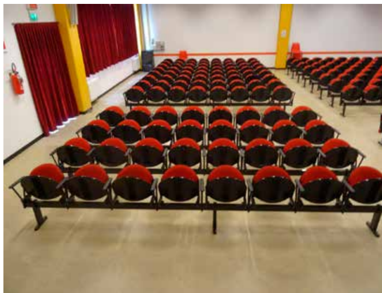
Il teatro è stato tirato a lucido dai volontari

Ciò che si realizza è frutto di tanta dedizione, impegno e ricerca, con lo scopo di offrire al pubblico spettacoli interessanti, divertenti e ben curati. Tutto questo richiede perciò un grande lavoro di squadra svolto da molte persone unite dalla grande passione per il teatro. In occasione dell'ultimo Argentario Day il teatro è stato tirato a lustro da molti volontari ma le operazioni di pulizia e assetto si susseguono durante tutto l'anno.