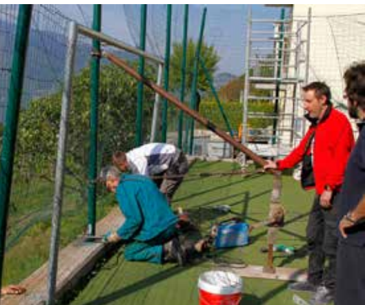
Si ricostruiscono i pali e le reti al campetto di Villamontagna