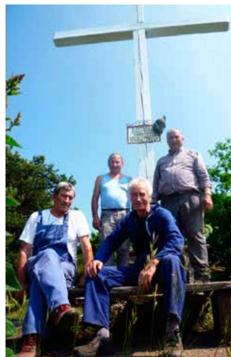
Gli Alpini di Tavernaro sostituiranno la croce sul Calisio il 6 agosto 2016

Molte altre azioni hanno avuto una connotazione più tradizionale quali: 6) la sistemazione della vecchia fontana a Montevaccino e 7) la ricostruzione, da parte degli Alpini, della nuova dimora alla Madonnina di Valcalda, un capitello al quale gli abitanti di Montevaccino erano molto affezionati; 8) la tinteggiatura delle sessanta colonne di piazza Argentario da parte degli scouts; 9) la tinteggiatura del "Giocastudiamo" da parte degli Alpini di Cognola; 10) la realizzazione del Giardino Mandala nel Parco di Martignano da parte delle scuole materne dell'Argentario; 11) il ripristino di alcune aree dei giardini della scuola Comenius; 12) la tinteggiatura di due depositi esterni a Casa Serena; 13) il rifacimento della rampa di scale davanti alla banca di Cognola, previsto per l'autunno; 14) il raddrizzamento dei pali di recinzione del campo da calcio a Villamontagna con relativo smontaggio reti e risaldatura dei pali; 15) la progettazione e realizzazione di uno steccato che difende il giardino di piazza Argentario, ancora da realizzare dagli Amici del legno); 16) l'installazione del palo che blocca l'accesso delle automobili al fiume Fersina; 17) la tinteggiatura della scuola materna di San Donà; 18) la ricostruzione della croce di legno sulla Cima Calisio da parte degli Alpini di Tavernaro programmata per il 6 agosto 2016 19) la piallatura (a cura di Rolando Dorigatti) e la tinteggiatura delle panchine della scuola elementare di Martignano. ■