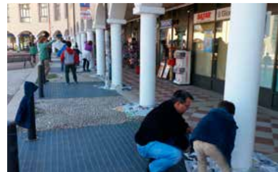
Tinteggiatura di sessanta colonne in piazza Argentario da parte degli Scouts