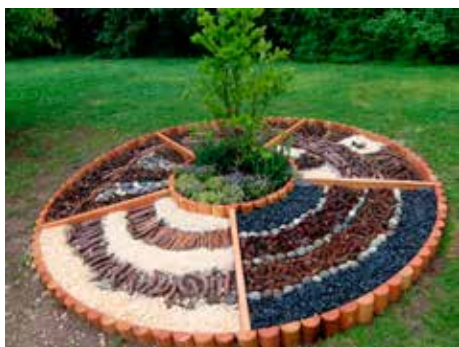
Le scuole materne dell'Argentario realizzano un Mandala nel Parco di Martignano