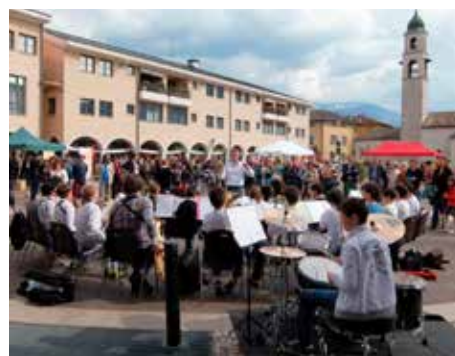
Approccio alla musica