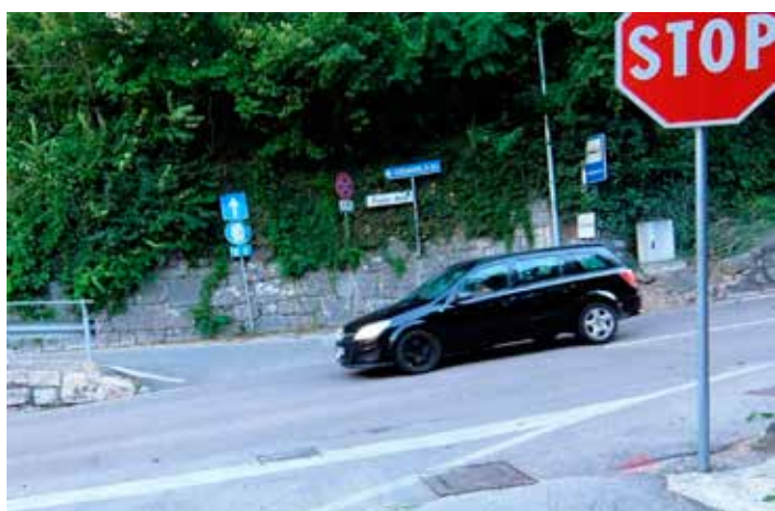
Incrocio a Ponte Alto