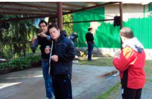
Tinteggiatura di due depositi esterni a Casa Serena