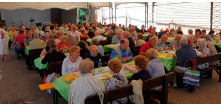
Festa anziani al Pian del Gac

Anziani "Le Querce" in collaborazione con i 5 circoli anziani del territorio; Fornace, 29 giugno 2016; contributo € 700,00.