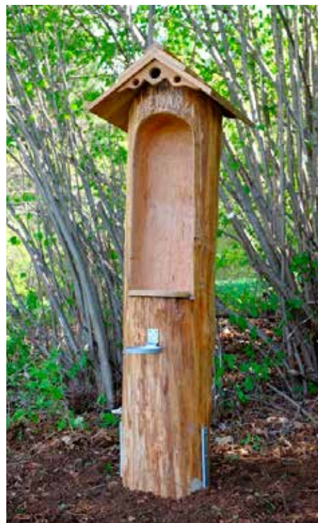
Costruzione del nuovo capitello a Montevaccino