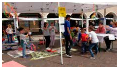
Baratto di giochi e giornalini