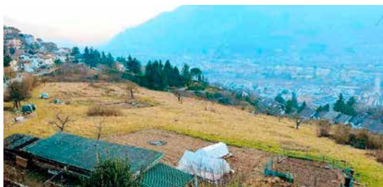
Area edificabile in via dei Castori

A nuovo Piano attuativo C3 via dei Castori vengono riconosciuti importanti elementi migliorativi quali: la diminuzione volumetrica, gli spazi verdi e a parcheggio in cessione al Comune e soprattutto la rinnovata viabilità di via dei Castori, che porterà un vantaggio a tutti i gli attuali residenti.