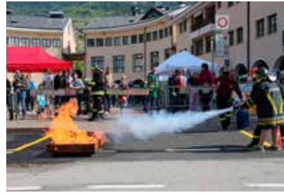
Manovre dei pompieri volontari per i bambini