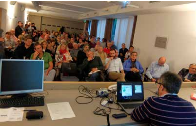
Assemblea pubblica a San Donà