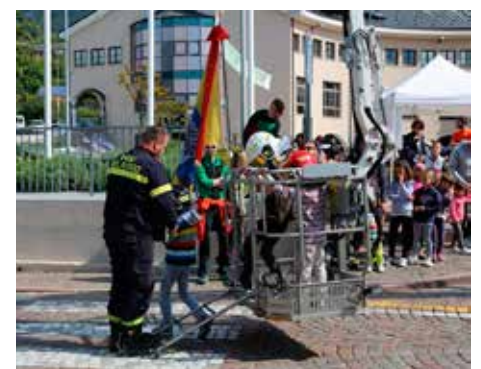
In volo sulla piazza con l'autogru dei pompieri