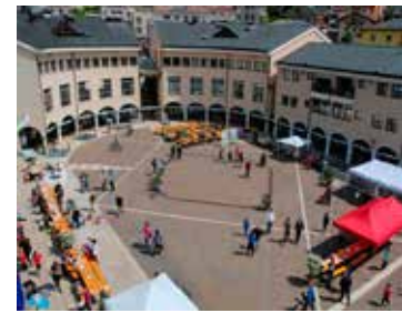
Sguardo sulla piazza

to la piazza in un bel sabato di sole è stato forse il miglior riscontro che l'evento potesse ottenere.