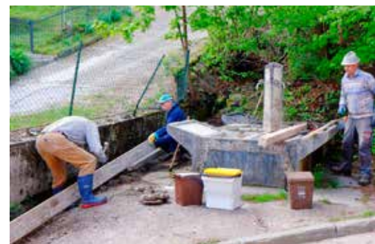
Sistemazione della vecchia fontana a Montevaccino