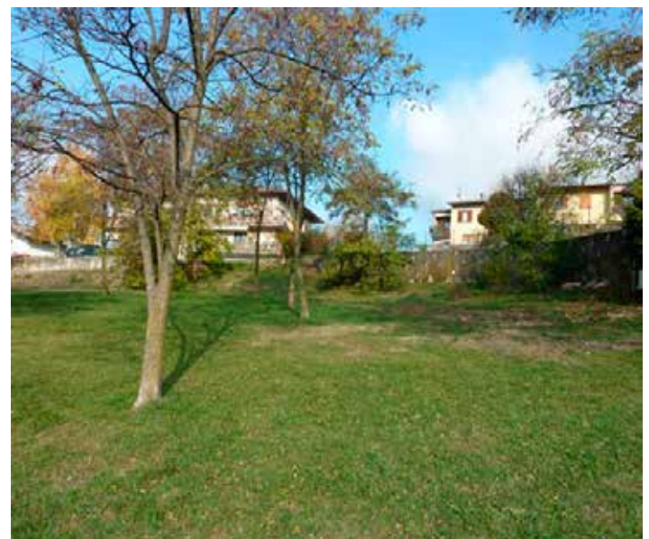
Area disponibile per gli orti comunitari