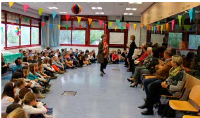
Gemellaggio a Cognola

Coloro che desiderano prendere visione delle iniziative del gemellaggio possono visitare il sito: www.amicidischwaz2.webnode.it oppure contattare l'associazione all'indirizzo mail: amicidischwaz@alice.it