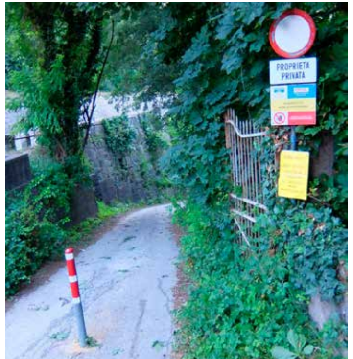
Ingresso al bacino artificiale