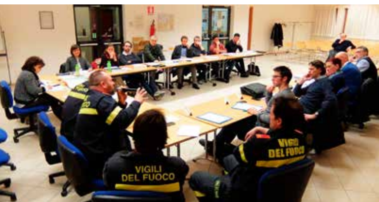
Seduta Consiglio 17 marzo 2016