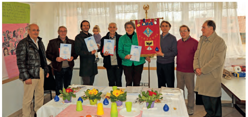
FESTA DEL DONATORE – 28 febbraio 2016 - Gruppo dei Soci premiati con i diplomi e le benemerienze

L'anno che sta per concludersi segna anche la fine del mandato quadriennale del Direttivo in carica, iniziato nel gennaio 2013; verrà rinnovato nel corso dell'assemblea prevista nel mese di gennaio 2017. Sono stati quattro anni nel corso dei quali i componenti del Consiglio si sono im-