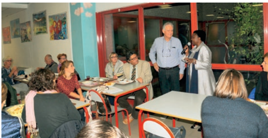
Immigrati: l'ex Ministro Cécile Kyenge partecipa alla cena organizzata presso l'Istituto Comenius

persecuzioni, si è messo in viaggio per l'Europa. Un centinaio di ospiti, oltreché godere di un'interessante serata, hanno avuto la gradita sorpresa di condividere una breve discussione con l'ex ministro dell'integrazione Cécile Kyenge.