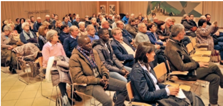
30.11.2016 Molto partecipata la serata di valutazione di Argentario Day- Tutto l'anno, presso la Sala polifunzionale a Cognola.