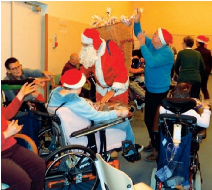
Festa a Casa Serena.

Ti racconto la mia terra..., laboratori realizzati assieme ai ragazzi richiedenti asilo ospitati a Montevaccino, la Circo-scrizione pubblicizza l'iniziativa e mette a disposizione gli spazi;