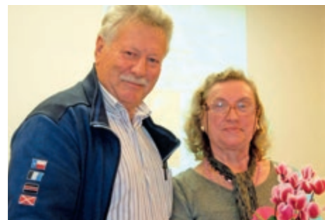
28.10.2016 Si omaggiano le poetesse al Concorso del Comitato Ricreativo Culturale di Martignano.