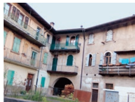
Tipica casa con cortile a Cognola de sotto.