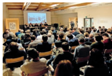
15.11.2016 Pubblico delle grandi occasioni per discutere di mobilità sulla Collina di Trento, nella sala polivalente del Centro Civico a Cognola.