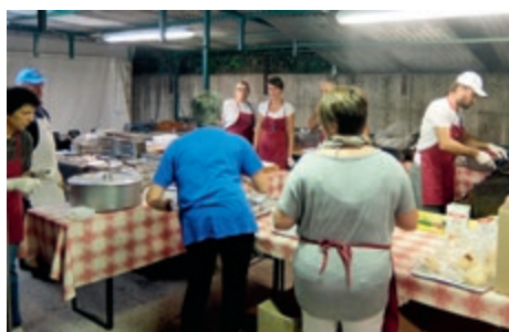
10.09.2016 Anche quest'anno grande lavoro per i volontari della Sagra di Montevaccino.