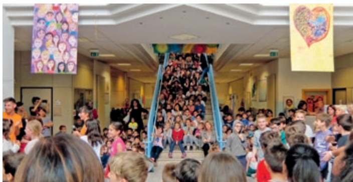
Accoglienza alunni di Schwaz presso l'Istituto "Comenius".

Trasferta a Schwaz di un coro dell'Argentario in occasione del concerto dell'Avvento, 17/18 dicembre 2016, spesa prevista € 1.200,00.