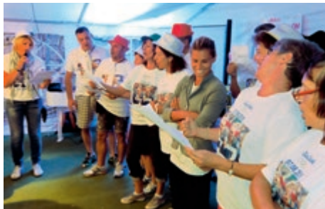
Festa a Villamontagna.