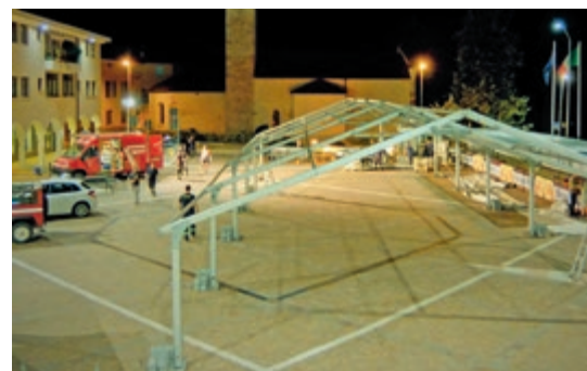
19.09.2016 I Vigili del fuoco Volontari lavorano in turnata per installare il tendone della sagra di Cognola.