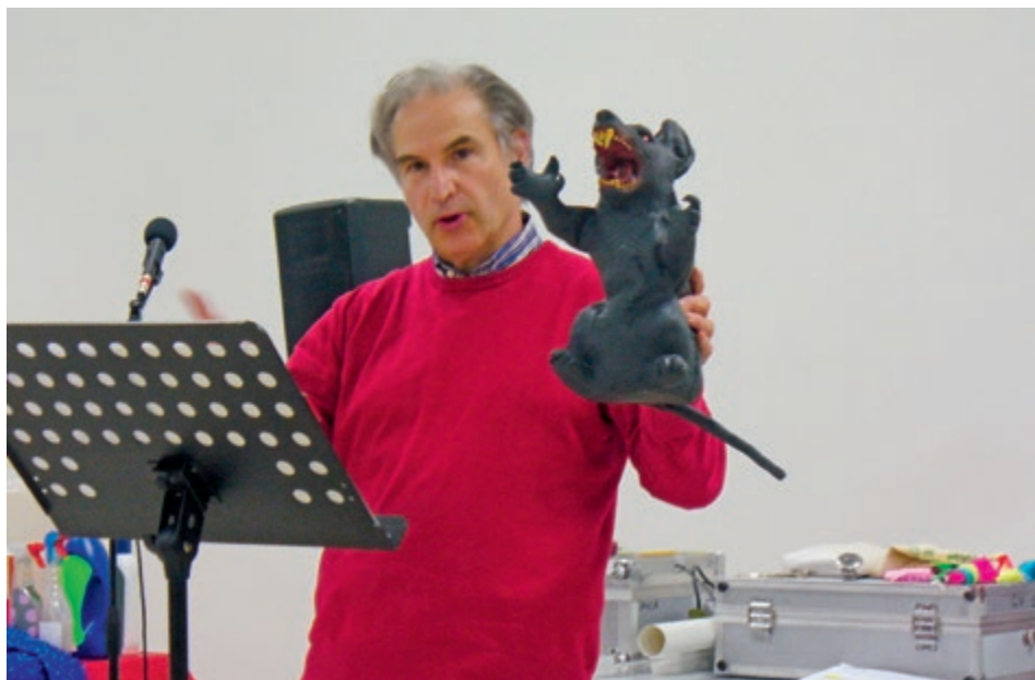
Noi e il nostro orgoglio (topo mostruoso)

Nelle esperienze e nelle riflessioni si è condiviso il fatto che esiste un’Energia universale al di sopra delle nostre capacità di comprensione e di gestione e che è a disposizione per ognuno, ma che talvolta non si riesce ad individuare. È un’Energia che anima la forza interiore di ciascuno e si presenta come un affidabile navigatore di ogni progetto di vita. Esempificando si può