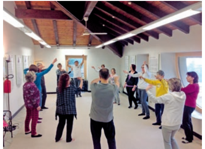
C'entriamoCI. Un momento del laboratorio anti stress

La risposta che viene spontanea è che forse c'è bisogno proprio di luoghi protetti, condivisi con persone che cercano la stessa cosa: la libertà di esprimere ciò che il cuore ci dice, senza giudizio, senza sentirsi ridicolizzati. Questo in un tempo frenetico che non dà la possibilità e lo spazio di guardarsi dentro, e che invece pretende prestazioni, del più alto livello possibile, senza valutare la necessità di una 'valvola di sfogo'. Così le persone accumulano, ed anziché individuare delle risorse proprie per gestire tutto questo turbinio, talvolta si chiudono, abbattute, cedendo alle richieste del mondo moderno.