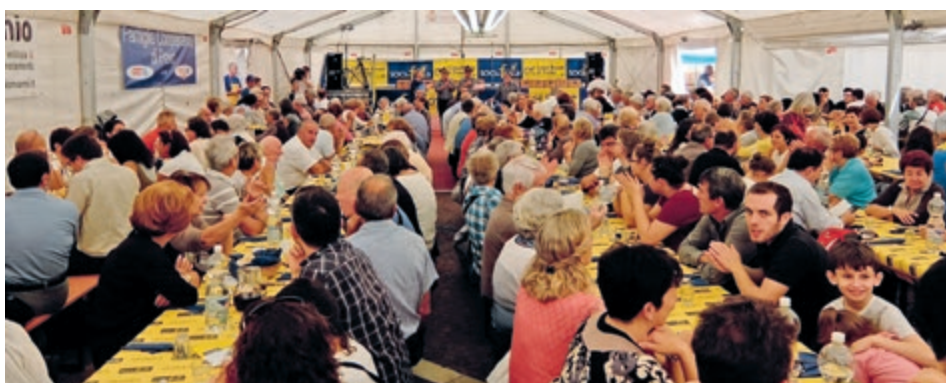
01.10.2016 Gli Alpini di Cognola organizzano il superpranzo per i soci della Cassa Rurale di Trento.