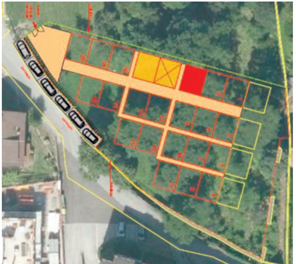
Area di via Masetti, destinata agli orti urbani

A Montevaccino , lungo la provinciale 131 a valle delle case di Monte di Sotto