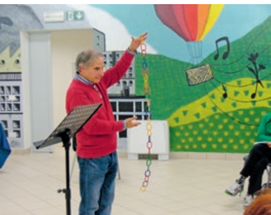
Gli anelli che formano la catena delle nostre dipendenze

atteggiamenti e pensieri negativi, pesantezze e dipendenze che non ci consentono di elevarci interiormente. Fra gli obiettivi, dunque, quello di ‘volare alto’ valorizzando virtù quali l’umiltà, la gratitudine e la pazienza rendendoci meno prigionieri di gabbie mentali che ci costruiamo nella quotidianità. Solo così ci si rende disponibili allo stupore, alla meraviglia e alla sana curiosità ‘liberando il nostro bambino interiore’. Serve allenamento teso ad abbandonare atteggiamenti di facciata e false sicurezze ‘Mettiamoci in gioco’ per riscoprire la gioia e la purezza del grande dono che è la vita”.