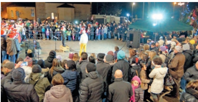
14.12.2016 Concerto di Natale offerto dell'Istituto Comenius su piazza Argentario.