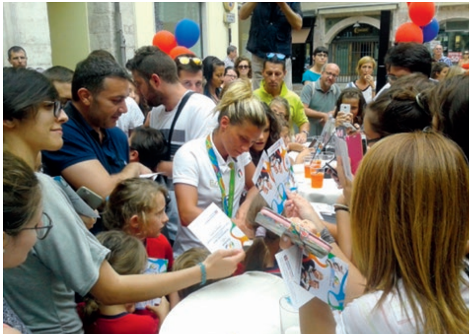
Festa a Trento.