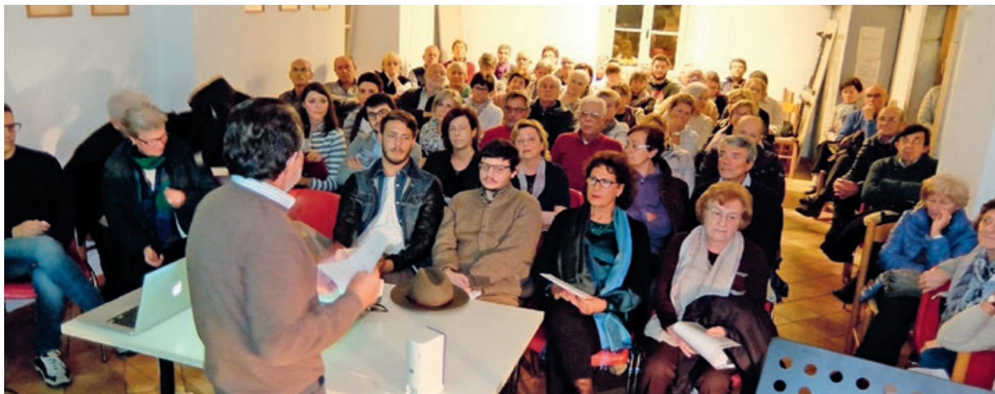
Pubblico attento a Martignano durante la rassegna di poesia.