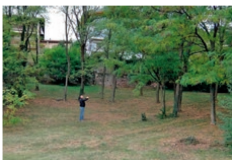
10.10.2016 A seguito di un sopralluogo si definiscono le possibili aree per gli orti di Cognola.