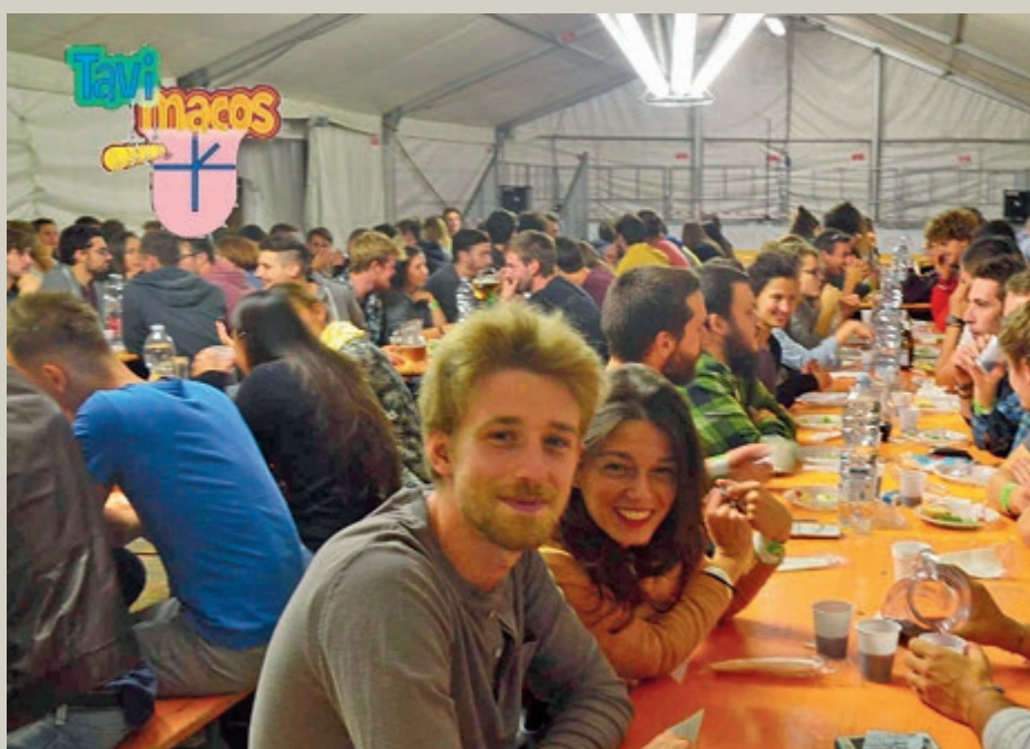
23.09.2016 L'Associazione Tavimacos riempie il tendone in piazza Argentario di Cognola di giovani locali.