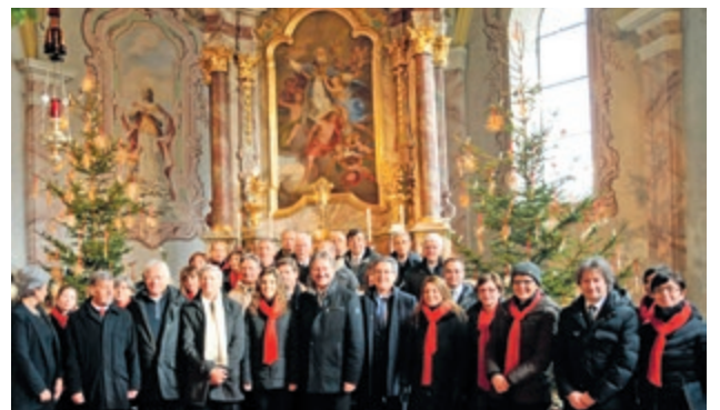
18.12.2016 Il Coro San Isidoro si esibisce nella chiesa di San Martin di Schwaz.