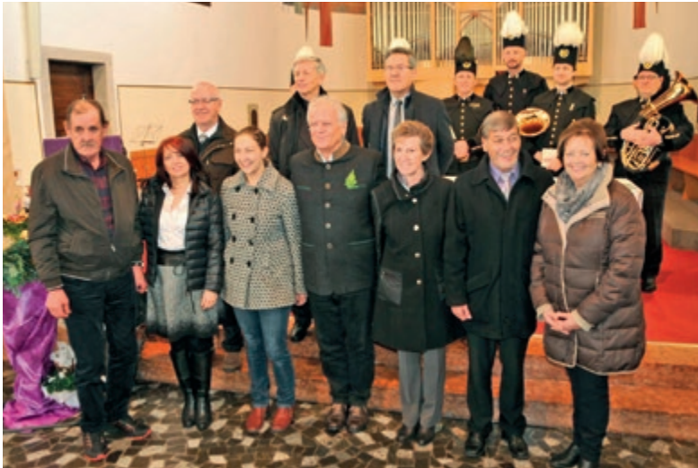
27.11.2016 La delegazione della gemellata città di Schwaz consegna la corona d'Avvento a Martignano.