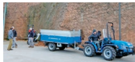
12.11.2016 I volontari del Coro Monte Calisio ripuliscono l'esterno della palazzina polifunzionale di Martignano asportando 25 q. di materiale.