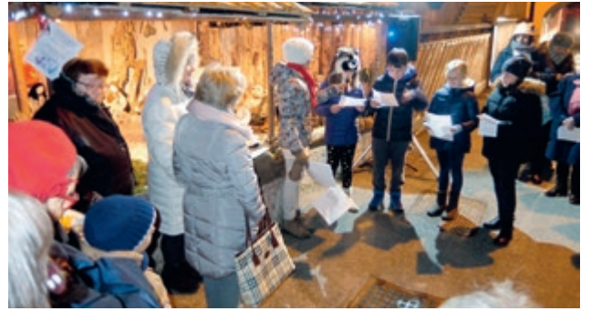
15.12.2016 Tradizionale incontro prenatalizio alla fontana di Cognola de sotto.