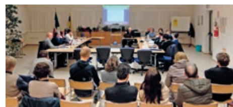
24.11.2016 Pubblico attento in occasione della discussione sulla qualità dell'acqua durante il Consiglio Circoscrizionale.