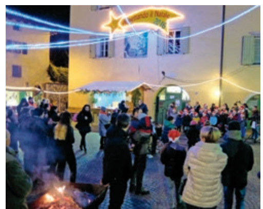
19.12.2016 Il Coro la Corolla e i Piccoli Fiori in piazza Canopi di Martignano.