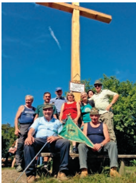
22.08.2016 Gli Alpini di Tavernaro ricostruiscono la croce in legno di Larice su Cima Calisio.