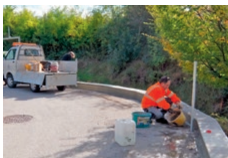
20.10.2016 Gli operai comunali sistemano le coperture dei muretti al parco di Martignano.