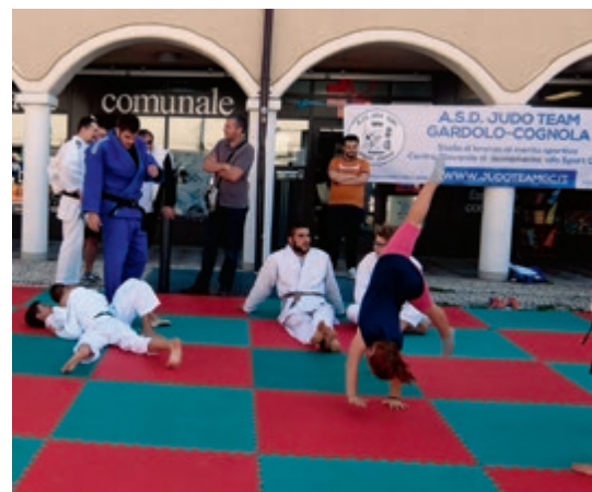
25.09.2016 Judo Team conquista anche nel 2016 importanti riconoscimenti nazionali internazionali.