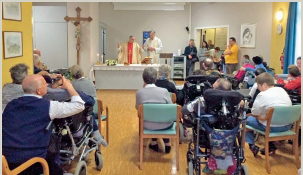
Mons. Lauro Tisi a Casa Serena.

Dopo la celebrazione, il Vescovo si è intrattenuto per un momento di festa con i presenti dimostrando la sua grande semplicità e sensibilità e promettendo future visite informali. Si coglie l'occasione del ricordo di questa visita per invitare tutti coloro che volessero partecipare alla celebrazione della santa messa nel consueto orario delle 15.30 di ogni venerdì.