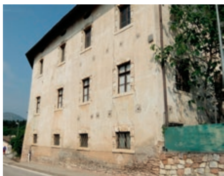
11.04.2016 Vengono finalmente tolti i ponteggi a Palazzo Travaglia di Cognola.