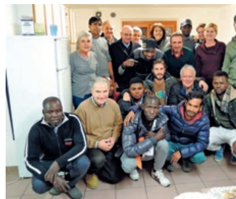
11.11.2016 Gli immigrati ospiti di Villa Lidia a Mopntevaccino organizzano una cena con alcuni amici dell'Argentario.