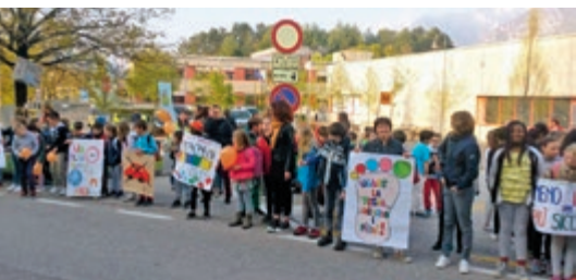
11.04.2016 Una delle tante manifestazioni per sensibilizzare i genitori all'uso del Pedibus.