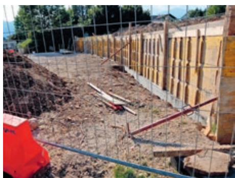
19.07.2016 Importanti lavori nel piazzale dell'asilo nido di Cognola, dietro il Centro Civico.