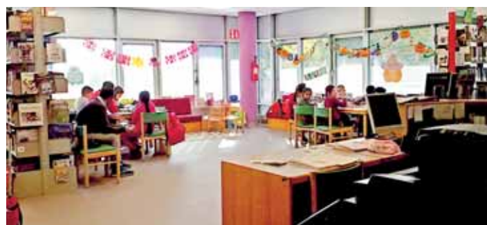
Il Punto Prestiti.

Sono stati ultimati i lavori di adeguamento degli impianti e rifacimento dei serramenti presso le aree di proprietà comunale in Piazzale Europa, spazi ad uso del circolo pensionati "Tovazzi", Sala circoscrizionale e Punto prestiti. Il Punto prestiti, dopo la chiusura estiva, il 28 ottobre ha riaperto al pubblico i suoi spazi rinnovati anche nell'arredo e nella disposizione degli spazi.