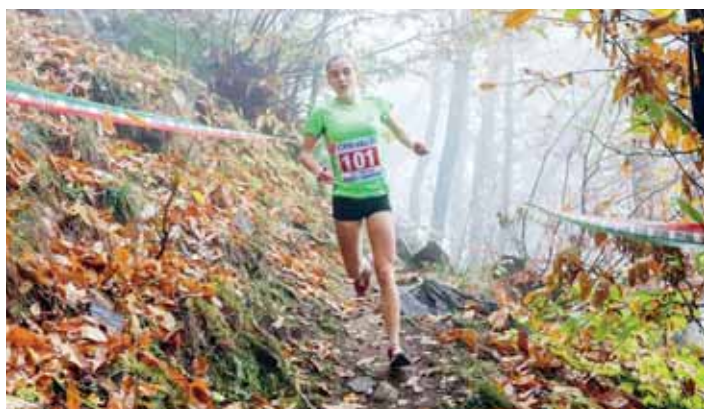
Campionato italiano a staffetta di corsa in montagna. Passaggio nel bosco