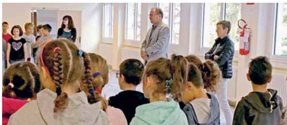
Il Sindaco con i ragazzini della scuola Nicolodi.

Ultima tappa della mattinata la scuola secondaria di primo grado Winkler. Al sindaco i rappresentanti di classe hanno illustrato i tanti progetti della scuola: dai soggiorni linguistici all'adozione a distanza di due bambini somali, dalle visite agli anziani della vicina casa di riposo alla partecipazione al concorso "Fratelli di sport" dedicato al tema