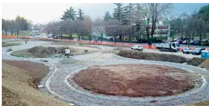
Giardino "Prato Grande".

Quest'estate sono incominciati i lavori di realizzazione del parco pubblico nella zona del Prato grande in viale Verona. La realizzazione è a carico del servizio ripristino della PAT con la partecipazione del Comune di Trento.