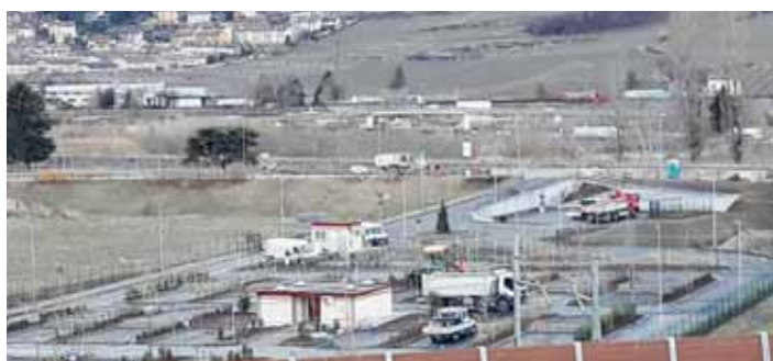
Area sosta camper.

Mercoledì 6 dicembre è stata inaugurata l'area camper di Via Fersina. Con le sue 33 piazzole è pronta a rispondere a quei turisti che sempre più numerosi arrivano in città per partecipare a quegli eventi che sono diventati un punto di richiamo nazionale: mercatini di Natale, festival dell'economia, festival della montagna, Muse, ecc. L'opera è stata realizzata dall'impresa Inco di Pergine ed è gestita da Trentino Mobilità che, per il primo anno di apertura, ha affidato l'incarico di cura e sorveglianza alla cooperativa Le Coste.