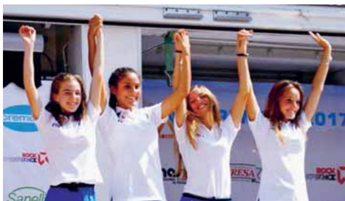
Premiazione della squadra italiana terzo posto ai mondiali di corsa in montagna.