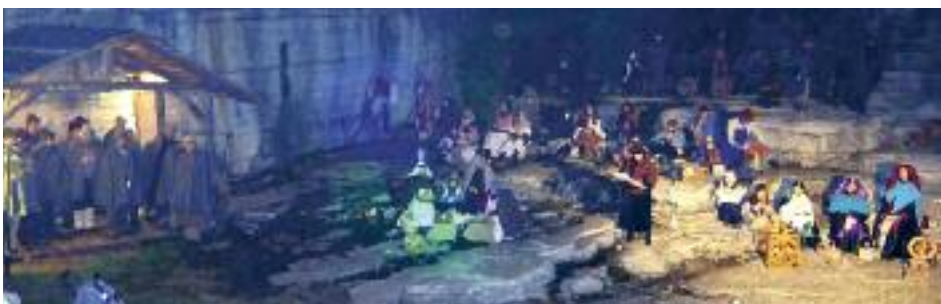
16.12.2017 > Rappresentazione del presepe vivente "Luci di Pila" alle cave di Villamontagna