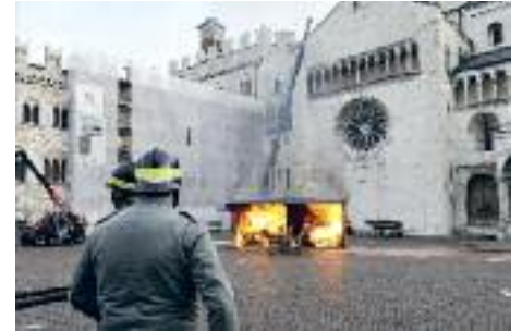
02.12.2017 > Vigili del Fuoco Volontari di Cognola durante l'esercitazione in piazza Duomo