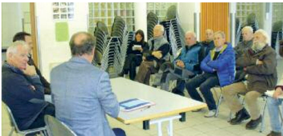
A Montevaccino con i rappresentanti delle associazioni

cune attendono risposta da quasi vent'anni – e altre nuove esigenze provenienti dalla comunità dell'Argentario in evoluzione in questi difficili anni. Vicino alle più o meno tradizionali iniziative, feste e manifestazioni (sagre, Argentario Day, festa dello sport,