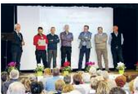
19.11.2017 > Gli Amici della Montagna festeggiano il 30° a Martignano