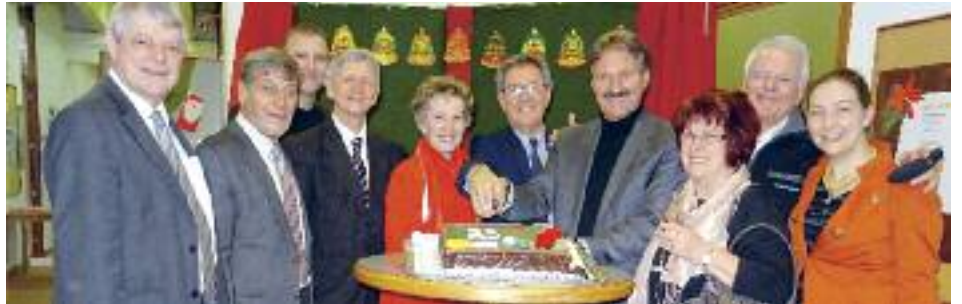
05.12.2017 > Foto di gruppo nell'incontro di gemellaggio tra le Scuole elementari Schwaz-Martignano