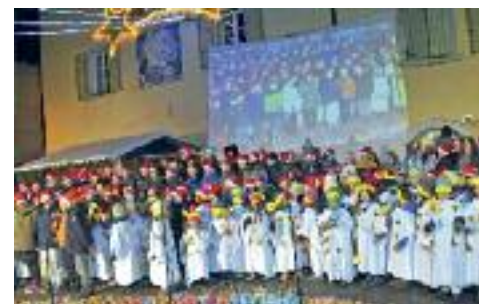
20.12.2017 > La scuola elementare di Martignano offre le sue potenzialità artistiche in piazza Canopi