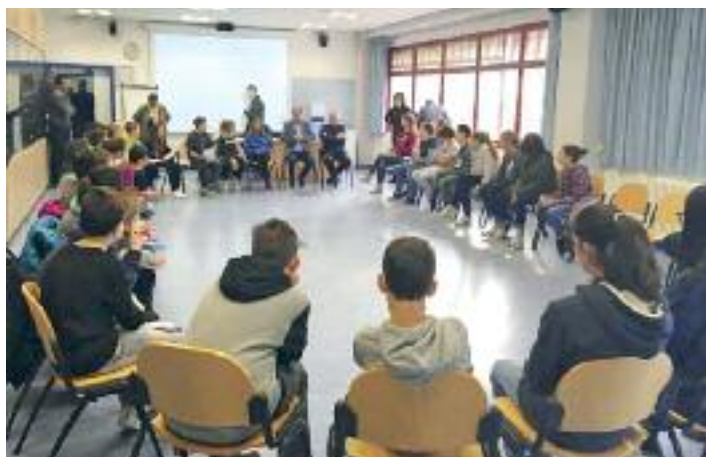
Confronto con il parlamentino degli alunni della Scuola media

mostre, incontri culturali... per citarne alcune) che tengono viva la comunità e fanno incontrare i propri membri, sono state elencate al primo cittadino anche le esigenze più impellenti e impegnative a livello economico. Per ricordare le più impor-