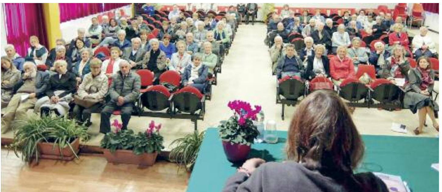
Un momento del partecipato convegno

Circoli che dovrebbero avere per obiettivo l’attenzione verso il diffondersi della povertà (materiale e immateriale), delle solitudini e delle malattie da civiltà per garantire a tutti, per quanto possibile e con interventi adeguati, il diritto a una vita dignitosa proponendo iniziative mirate proprie o in collaborazione con le Amministrazioni pubbliche. ■