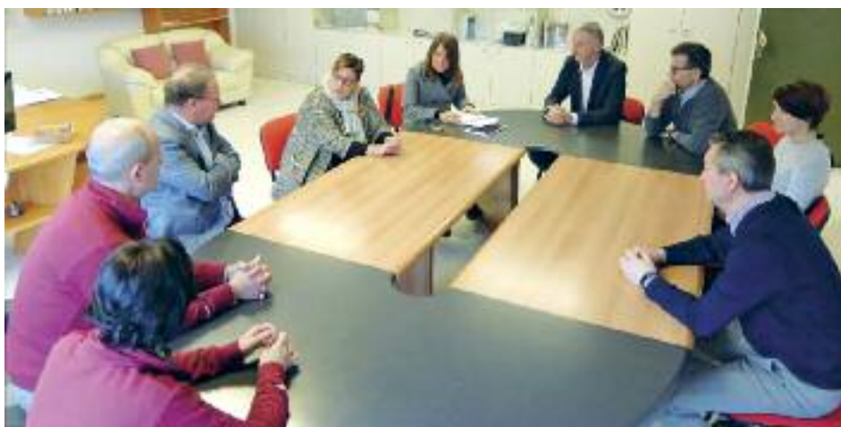
Istituito Comenius - Incontro con la dirigenza

Giornata intensa durante la quale il Sindaco ha potuto apprendere dalla viva voce degli stakeholder le cose che funzionano ed annotare, di proprio pugno sul blocco notes personale, le necessità più urgenti. Si è potuto così constatare che sul tappeto ci sono richieste "antiche", di anno in anno avanzate formalmente anche dal Consiglio Circoscrizionale – delle quali al-