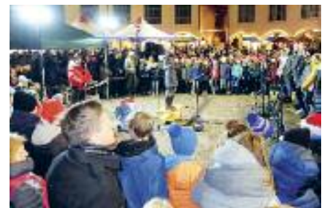
14.12.2017 > I ragazzi dell'Istituto scolastico "Comenius" augurano Buon Natale su piazza Argentario