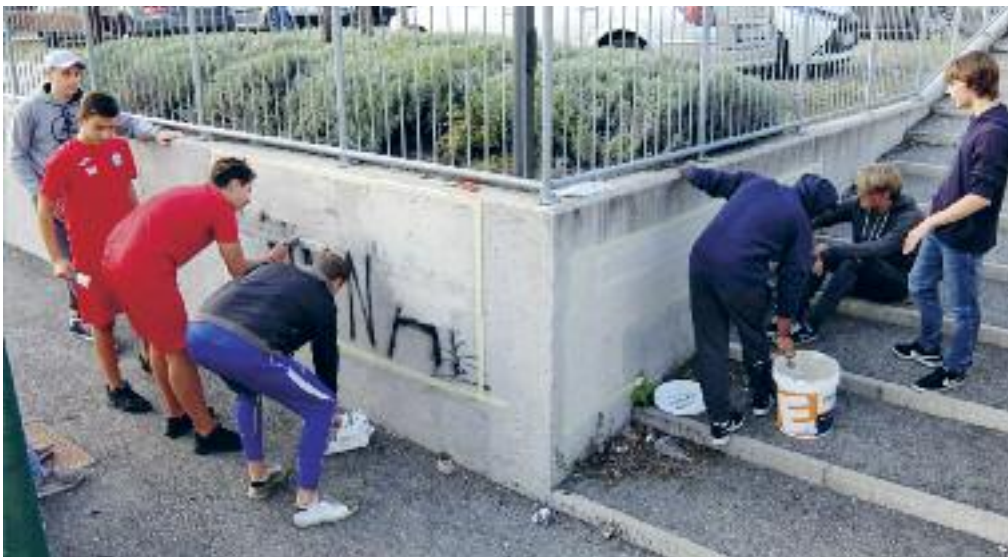
I giovani atleti del Calisio Calcio impegnati nell'Argentario Day a pulire i muri del campo sportivo

La piaga: dai 12 ai 17 anni il 60% dei ragazzi abbandonano il calcio! ■