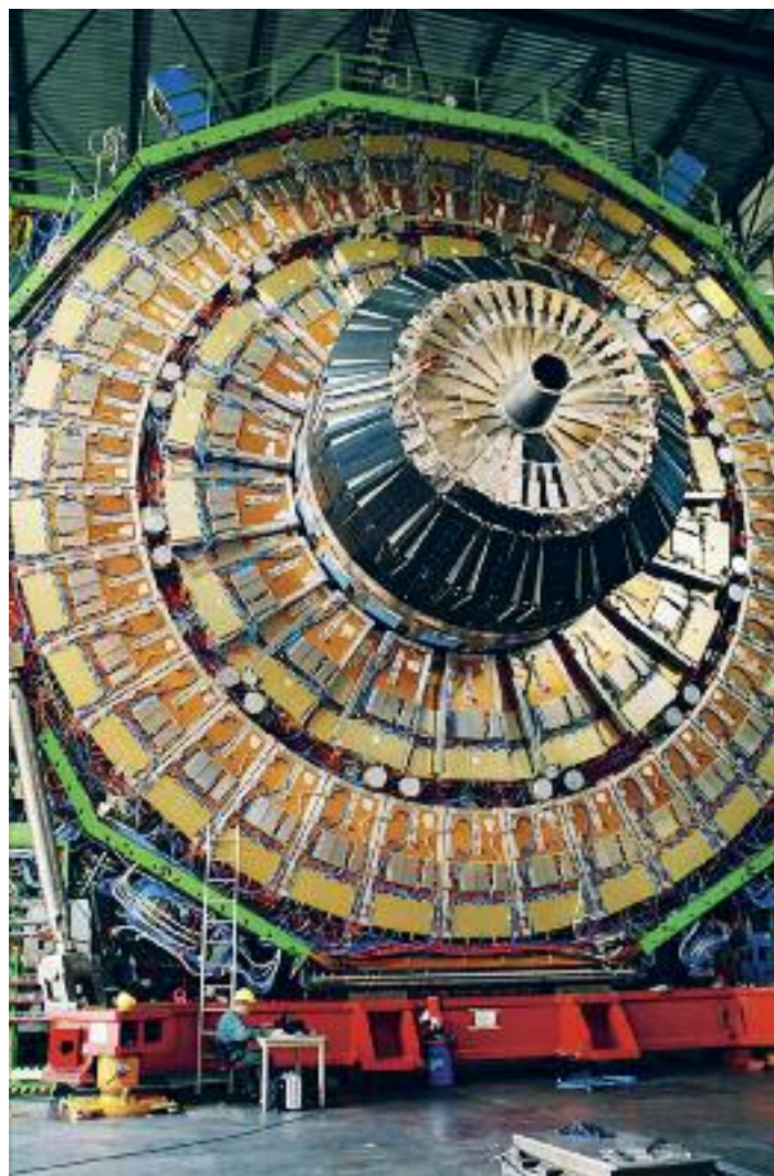
Lhc (Large Hadron Collider), acceleratore di particelle del CERN, con i suoi 27 km di circonferenza, è la macchina più grande del mondo

Avere attitudine e passione per matematica e fisica. E per studiare all'estero bisogna avere buone capacità di adattamento.