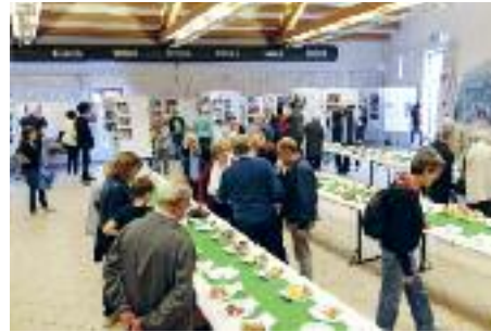
29.09.2017 > Inaugurazione della mostra micologica organizzata dalla SAT di Cognola. Sagra S. Rosario