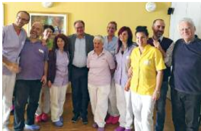
Casa Serena - Lo staff incontra il Sindaco