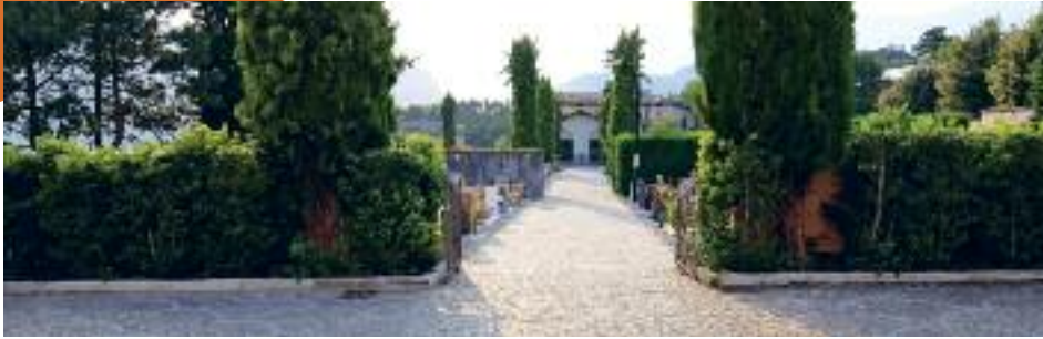
12.07.2017 > Si concludono i lavori di accesso al cimitero di Cognola