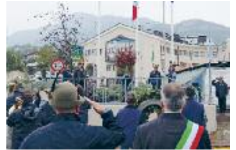
01.10.2017 > Manifestazione per il 30° di rifondazione degli Alpini di Cognola