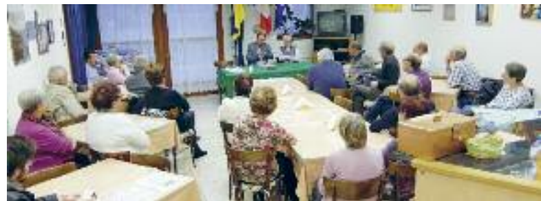
A Villamontagna presso il Circolo Anziani emergono le problematiche e le realizzazioni in corso