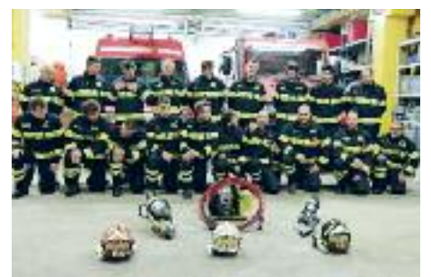
23.10.2017 > I Vigili Fuoco di Cognola si ritrovano in caserma per una esercitazione speciale