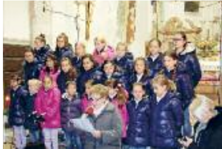
02.12.2017 > Il Circolo Anziani propone "Le Piccole Colonne" nella chiesa di Cognola