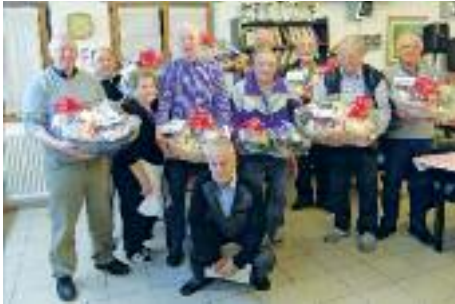
25.11.2017 > Gruppo vincitori al torneo di briscola provinciale organizzato al Circolo "Le Querce" di Cognola