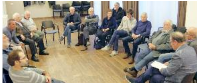
A San Donà gli stakeholder espongono gli obiettivi del quartiere

Ciò che è emerso con una certa costanza da più parti, e desta preoccupazione, sono due “nuovi” problemi sociali: la solitudine (da isolamento) e la povertà di un numero sempre più alto di residenti. Alcune associazioni e i circoli anziani locali si stanno impegnando su questi fronti ed anche per questo, specialmente a San Donà e Villamontagna, denunciano mancanza di spazi (cioè di Centri sociali) per incrementare rapporti di relazione con quelle fasce sempre più larghe di popolazione che soffrono questi disagi. ■