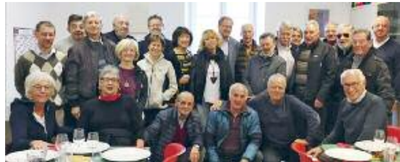
Martignano - foto di gruppo dopo lo scambio di opinioni e il pranzo