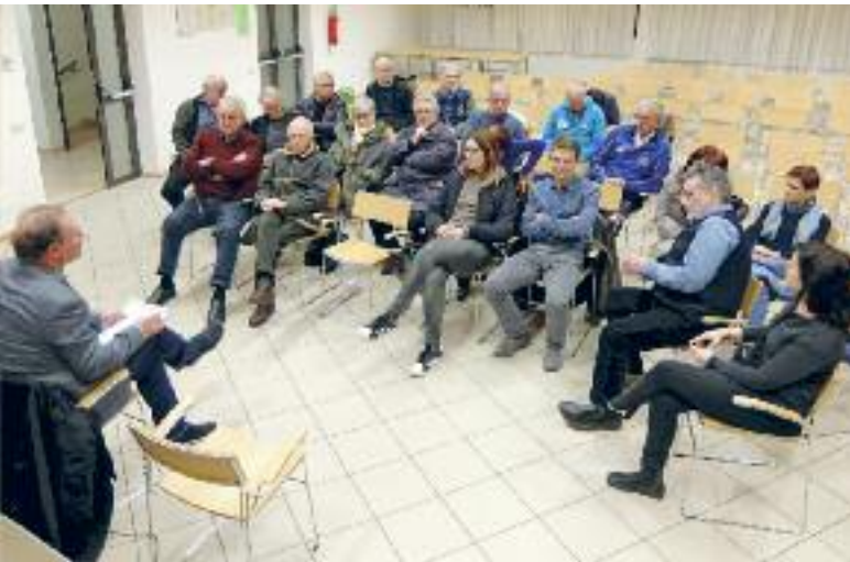
Incontro a Cognola con i responsabili di vari settori della comunità

tanti: realizzazione dei centri sociali a San Donà e Villamontagna; rifacimento del teatro di Cognola; nuova caserma dei vigili del fuoco volontari.