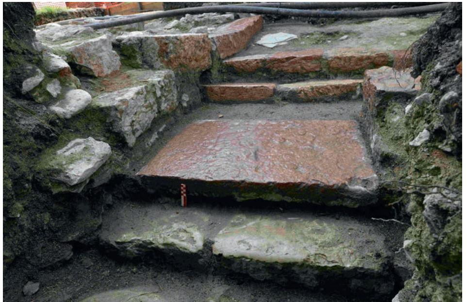
Dettaglio agli scalini emersi

Con il coinvolgimento nel progetto dell'istituzione pubblica nelle vesti