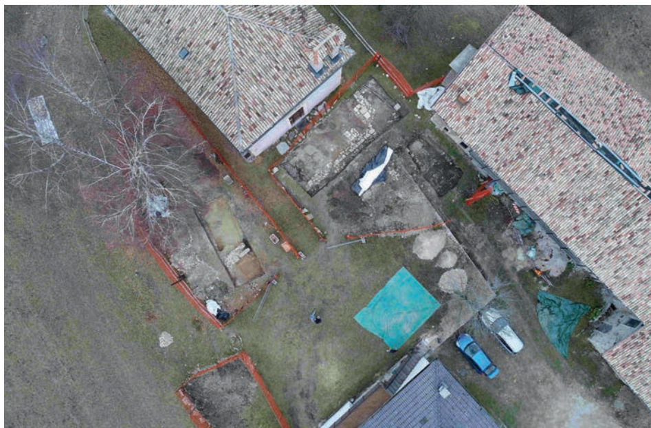
Fine campagna di scavo 2017

so finalmente di portare l'attenzione delle istituzioni pubbliche e della politica sul sito di Sant'Anna, mostrando lo stato di pericolosità degli edifici storici e creando la coscienza e concretezza di un intervento di consolidamento urgente e assai immediato.