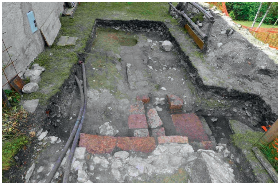
Scalinate e piani pavimentali in malta

Quello che al momento è possibile avanzare come ipotesi di ricostruzione