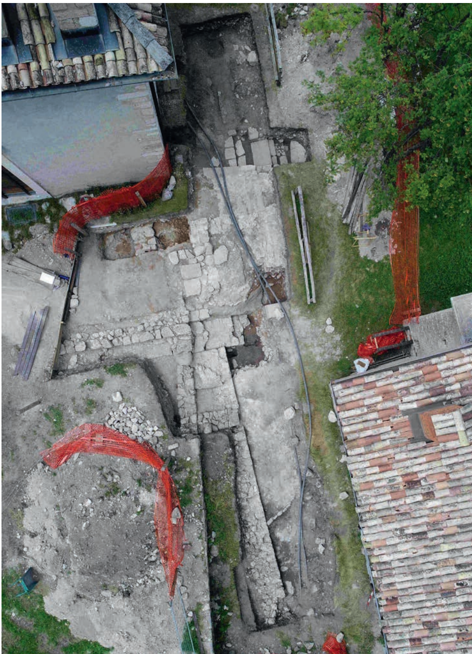
Fine campagna di scavo 2018

Per quanto riguarda invece la Casa di Villeggiatura ("casa bianca") presente nell'area del Comparto Storico di Sant'Anna il Comitato A.S.U.C. dovrà effettuare alcune valutazioni, fra le quali anche l'ipotesi del suo abbattimento, ciò in considerazione dell'elevato onere finanziario che dovrebbe sostenere l'Asuc per la riqualificazione del medesimo.