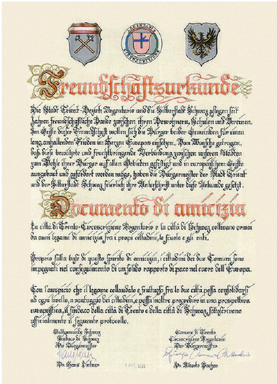
Foto: il documento firmato.

Come è stato per molte altre associazioni, purtroppo, l'avvento del Covid ha bloccato ogni tipo di iniziativa, riducendo la possibilità di mantenere rapporti in presenza. Terminata la pandemia si è ripreso con le iniziative ma l'associazione si trova ora nella necessità di dover rinnovare il direttivo, inserendo nuove forze e soprattutto, deve fare lo sforzo, tramite il coinvolgimento di tutti attraverso iniziative e gite, di ritornare in mezzo alla comunità. Nei prossimi mesi ci sarà quindi l'elezione di un nuovo direttivo, che avrà poi il compito di trovare nuove forze e ripartire, dopo le tantissime attività svolte negli anni passati, partendo dal lavoro svolto e raccogliendo l'eredità di quanto fatto in questi anni. C'è necessità di allargare la base sociale e tornare a collaborare fattivamente con le altre associazioni del territorio. Associazione e circoscrizione stanno lavorando per riprendere il dialogo anche con la nuova giunta insediata durante le ultime elezioni, mentre dal canto suo la scuola sta cercando di riprendere il dialogo con la nuova dirigenza a Schwaz dopo il cambio e la riorganizzazione dell'organizzazione amministrativa nell'ambito scolastico della cittadina tirolese.