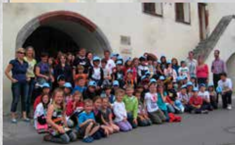
"visita a Fliess delle scuole elementari di Meano e Vigo Meano"

L'anno passato è stato un anno difficile per i nostri rapporti. I confini sono stati chiusi e le visite rese impossibili. Una situazione molto triste: le persone hanno dovuto evitare i contatti, sono state annullate le manifestazioni e la vita sociale è profondamente cambiata. Anche a Fliess ci sono stati molti contagi e purtroppo alcune persone sono morte a causa del Covid. La speranza è che quest'anno riusciremo a superare la pandemia e sarà possibile riprendere i contatti.