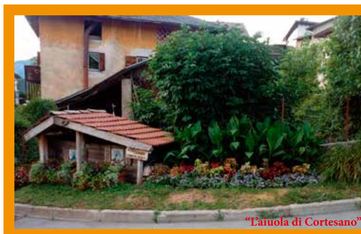
"L'aiuola di Cortesano"

"ADOTTA UN'AIUOLA" che vede impegnate da diversi anni l'associazione Canopi Cortesano e l'associazione La Meridiana Meano