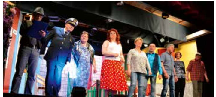
FILOGAMAR - foto di scena de "Impossibile nar d'accordo".

http://www.cofas.it/compagnie/cognola-compagnia-filodrammatica-filogamar