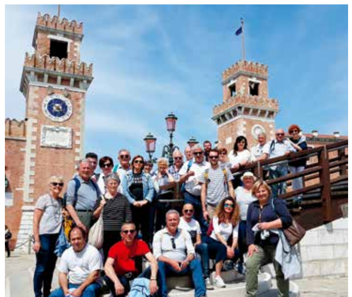
ARGENTO VIVO - foto di gruppo gita del ventennale a Venezia.

http://www.cofas.it/compagnie/cognola-compagnia-argento-vivo