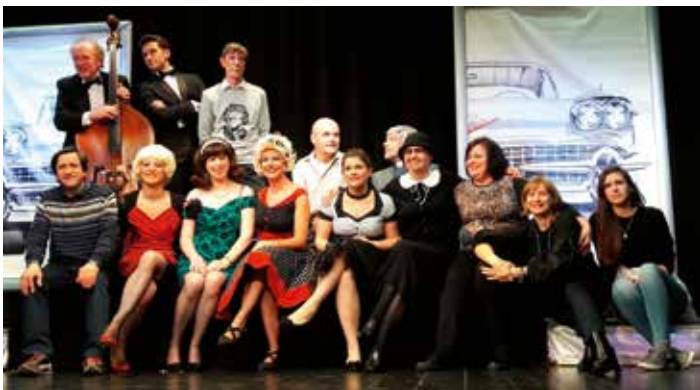
LA BARACA – foto di scena de "Tua moglie non lo farebbe".

http://www.cofas.it/compagnie/martignano-filo-la-baraca