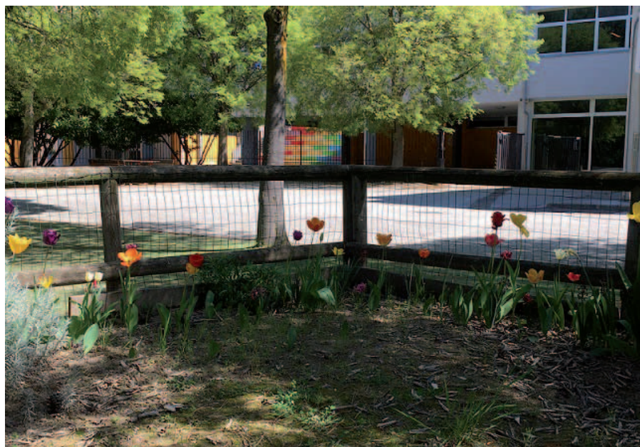
Foto dei fiori sbocciati nell'orto durante la quarantena, mandata a tutti gli alunni.