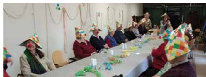
DUOMO SANTA MARIA

Da anni tutte queste reti di volontariato della Circoscrizione sono attive in favore degli anziani più fragili, con momenti di incontro e/o compagnia a domicilio e sono anche punti di riferimento attraverso per il progetto Persone Insieme per gli Anziani (P.I.A.) , N° verde unitario cittadino 800.29.21.21 a favore degli anziani fragili per risposte di solidarietà a bisogni di bassa soglia.