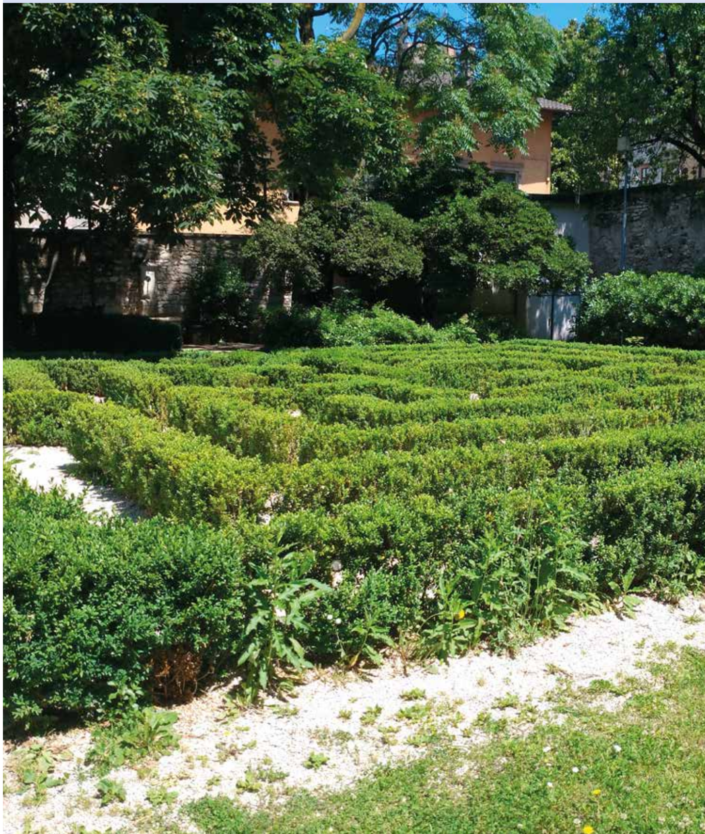
GIARDINO SAN MARCO

Corso Buonarroti, 45 - Trento - Tel. 0461 889930