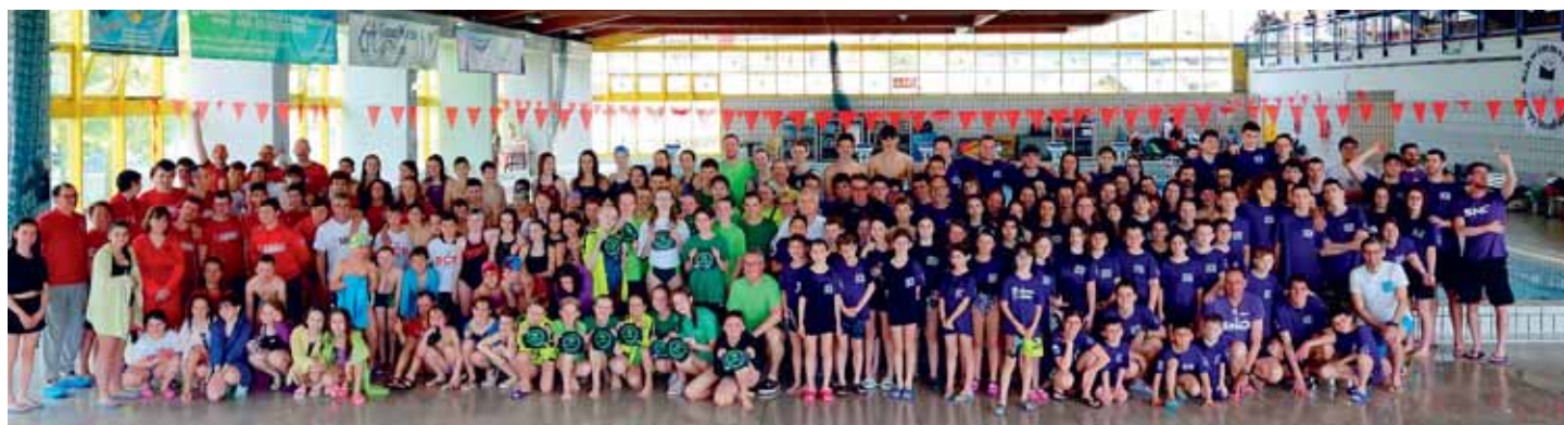
Gli atleti delle Associazioni Nuotatori Trentini, Buonconsiglio Nuoto e la delegazione dei ragazzi di Neufahrn