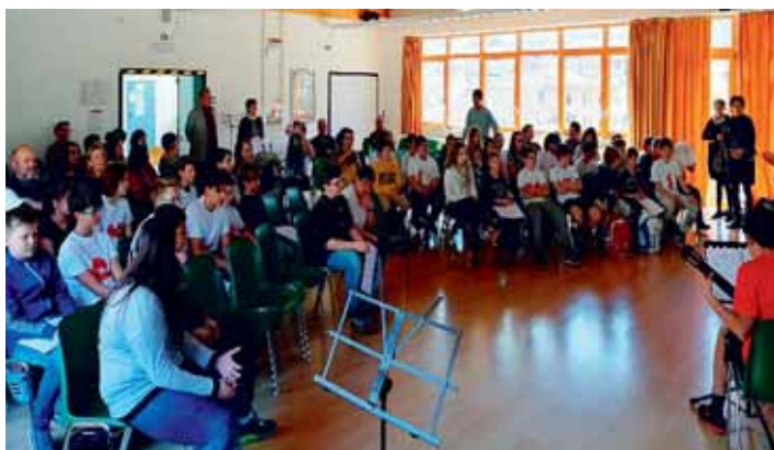
Scambio dei ragazzi scuole medie.

Questo ruolo viene confermato dalla presenza di coro, banda e vigili del fuoco in occasione del Maibaum e della commemorazione dei caduti. Va apprezzato soprattutto lo spirito di servizio con il quale – in questi appuntamenti - si mettono a disposizione della nostra associazione e più in generale della comunità. Va sottolineato anche come alcune iniziative non sarebbero possibili senza il supporto del gruppo alpini e della loro forza finanziaria e operativa. Ci piace citare anche l'aiuto ricevuto in più occasioni dal Gruppo Donne E. Battisti