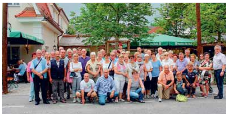
Partecipanti alla trasferta per la Buergerfest.

e dalle donne del Circolo anziani. Ma la cosa che più di altre vogliamo mettere in evidenza è il rapporto con il Comitato Comunitario delle associazioni. Negli ultimi anni abbiamo registrato un sempre maggiore coinvolgimento ed un ruolo sempre più attivo. Citiamo ad esempio i festeggiamenti per il Maibaum a Gardolo, dove il supporto logistico e gastronomico è diventato fondamentale per il successo della manifestazione, alla pari della presenza e della gestione dello stand in occasione della Buergerfest a Neufahrn. Ad impreziosire questo curriculum di tutto rispetto, quest'anno ricorre il 40° dalla firma di costituzione del gemellaggio fra la Circostrizione di Gardolo ed il Comune di Neufahrn, ricorrenza questa che è stata degnamente ricordata con tre giorni di festa a Gardolo e a Neufahrn dove le rispettive delegazioni sono state ospiti graditissimi.