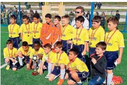
La squadra dell'USD GARDOLO.