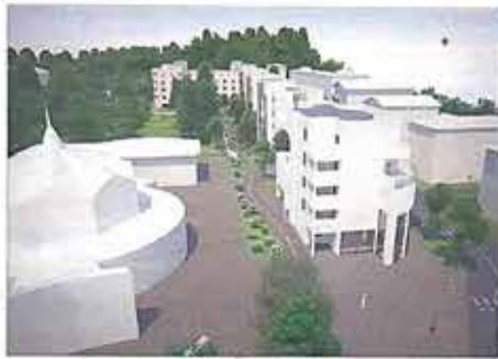
Il progetto Itea per viale dei Tigli

Il consiglio della circoscrizione dell'Oltrefersina richiama l'attenzione dell'amministrazione comunale sugli spazi previsti per la nuova biblioteca di via dei Tigli, chiedendo che siano adeguati alle esigenze di un sobborgo di quasi 20mila abitanti. In un documento approvato nei giorni scorsi, si è infatti rilevato come la zona sia attualmente sfornita di servizi in grado di rispondere alla crescente domanda di luoghi di lettura e di studio. La nuova biblioteca, i cui lavori dovrebbero iniziare nel 2018, si inserisce all'interno di un piano di nuova urbanizzazione della zona che prevede la realizzazione di una palazzina comprensiva di servizi pubblici e appartamenti privati, nonché di un evolutivo della via