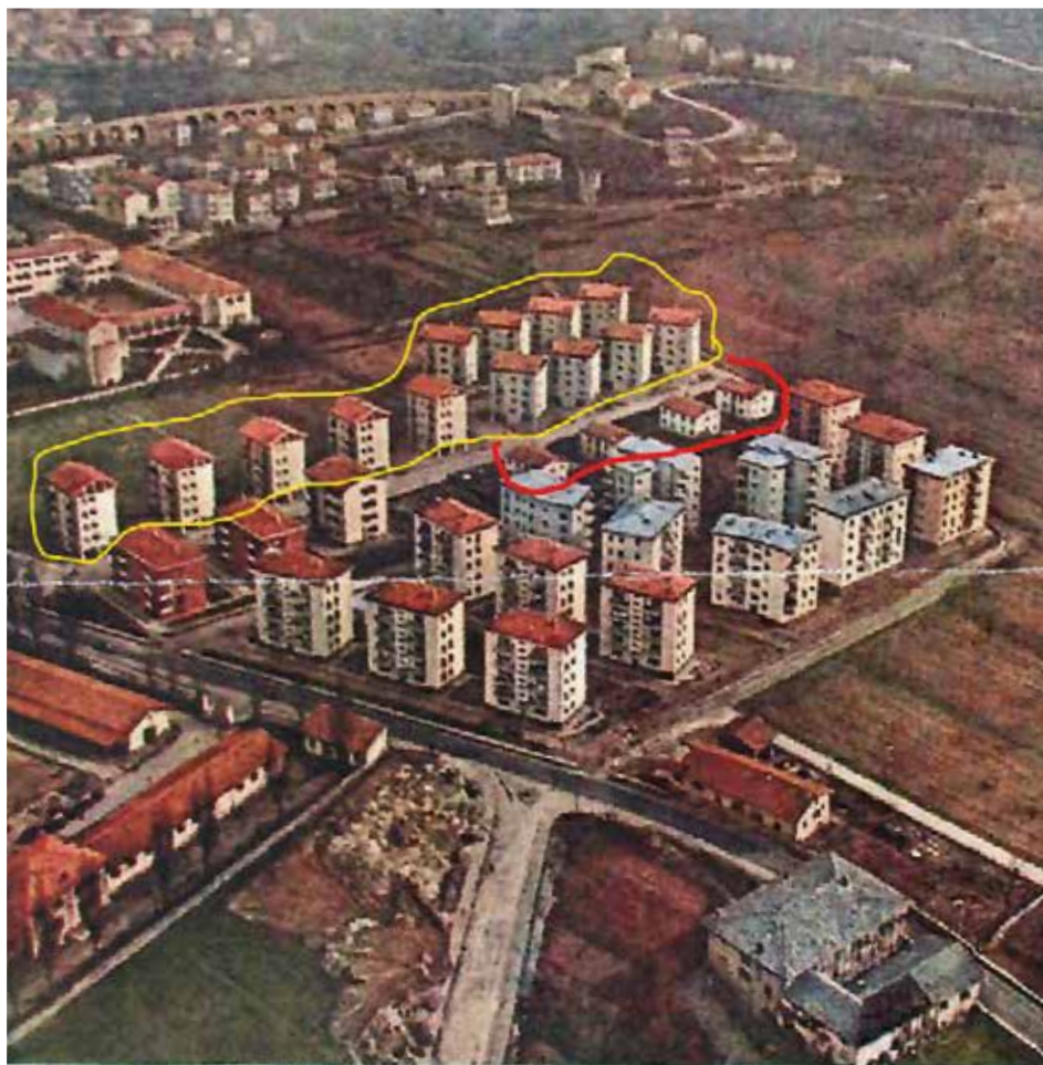
Trento - Il nuovo quartiere residenziale di San Bartolomeo

Gli interventi erano sostenuti da un piano finanziario americano