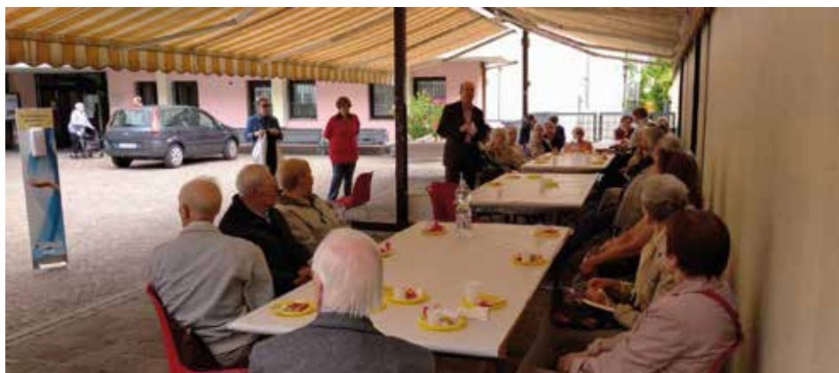
Incontro Caritas Duomo Santa Maria.

Così, sul piano dell'attenzione agli anziani più fragili , a Cristo Re , la tradizione di ricordarsi attraverso gli auguri di compleanno