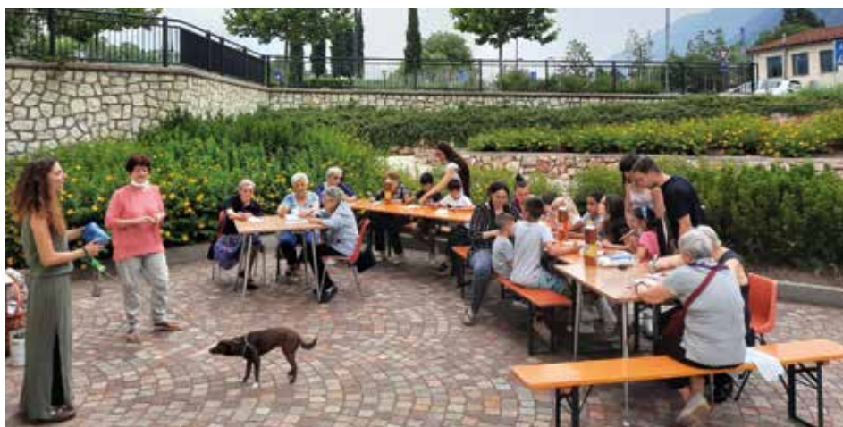
Associazione Casa Aperta e bambini Ass. Pop Up Tombola a Piedicastello.

I temi toccati sono stati molti: dal ruolo attivo degli anziani attraverso l' azione volontaria , all'importanza di assumere sani stili di vita (ginnastica dolce, ginnastica mentale) e apprendere le nuove tecnologie, ma soprattutto la centralità della dimensione sociale/comunitaria , che si concretizza con la promozione di attività socio