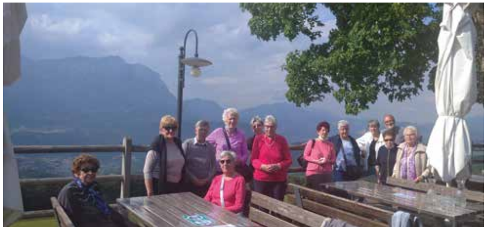
Associazione Casa Aperta a Malga Brigolina.

Si è parlato anche di nuove tecnologie , dell'importanza di stimolarsi reciprocamente all'apprendimento dell'uso dello smartphone: la Parrocchia, in collaborazione con il Comune e la Circoscrizione, dall'anno scorso ha promosso più sportelli tecnologici per anziani attraverso giovani di servizio civile e volontari della Parrocchia. Attualmente ne sono attivi due, a Cristo Re e ai Solteri, sebbene non siano molto i partecipati: chiunque voglia fruire di questa disponibilità, può chiamare il 0461/823325 da lunedì al sabato 9.00-10.30 .