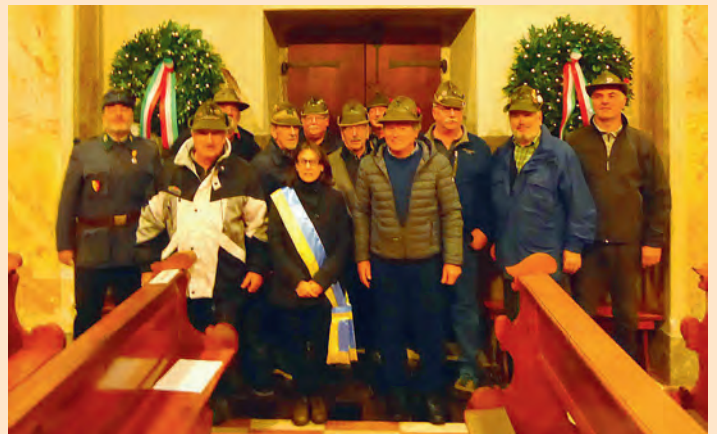
S. Messa con commemorazione dei defunti delle guerre (4 novembre)