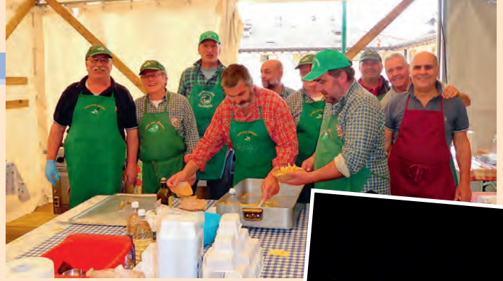
Pranzo in occasione della Festa dei patroni (maggio)