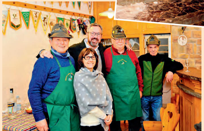
Visita del Sindaco (12 gennaio)