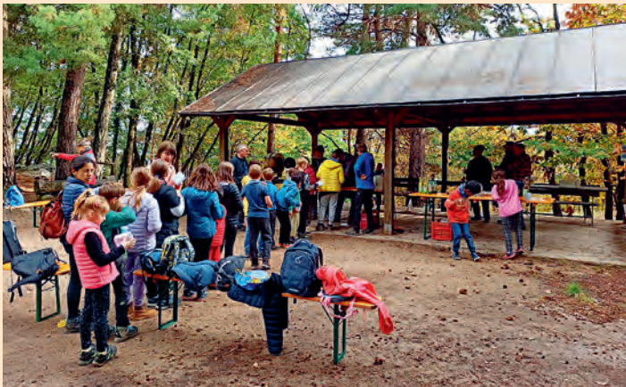
Castagnata con i bambini della Scuola Primaria alle Pozze in collaborazione con la Sezione Sat di Sardegna (ottobre)