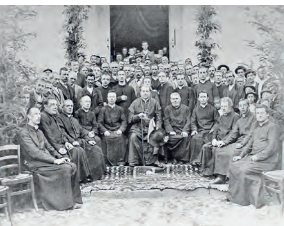
Sardagna, 25 luglio 1895: visita e consacrazione dell'altare maggiore della chiesa di Sardagna di Sua Altezza Illustrissima e Reverendissima Monsignor Eugenio Carlo Valussi Principe Vescovo di Trento. Foto di G.B. Untervegher, dal resoconto del reverendo don Baldassarre Delugan da Panchia', curato locale.

Tornando a noi, sembra ieri che mi apprestavo a scrivere l'Articolo per il Notiziario di fine anno e ne è già trascorso un altro. Come avviene per il Presidente degli Stati Uniti, dove si effettua la verifica di middle term , di metà mandato, vale la pena, dunque, di fare una verifica se il Sindaco e la Giunta hanno interloquuto ed accolto le richieste che abbiamo inviato. Come sapete, la Circoscrizione ha solamente la possibilità di evidenziare delle problematiche e di proporre delle possibili soluzioni, sulla base della conoscenza del territorio. Queste si chiamano "priorità di bilancio" , ovvero opere pubbliche o manutenzioni straordinarie che si ritengono necessarie. Prima fra tutte, quella di un Parcheggio pubblico . Nonostante la richiesta provenisse già dal consiglio circoscrizionale precedente e fosse stata ribadita per ben tre volte in questa attuale consiliatura, solo ai primi di novembre, con il cambio di