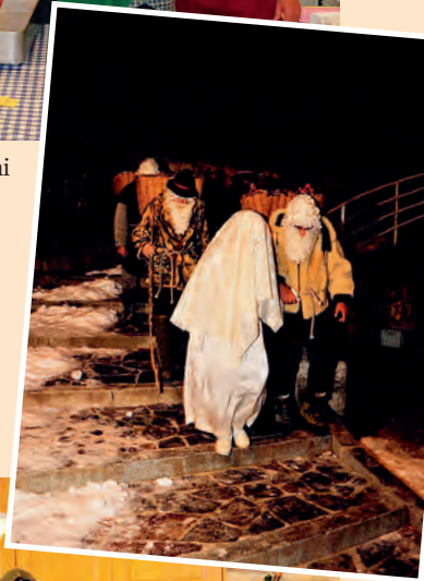
S. Lucia con i pastori (12 dicembre 2022)