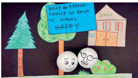
Alcune foto tratte dal video realizzato dai bambini

Tornato settembre, è ora di ricominciare! Uno dei modi migliori è di sicuro quello di fare una bella passeggiata nel bosco, osservarne i colori, respirarne i profumi e...perchè no, raccogliere castagne e poi gustarle in compagnia degli amici. I racconti di alcuni studenti di classe V ci fanno assaporare questo clima autentico, prima dell'arrivo dell'inverno.