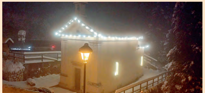
Chiesetta di S. Rocco allestita per il Santo Natale: auguri!