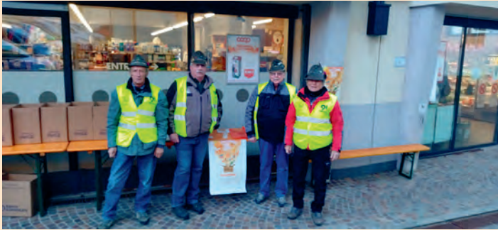
Colletta alimentare per Banco alimentare (18 novembre)