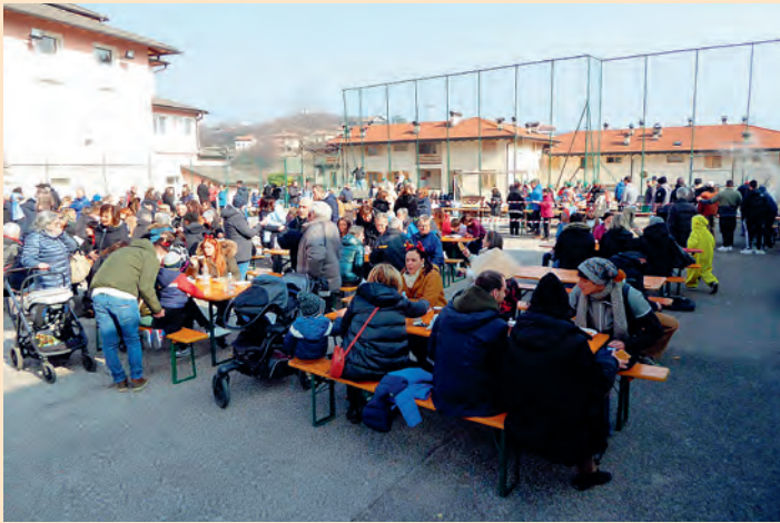
Festa di carnevale (febbraio)