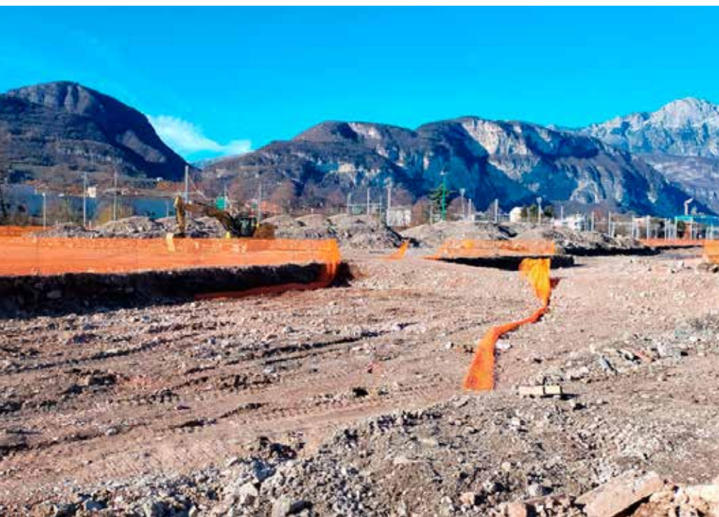
Cantiere Scalo Filzi

Tutte le criticità dell'opera che questa Circoscrizione ha sempre denunciato stanno venendo a galla ed in occasione del prossimo giornalino di giugno dell'anno prossimo 2024 potremo avere una stima più attendibile e precisa riguardo lo svolgimento di questi lavori. ■