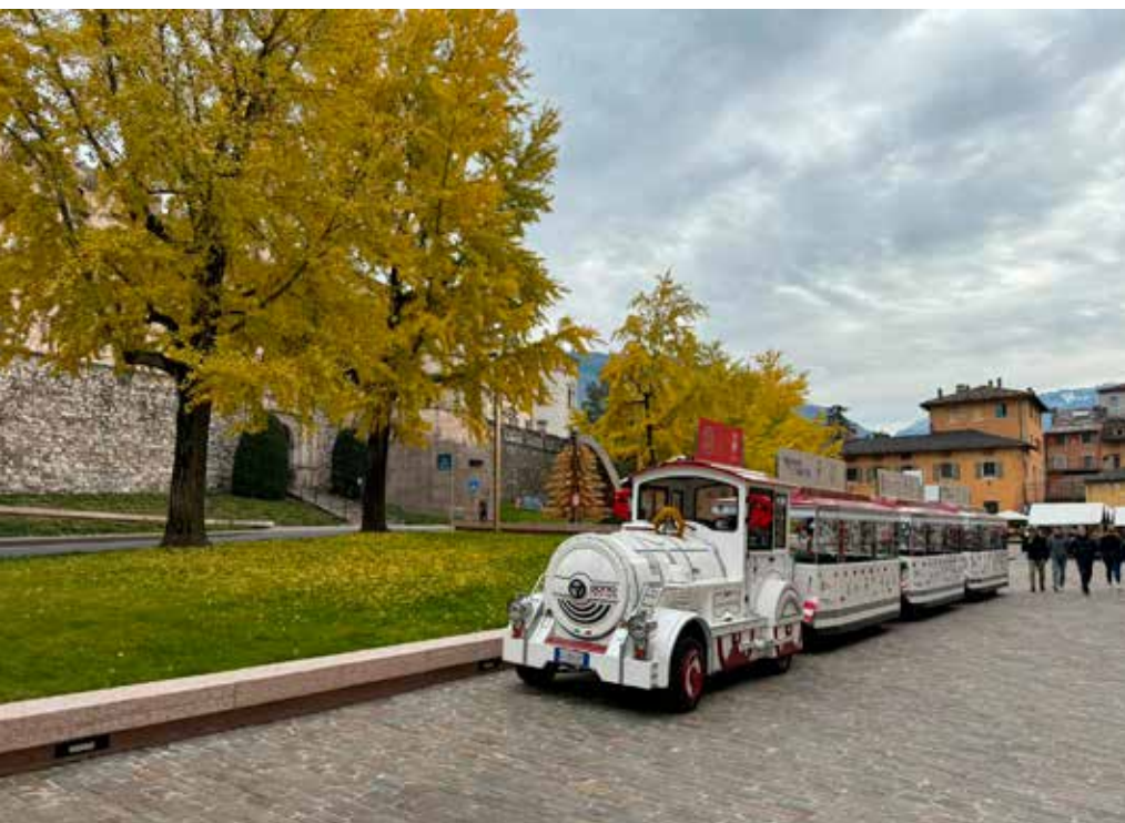
Piazza Mostra, il trenino di Natale

per bambini in fascia scuole elementari, nonché di ascolto, accompagnamento e vicinanza alle famiglie.