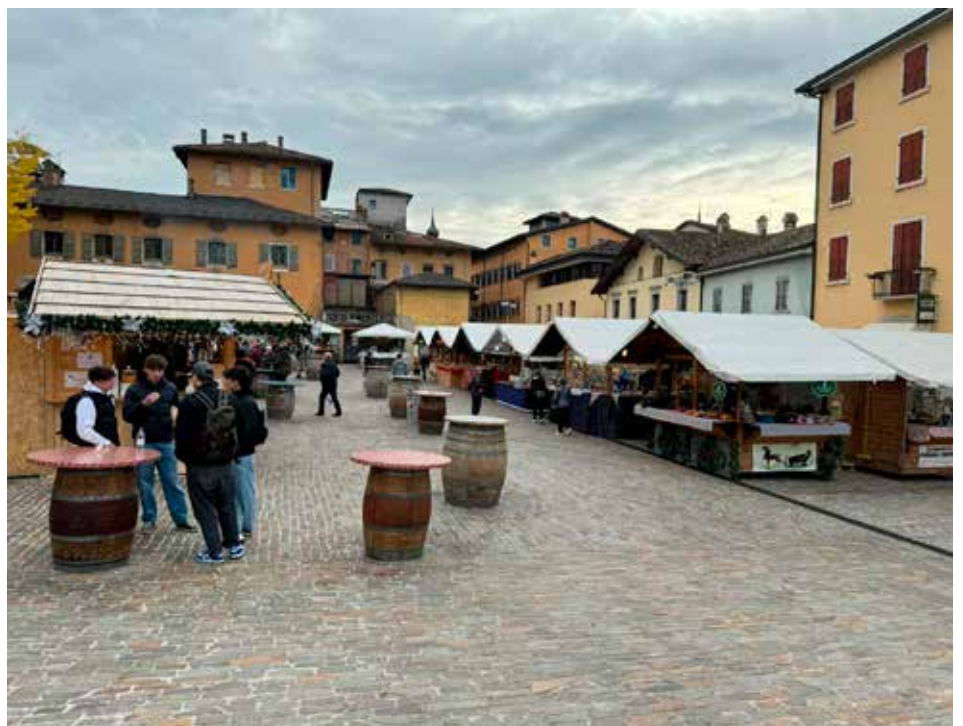
Piazza della Mostra con i mercatini di Natale

Una volta delineato il quadro generale, con specifica individuazione delle funzioni di cui la città necessita, delineate le linee guida , la fase successiva prevede la progettazione concreta e condivisa della città del futuro. In ogni incontro, con lo scopo di favorire la più ampia partecipazione, è stato seguito sempre uno schema ben preciso: all'inizio dei lavori si partiva facendo una descrizione dello stato di fatto con una relazione introduttiva , seguiva poi l'intervento del relatore principale che esponeva il proprio pensiero sull'argomento all'ordine del giorno, nel pomeriggio altri interventi descrivevano esperienze e buone pratiche realizzate in altre città, infine, nella seconda parte del pomeriggio, all'interno di piccoli gruppi di lavoro appositamente strutturati per dare modo ad ogni persona di dire la propria, (nella par-