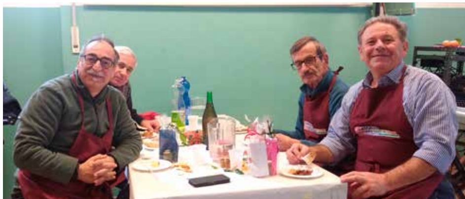
Il gruppo "Il Grembiule" ai Solteri

Nella Parrocchia Duomo-Santa Maria le volontarie grazie alla guida