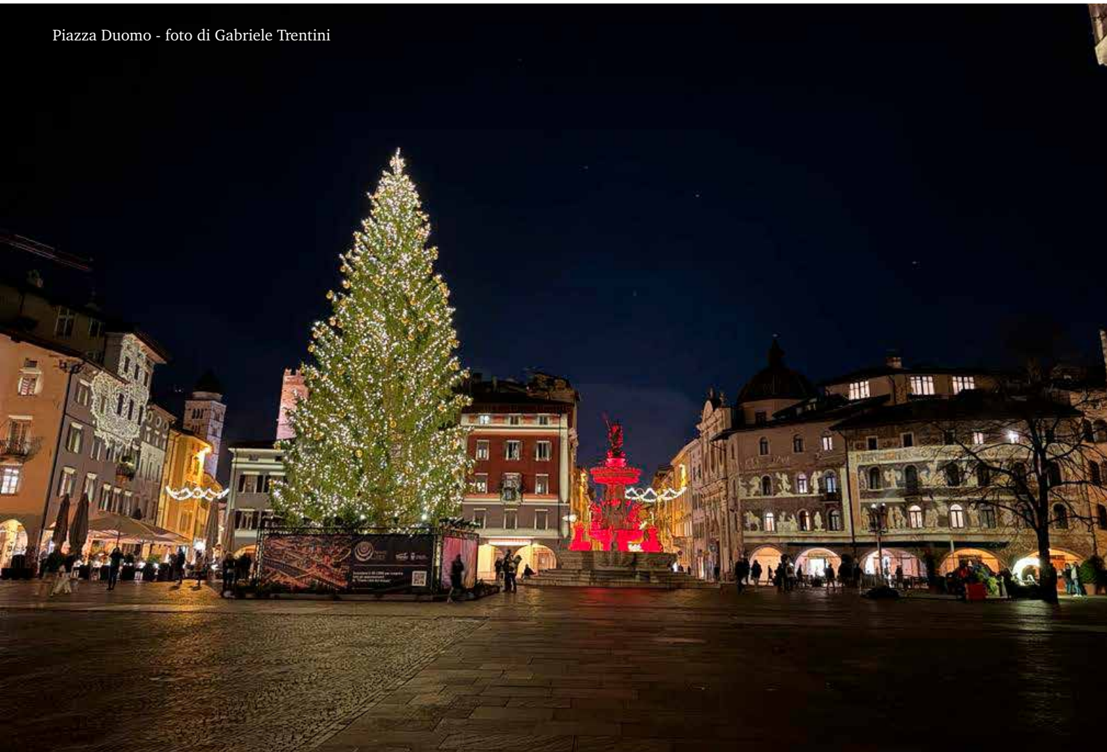
Piazza Duomo

Questo aspetto stimola una riflessione sul futuro assetto urbanistico della nostra città, su come vogliamo che essa sia, quali sono le nostre idee al riguardo