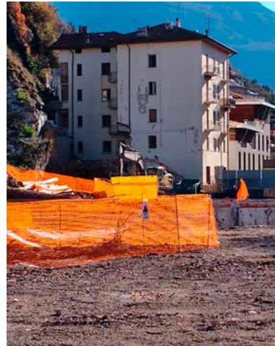
Ultimo edificio da abbattere

Un'altra notizia importante, proprio di questi giorni in cui stiamo andando in stampa con il nostro giorna-