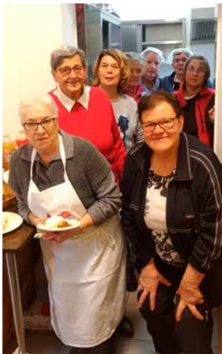
Le volontarie animatrici del Gruppo Anziani ai Solteri