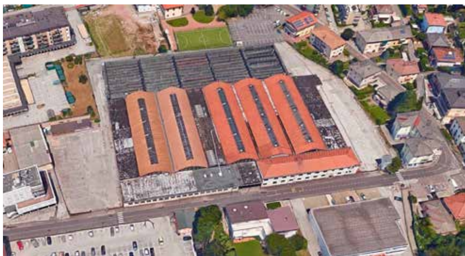
Stabilimento ex Atesina

Le varie conferenze si sono svolte con la partecipazione di molti esperti provenienti anche da altre città, cittadini e anche molti studenti universitari; i dibattiti e soprattutto i gruppi di lavoro ristretti , sono stati un chiaro esempio di partecipazione collaborativa, i cui lavori, per lo più, come si diceva sopra, si sono svolti all'interno dell'ex deposito Atesina di via Marconi. Combinazione, per l'ex Atesina , circa 20 anni fa, si svolse un esperimento simile, con l'aiuto degli architetti del Gruppo Palomar e con il coinvolgimento di