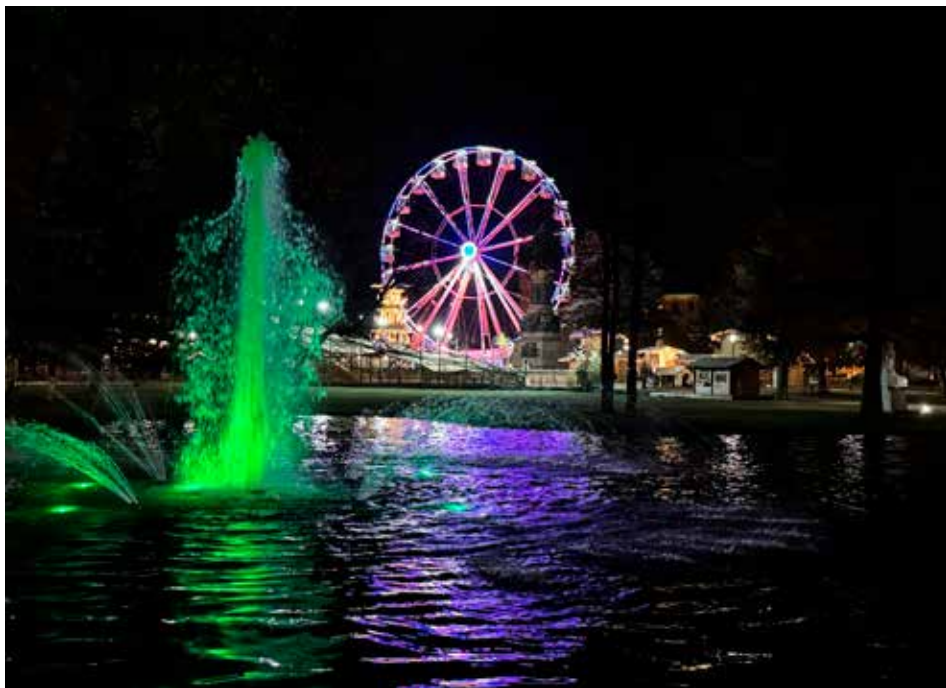
Piazza Dante

vi, attività ludiche e di aggregazione anche in collaborazione col “Comitato San Martino dentro” con laboratori, mostre e momenti dedicati alle famiglie e alla popolazione in generale. Continuano da quest'estate gli incontri settimanali di ginnastica dolce e Qigong presso l'Area di via Manzoni che coinvolgono un gruppo affezionato di residenti.