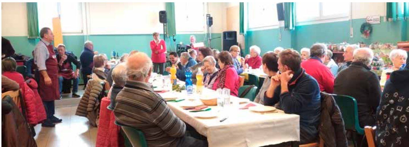
Sala parrocchiale, Gruppo Anziani ai Solteri, pranzo di Natale