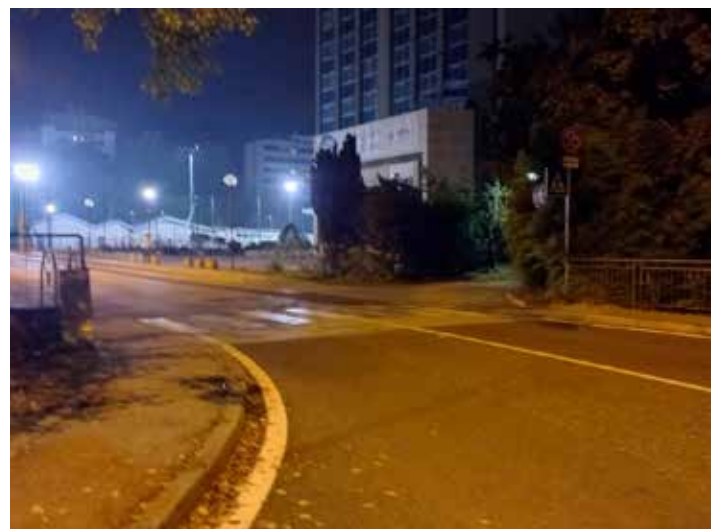
Passaggio pedonale in via Lunelli

efficace è un importante miglioramento della sicurezza stradale, che consente di individuare con congruo anticipo la presenza di attraversamenti pedonali al fine di indurre gli automobilisti ad una riduzione della velocità. ■