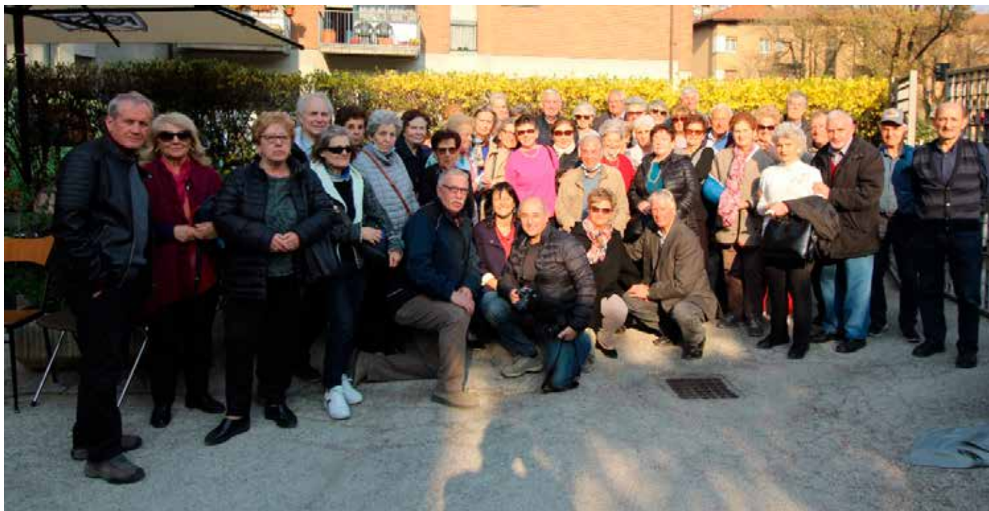
Foto di gruppo, in occasione della celebrazione del 35° di attività del Circolo “La Ginestra” - marzo 2022

L’invito alla popolazione del Rione di Cristo Re, ma non solo, è quello di effettuare una visita, senza impegno, al Circolo “La Ginestra” per vedere di persona l’ambiente, il suo funzionamento e le varie attività che sono svolte e magari valutare la possibilità di una futura collaborazione. ■