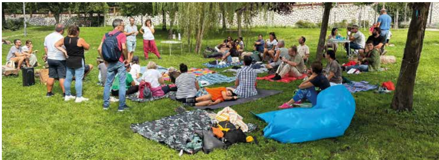
Il picnic della famiglia al parco di Martignano in occasione del lancio del progetto. Un'attenzione particolare ai più giovani

Il ruolo dei genitori resta quindi fondamentale: guidare, mediare e accompagnare i figli nel percorso di scoperta del digitale, aiutandoli a sviluppare un uso consapevole, sicuro e critico delle piattaforme e dei contenuti online.