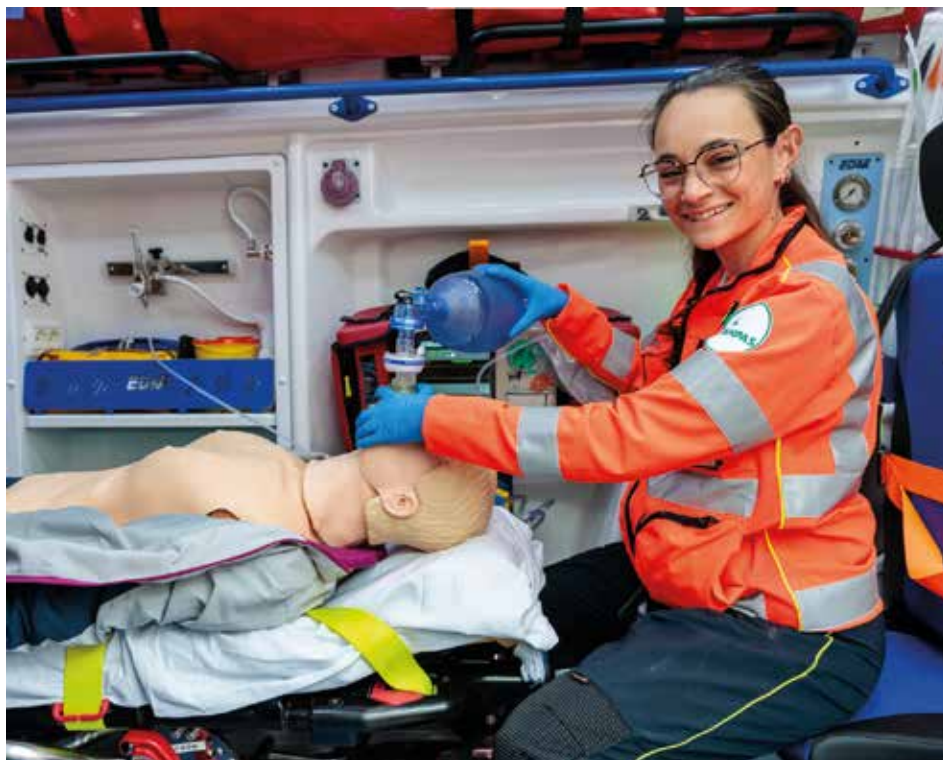
Una volontaria trentina attiva nel soccorso sanitario

In questo quadro strategico, le nostre Circoscrizioni, già riconosciute come “presidi di comunità” , sono l'architrave della partecipazione civica. La vera trasformazione verso il futuro è guidata dall' “Animazione di comunità” . Questa pratica sociale