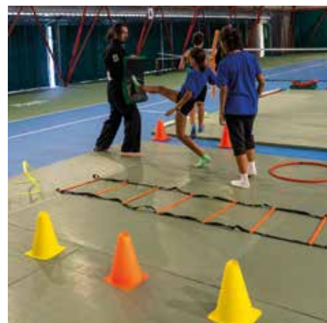
Alcune discipline sportive presenti alla Festa dello Sport dell'Argentario 2025