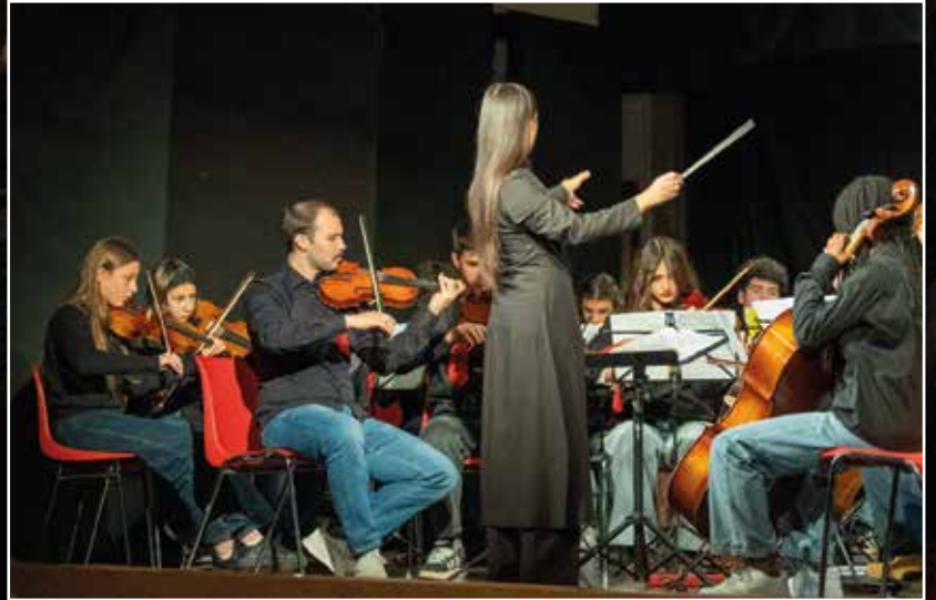
L'Orchestra FuoriTempo all'opera

che hanno trovato nella musica uno spazio di espressione e crescita condivisa. L'esecuzione proposta, intitolata "Suoni e voci: sinfonia al femminile" , ha intrecciato sette storie di donne, vicine e lontane nel tempo... donne coraggiose, che hanno contribuito alla storia opponendosi a stereotipi e limitazioni, ricordando come il genere non debba mai essere un ostacolo alle proprie aspirazioni. L'appuntamento di fine novembre è ormai un momento consolidato per la Circoscrizione e per il Circolo Culturale di Cognola. La presidente,