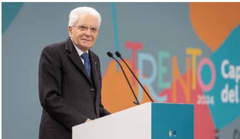
L'intervento del Presidente della Repubblica Sergio Mattarella in occasione della cerimonia di “Trento: Capitale europea e italiana del volontariato” il 3 febbraio 2024

Il “Modello Trento” fornisce al nostro territorio gli strumenti per realizzare una comunità più equa e so-