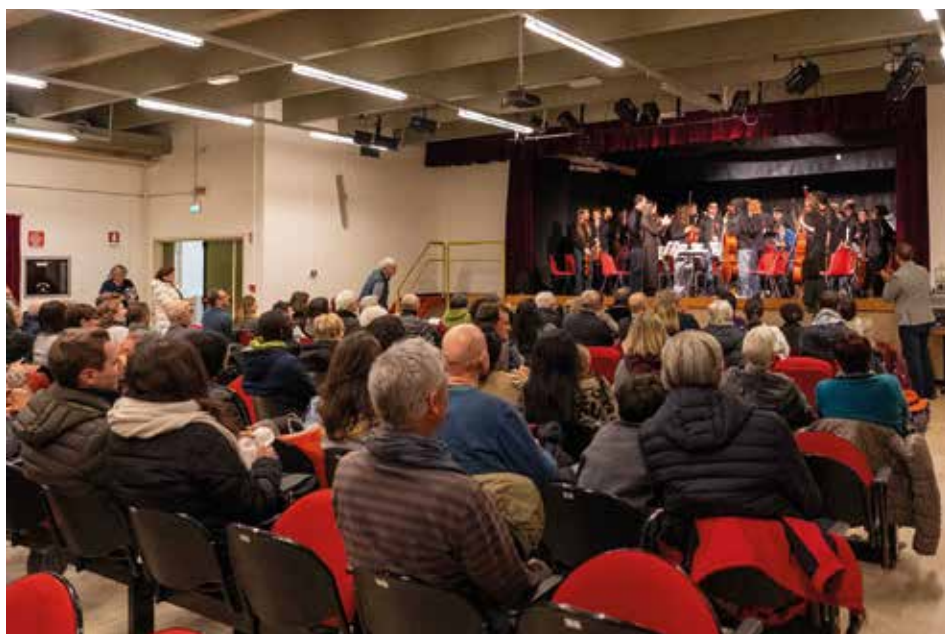
Il folto pubblico intervenuto alla serata