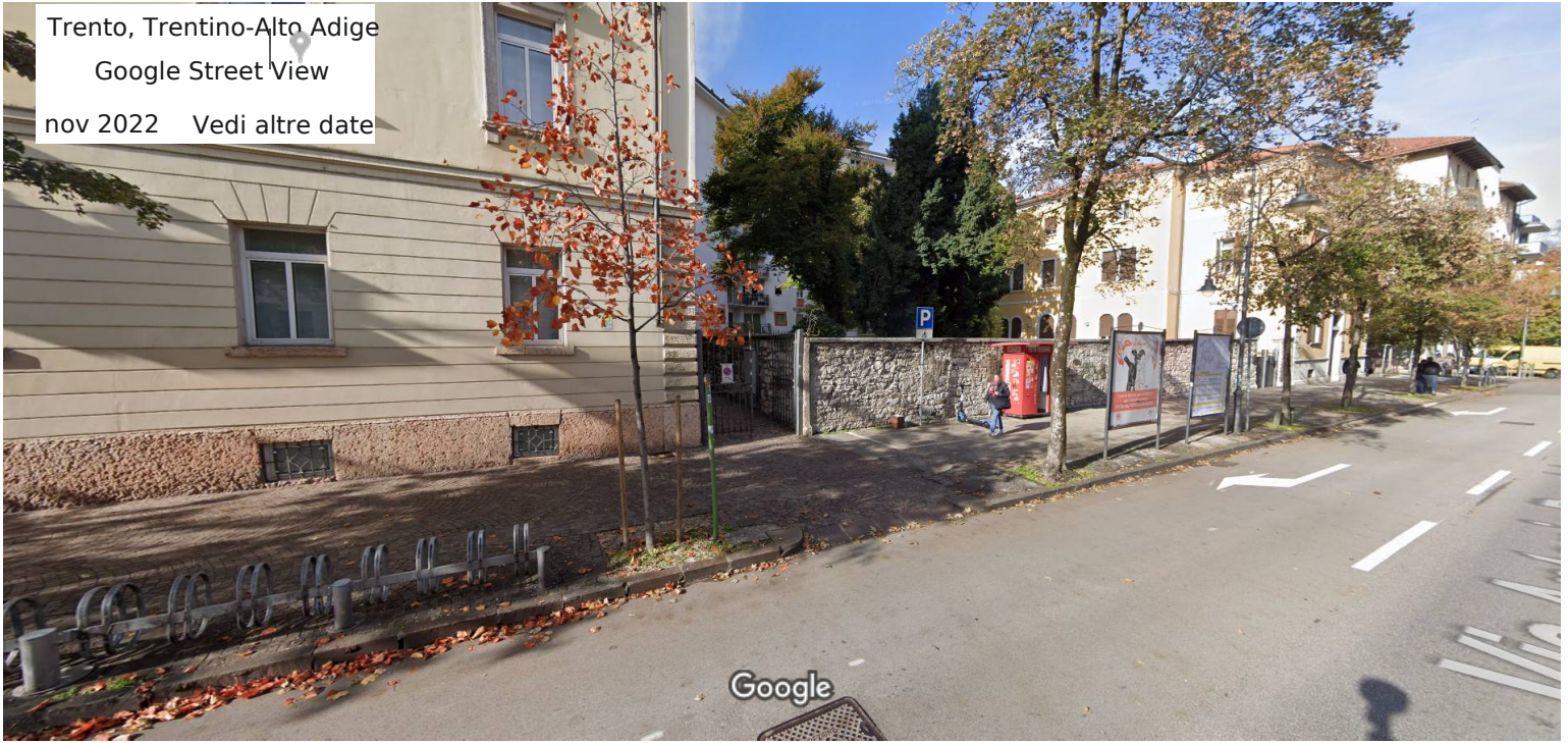
Data dell'immagine: nov 2022 Google

Trento, Trentino-Alto Adige Google Street View nov 2022 Vedi altre date