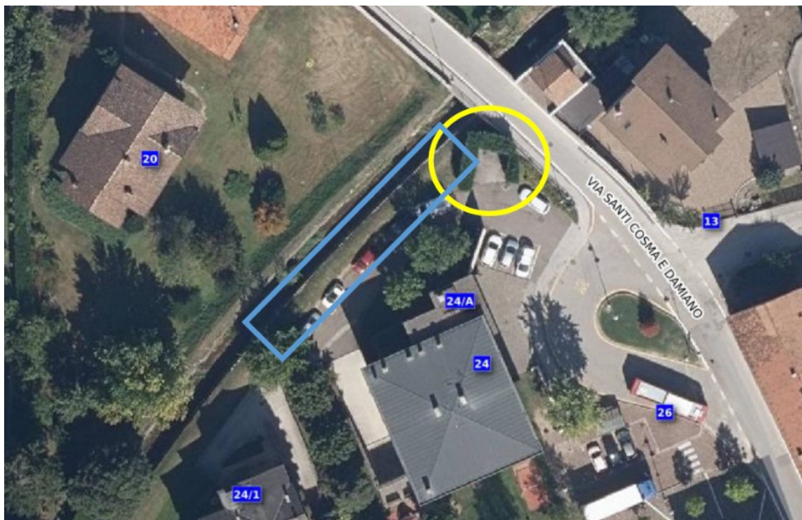
foto 3 - Tomo del torrente Vela e siepe a lato del centro polifunzionale