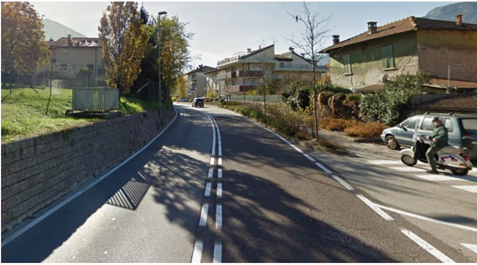
Allegato 2. Possibile segnaletica per garantire la sicurezza ai ciclisti (presente a Bolzano).