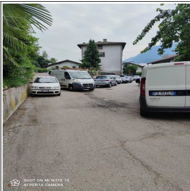
Foto 5 – Groviglio di auto del parcheggio privato, tra le quali dovrebbe passare la ciclabile