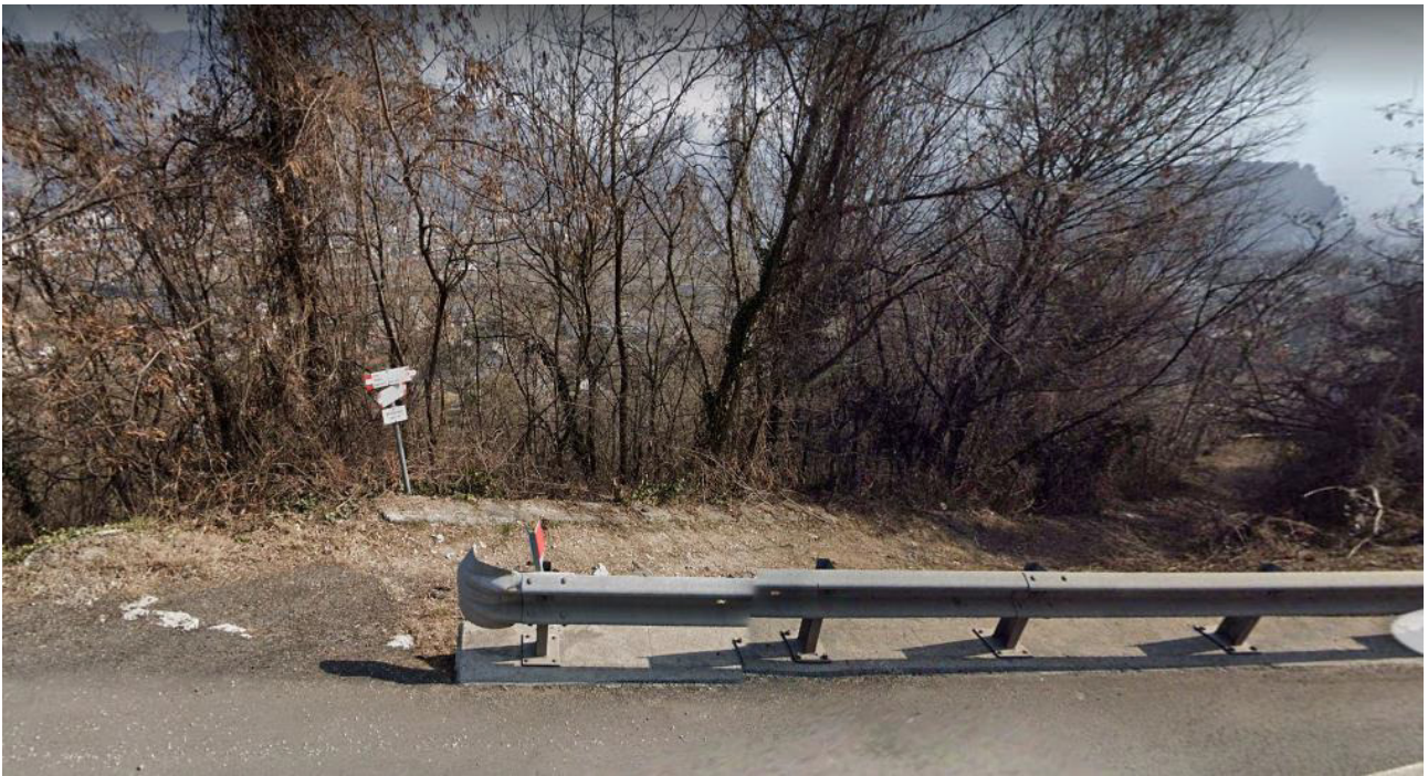
foto 3 - Intersezione del tratto sterrato che prolunga via San Giorgio con la Strada Gardesana