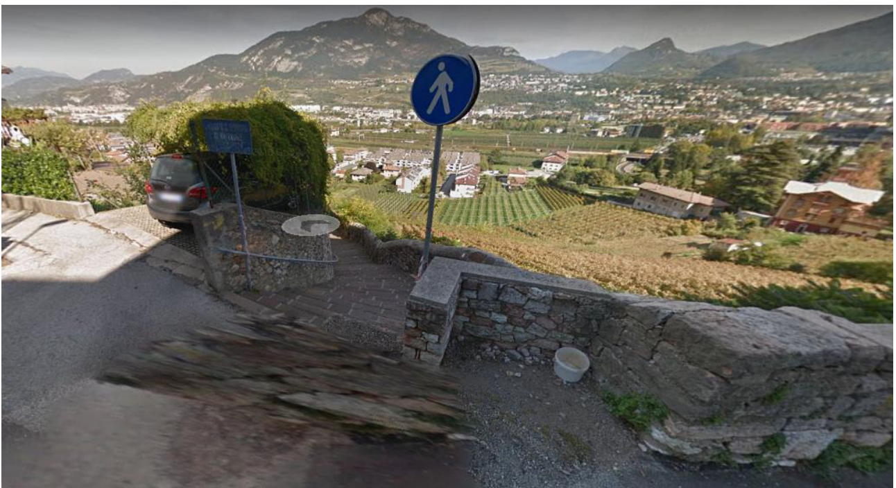
foto 4 - Materiale ghiaioso all'imbocco del tratto pedonale di via Loc. Vela