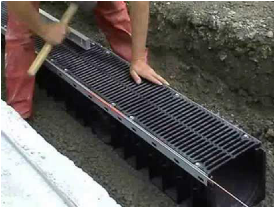
foto 5 e 6 - Pavimentazione in smolleri e grate per il drenaggio dell'acqua superficiale