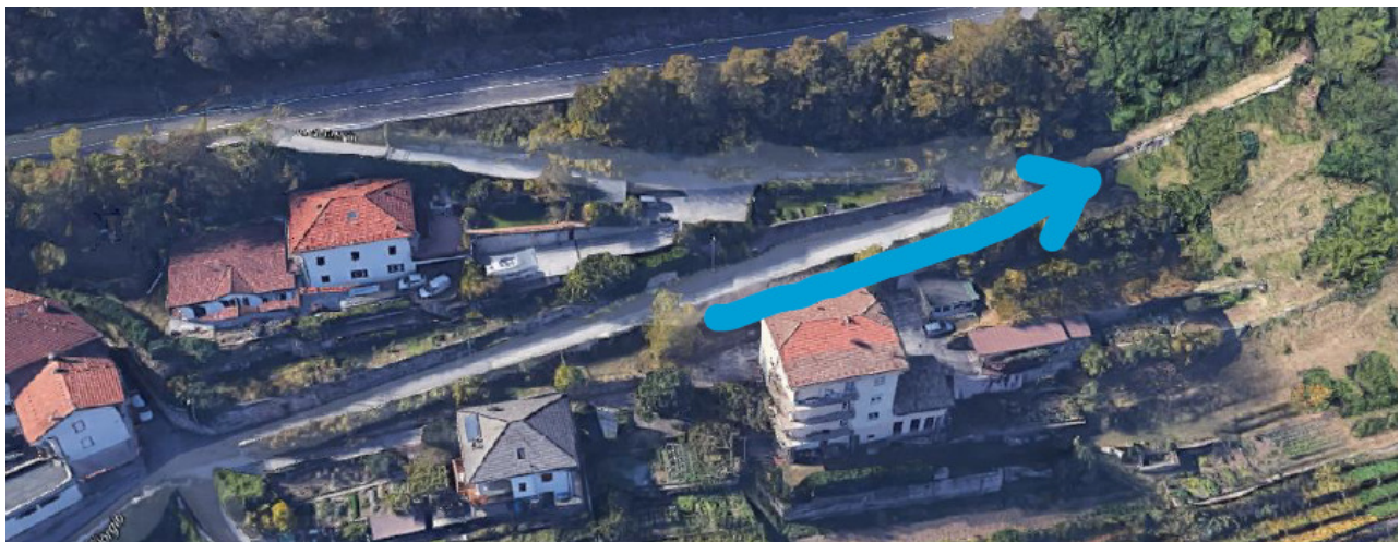
foto 2 - Via San Giorgio ed il suo prolungamento sterrato verso la Strada Gardesana