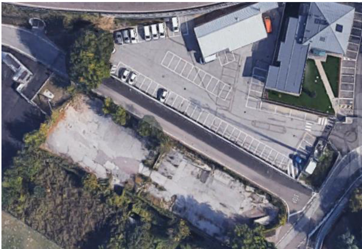
Foto 3 - Carreggiata ampliata con rimodulazione dello spazio a parcheggio (2020)