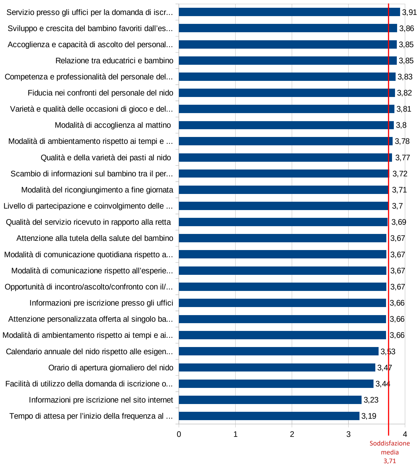
Grafico 3 – Risultati singoli aspetti oggetto di indagine per il servizio di nido d’infanzia – 2023/2024

Il seguente grafico elenca tutti gli aspetti in ordine decrescente di soddisfazione media.