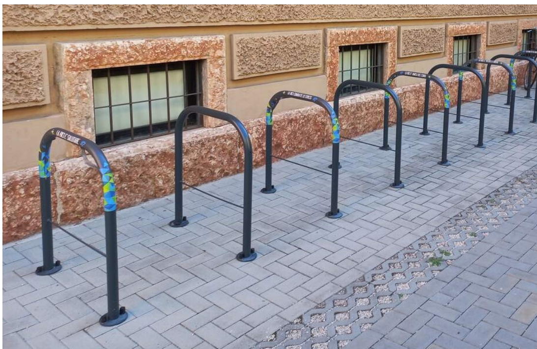
Immagine 3b – tipologia Archetto singolo

Con riferimento alla Fase 2, trattandosi di area al di fuori del centro storico, e dove quindi non è necessario lo smontaggio/rimontaggio a causa di manifestazioni/eventi, si prevede l'utilizzo della tipologia "ARCHETTO SINGOLO" (Immagine 3b).