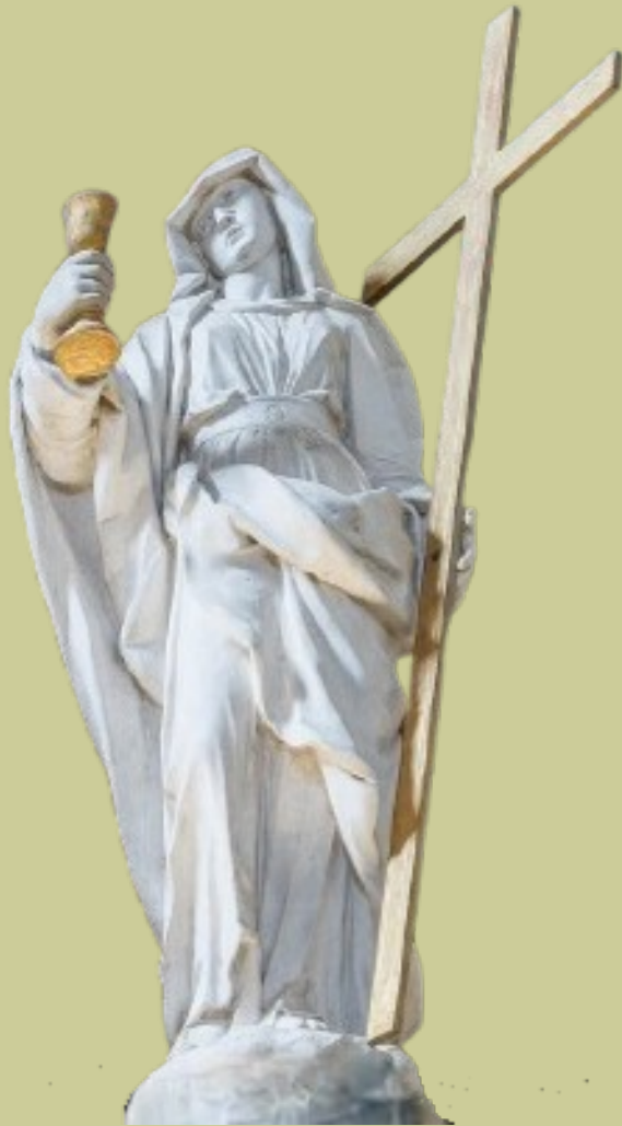
Giuseppe Cantone 1715 c. - Salò