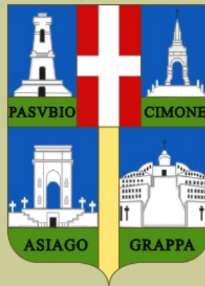
Stemm della Provincia di Vicenza (1938)