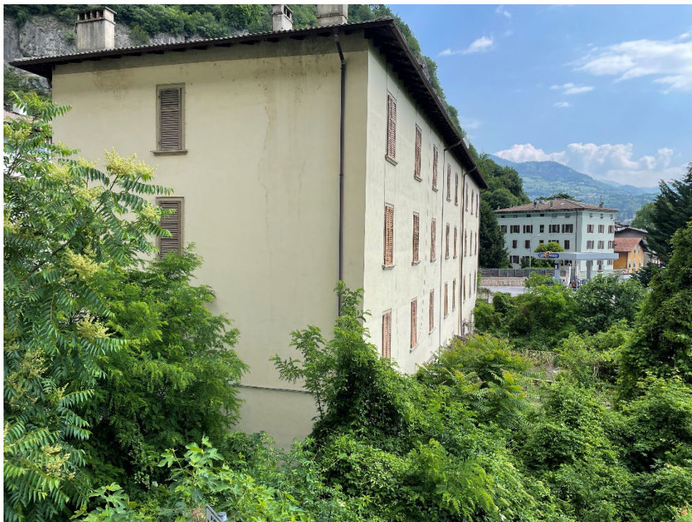
Foto 08 - Vista della p.ed. 2744 da ovest