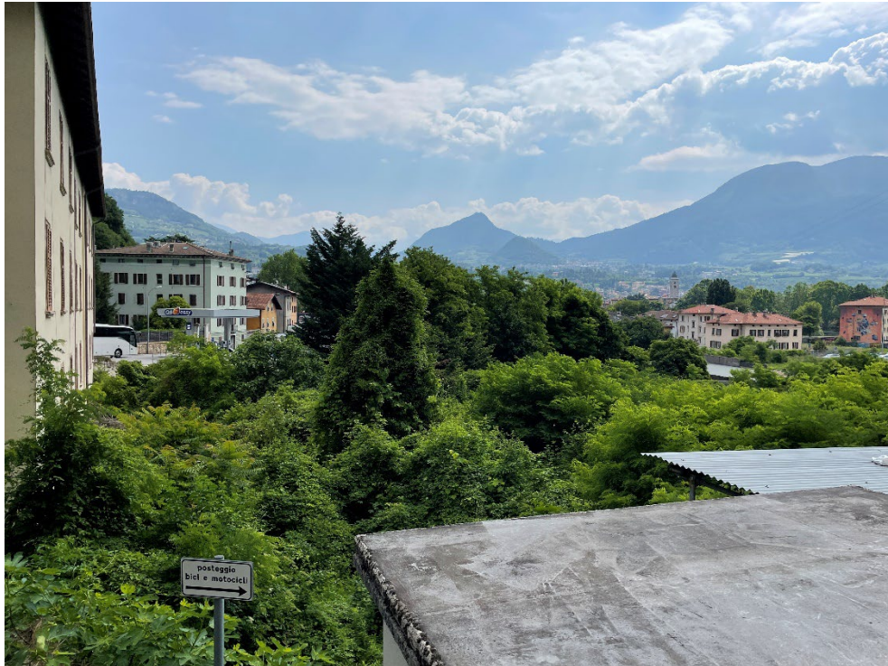
Foto 07 - Vista della p.ed. 4968 da ovest