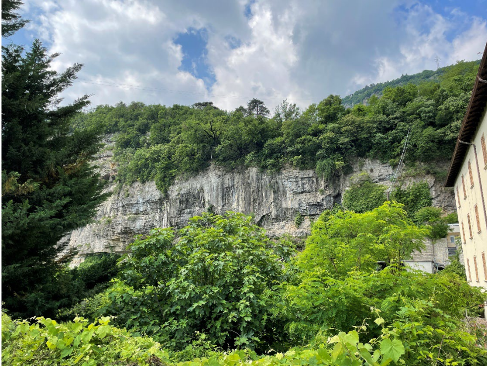
Foto 03 - Vista della balza rocciosa a ovest