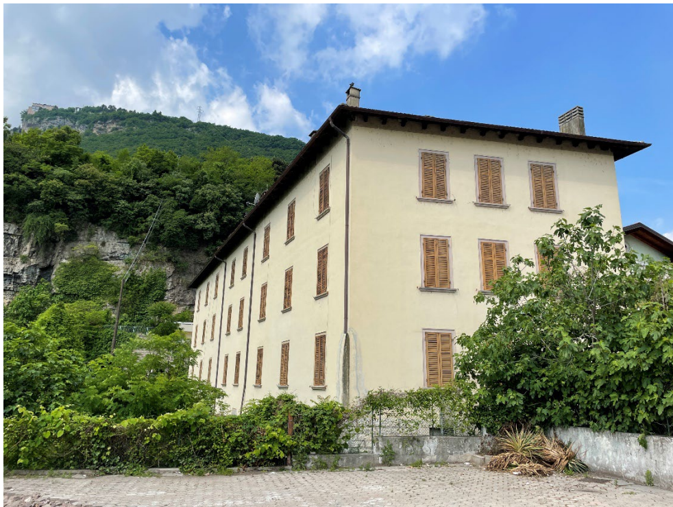
Foto 05 - Vista della p.ed. 2744 da sud-est