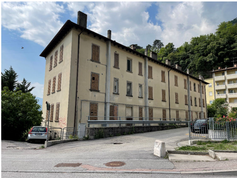
Foto 06 - Vista della p.ed. 2744 da nord