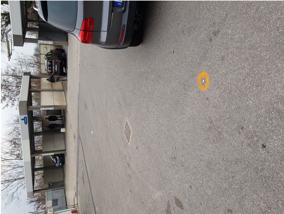
Foto 11 - Materializzazione confine p.ed. 6618