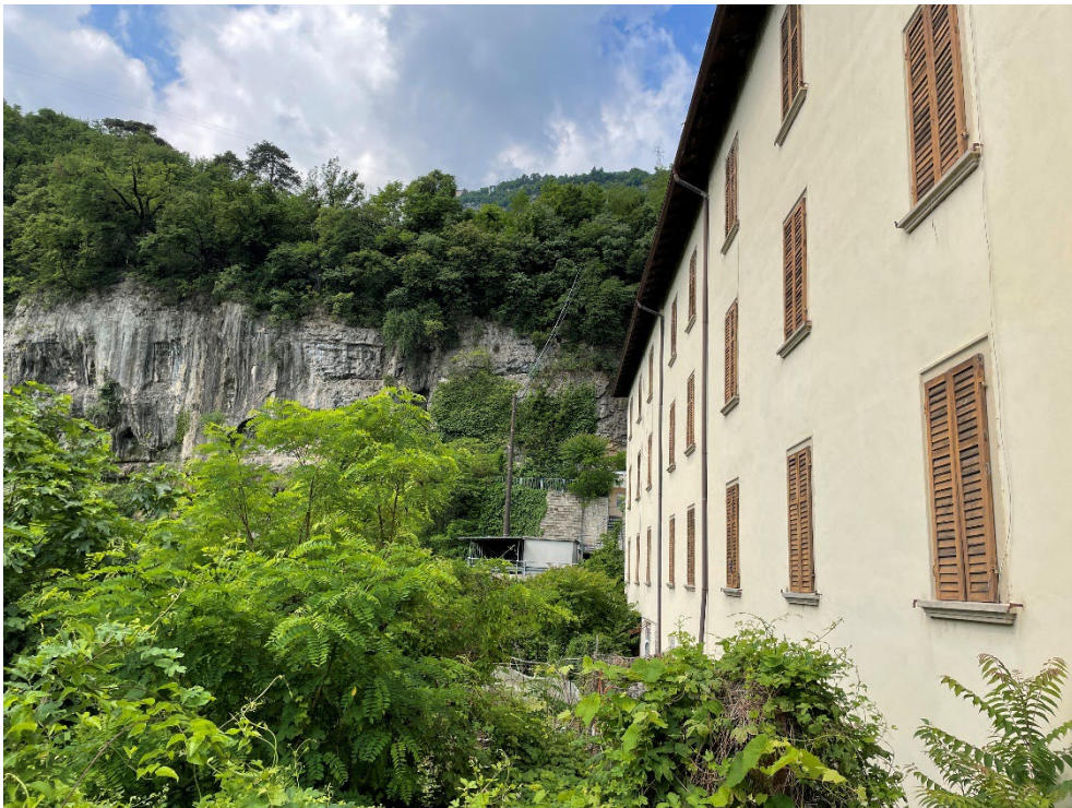
Foto 04 - Vista della p.ed. 4968 da est