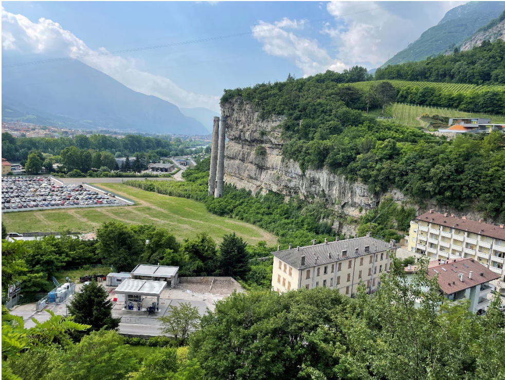
Foto 01 - Veduta dell'ambito dal Doss Trento