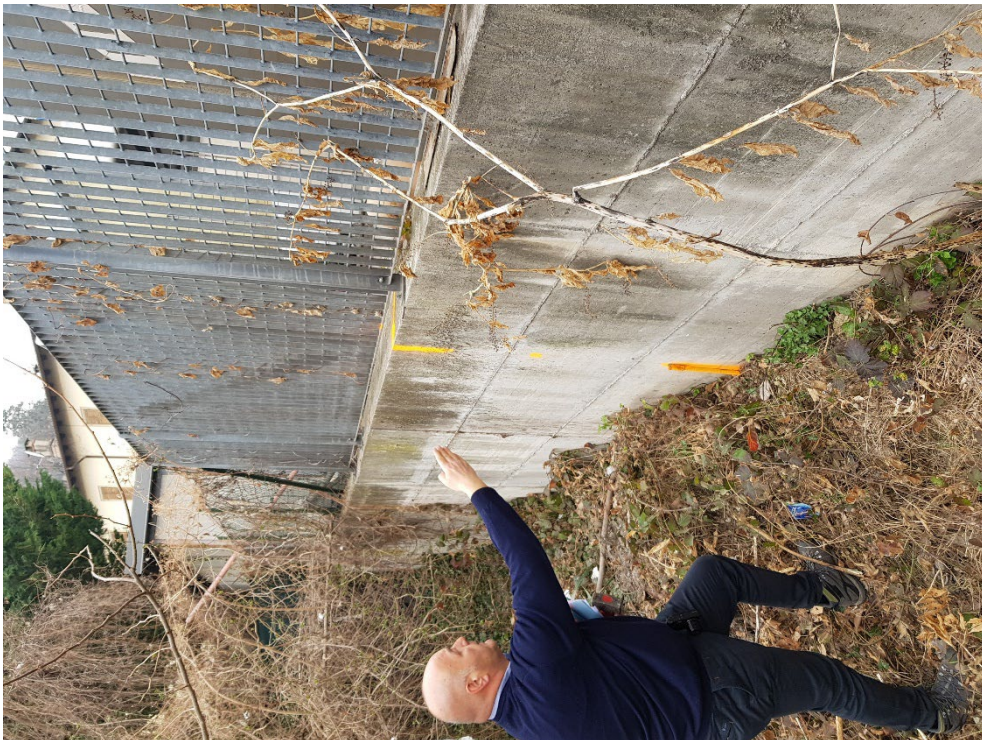
Foto 12 - Materializzazione confine p.ed. 6618