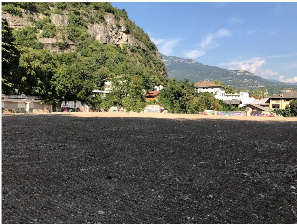
Foto 10 - Vista dell'ambito da ovest (2018 - ultimazione bonifica)