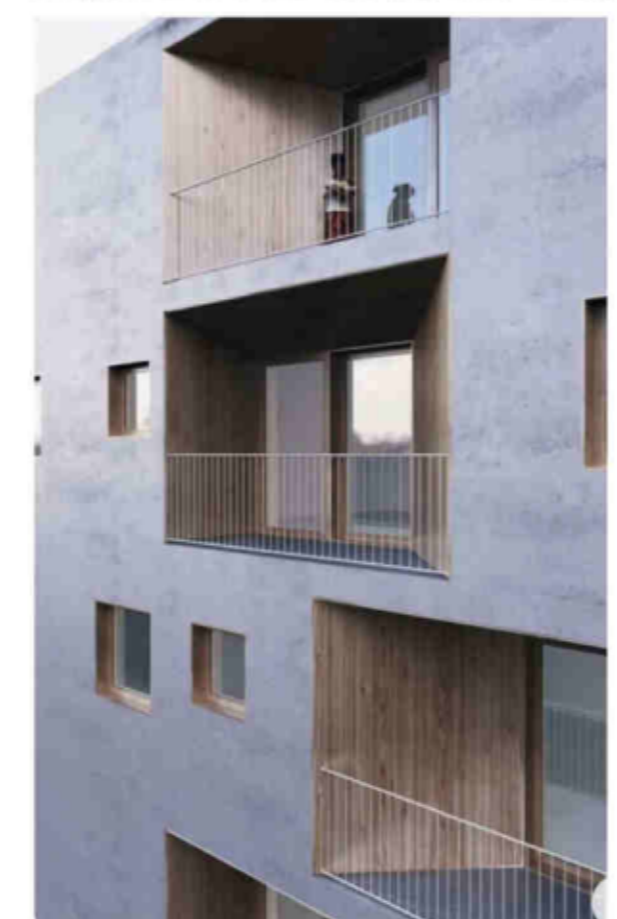
Esempio serramenti e forma+rivestimento nicchie + parapetti