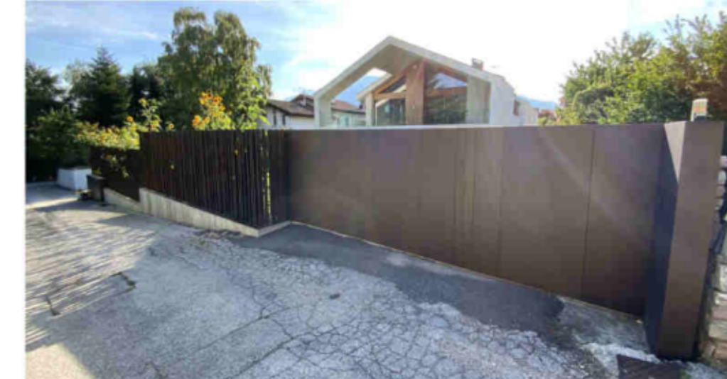
Esempio cancello e recinzione