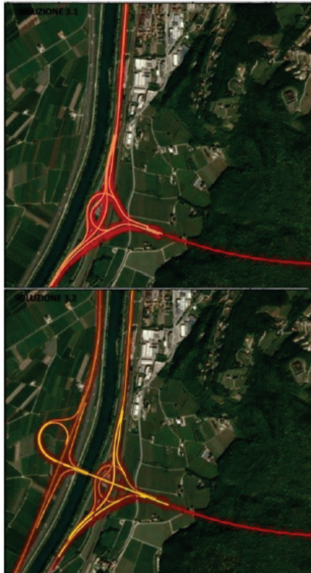
Figura 6.34 Svincolo Mattarello - Soluzioni 3.1 e 3.2 su fotopiano

Il progetto predisposto da A4, in applicazione della disponibilità all'intesa dimostrata dalla Provincia autonoma di Trento, produrrebbe inoltre l'incremento del 2,6 – 3,2% sulla tratta A22 a nord dell'innesto per le ipotesi che non prevedono il raccordo diretto e del 6% nel caso di raccordo diretto.