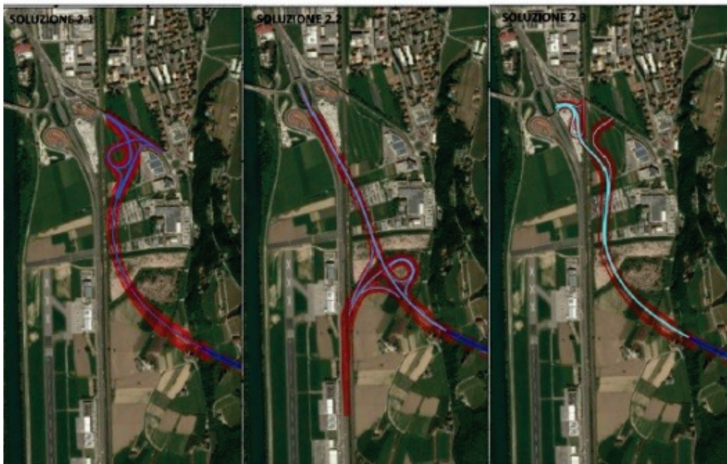
Figura 6.31 Svincolo di Trento Sud - Soluzioni 2.1 2.2 e 2.3 su fotopiano