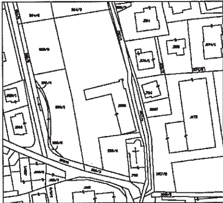
ESTRATTO MAPPA SCALA 1:1000

SPAZIO RISERVATO ALL'UFFICIO CATASTO Subalterni controllati in data _____ Il Tecnico Catastale _____ Mod.97 n. _____ P.C.imp. _____ Cat. _____ Cl. _____